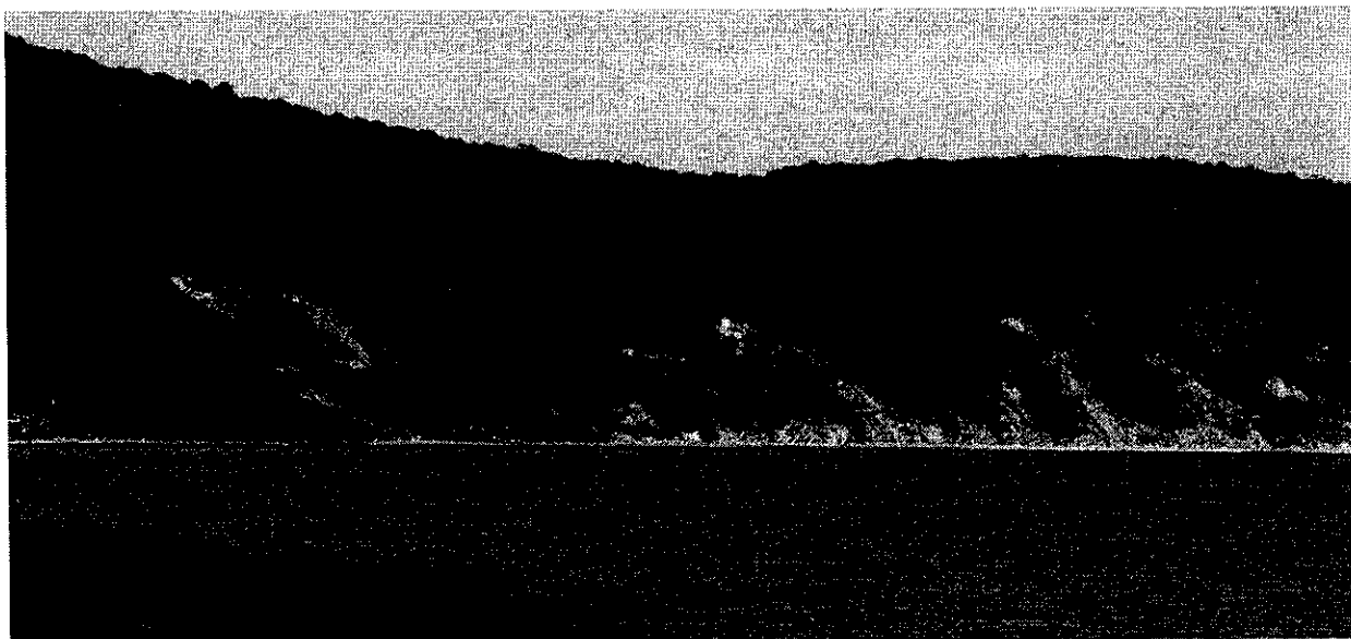
Рисунок 2. Памятник природы «Бор сосны крымской Бетгинский»