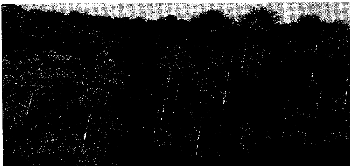
Рисунок 1. Памятник природы «Бор сосны крымской Бетгинский»

Фотографии памятника природы регионального значения: