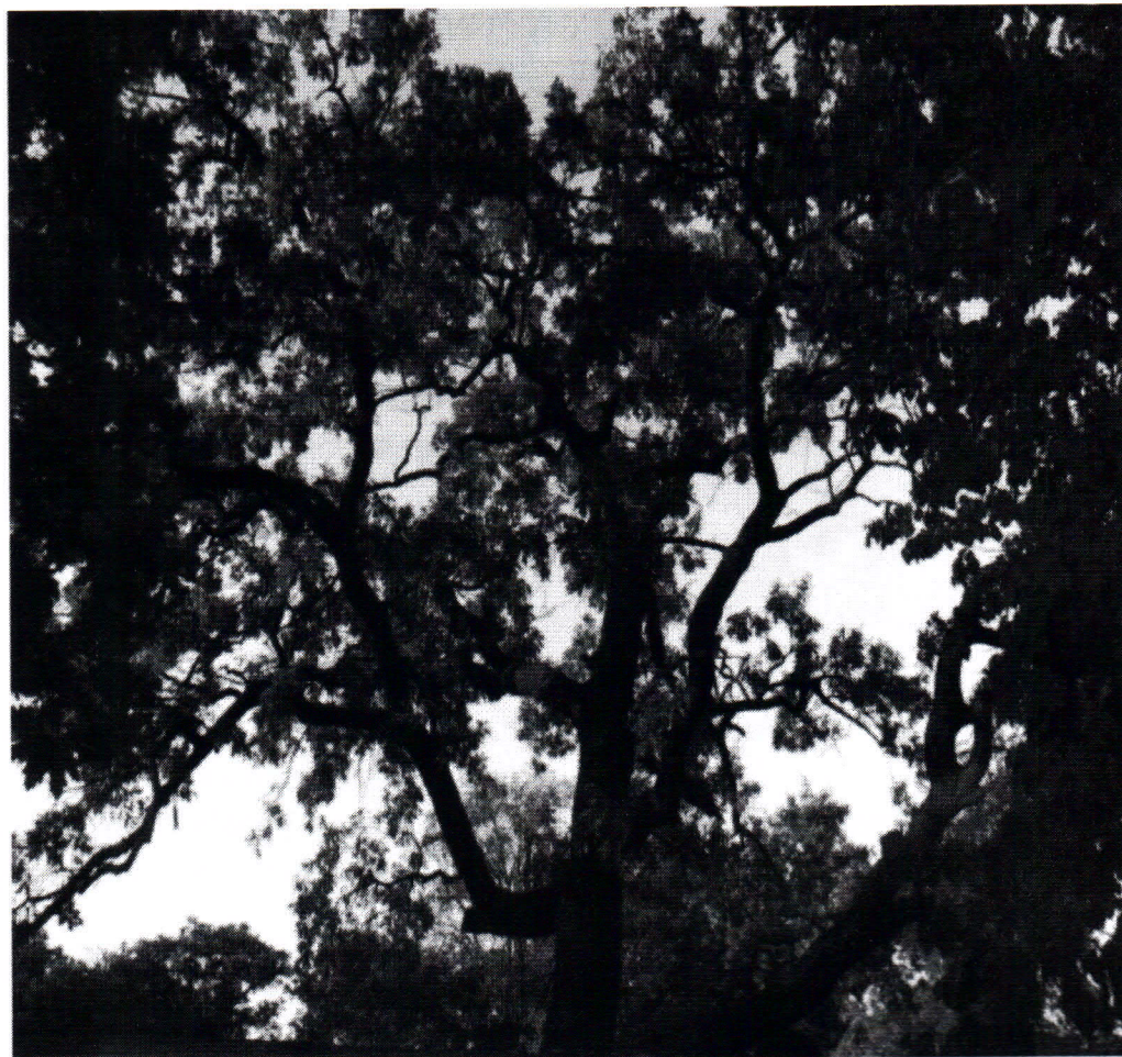
Рисунок 1 - Памятник природы «Дуб Долгожитель»

Дополнительные материалы – фотографии памятника природы или наиболее характерных его частей, картографический материал (карты (схемы) расположения памятника природы и охранной зоны (1:100000, 1:50000), карты (схемы) памятника природы с обозначением границ (1:2000 или 1:500, в зависимости от занимаемой площади), Охранное обязательство, иные материалы.