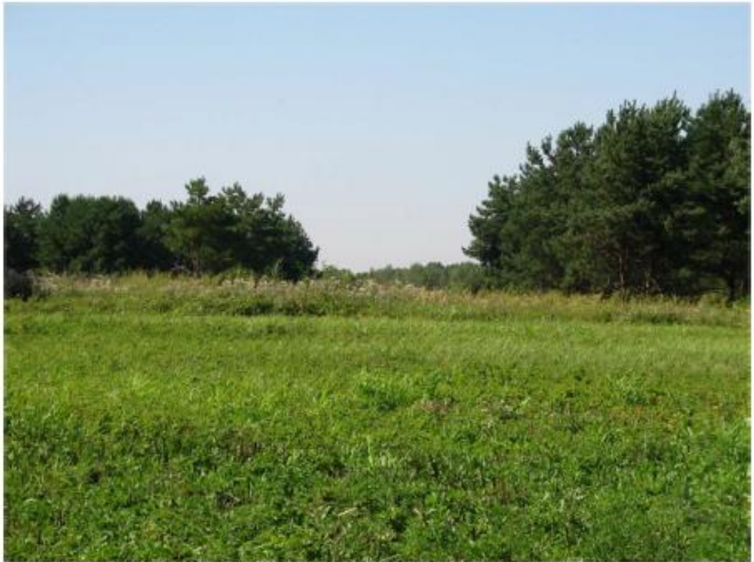
Рисунок 4 - Памятник природы «Лесопарк «Юбилейный»