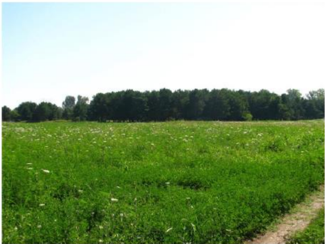
Рисунок 3 - Памятник природы «Лесопарк «Юбилейный»