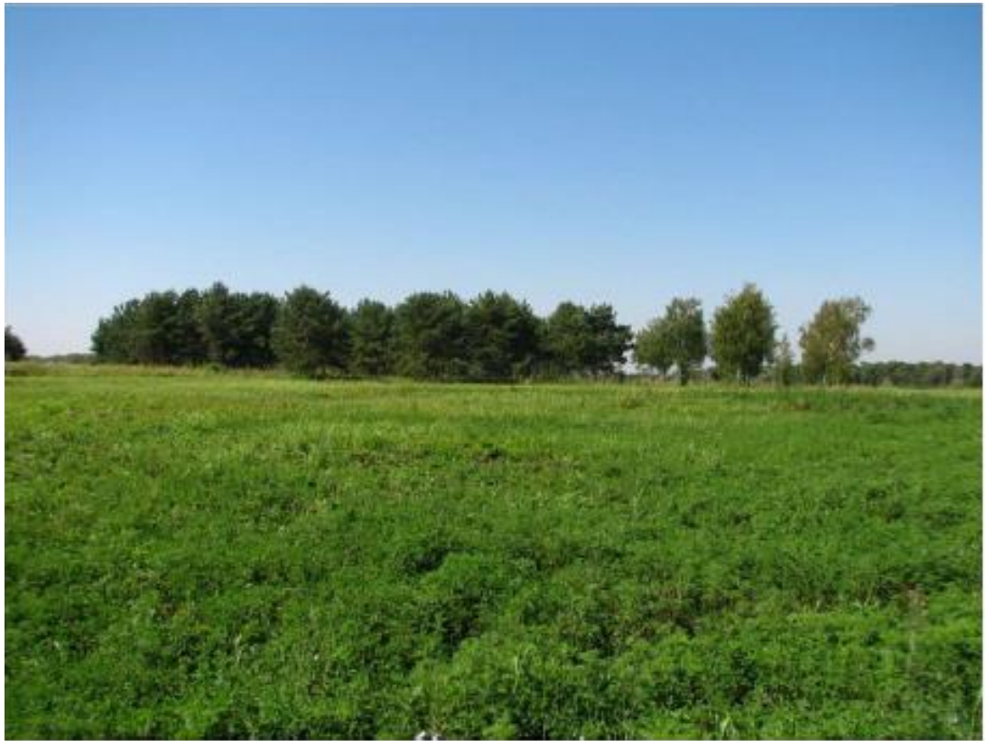
Рисунок 6 - Памятник природы «Лесопарк «Юбилейный»