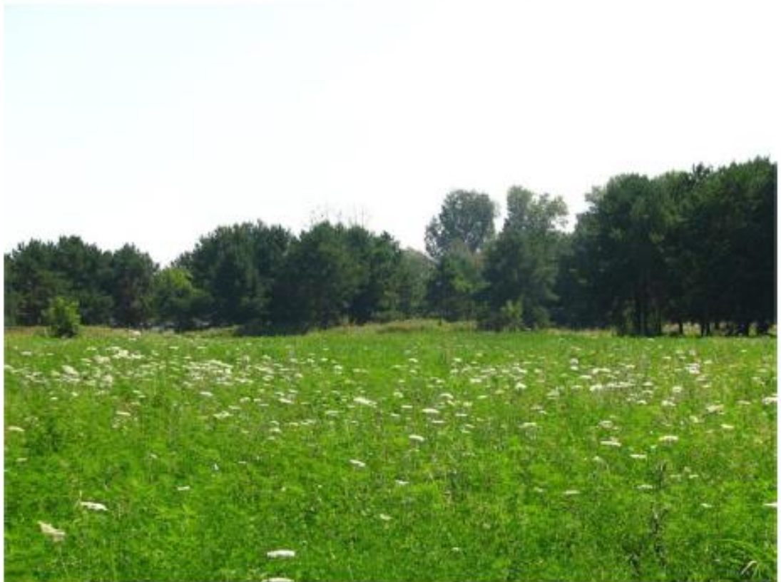
Рисунок 2 - Памятник природы «Лесопарк «Юбилейный»