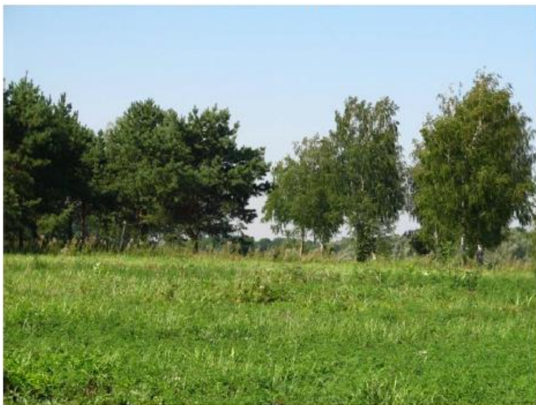
Рисунок 1 - Памятник природы «Лесопарк «Юбилейный»

Дополнительные материалы – фотографии памятника природы или наиболее характерных его частей, картографический материал (карты (схемы) расположения памятника природы и охранный зоны (1:100000, 1:50000), карты (схемы) памятника природы с обозначением границ (1:2000 или 1:500, в зависимости от занимаемой площади), Охранное обязательство, иные материалы.