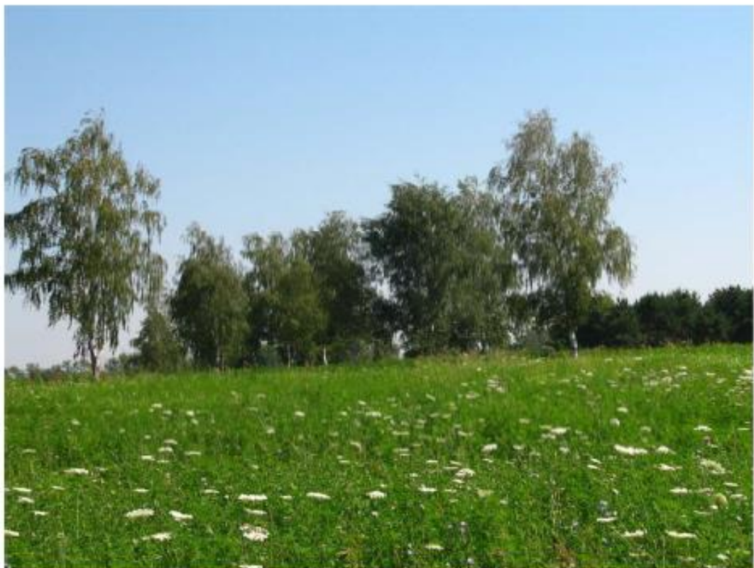
Рисунок 7 - Памятник природы «Лесопарк «Юбилейный»