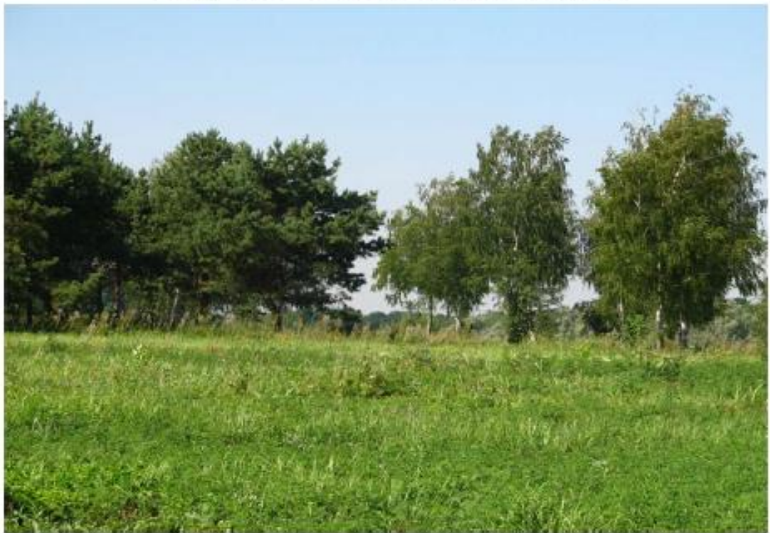
Рисунок 8 - Памятник природы «Лесопарк «Юбилейный»