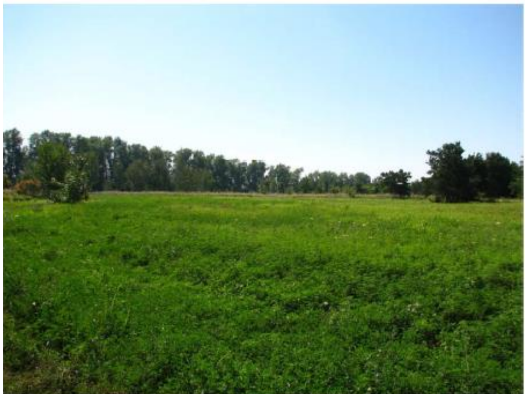
Рисунок 5 - Памятник природы «Лесопарк «Юбилейный»