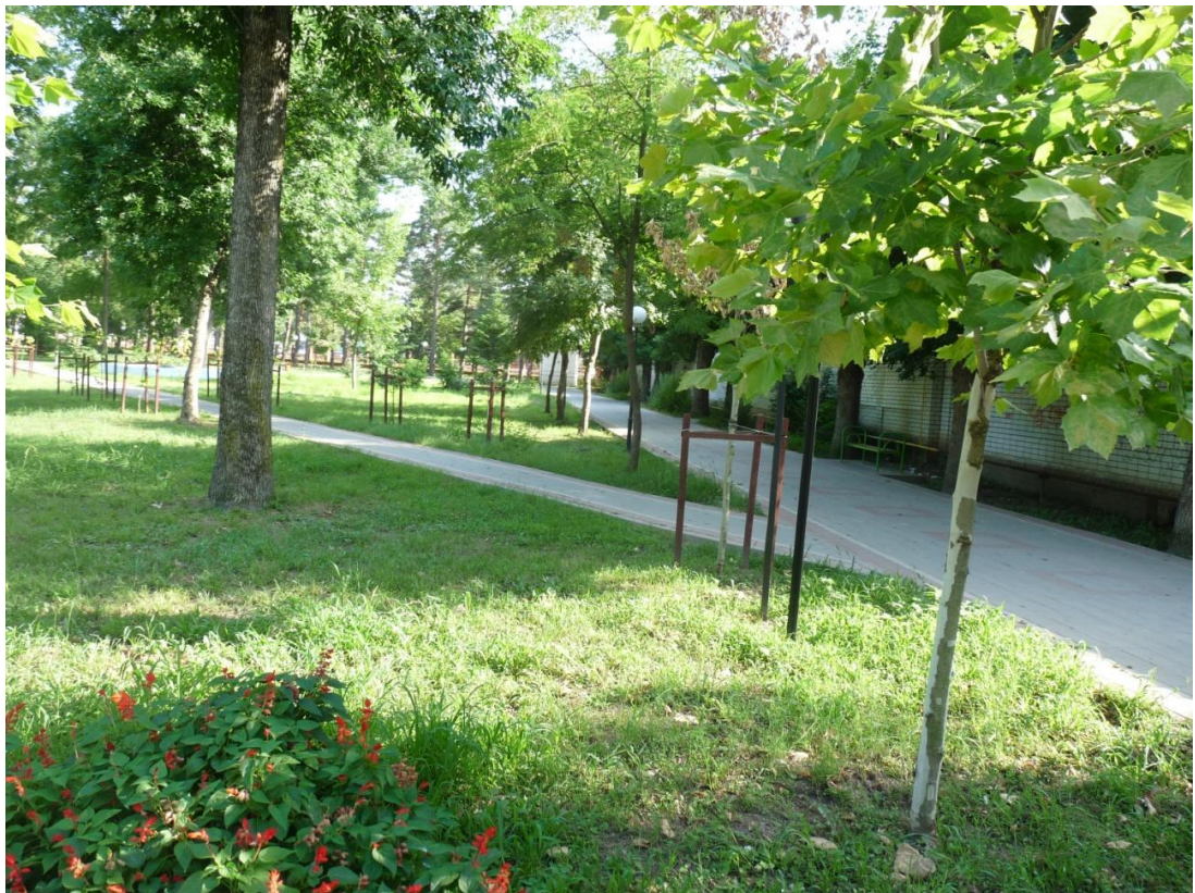
Рисунок 5 – Памятник природы «Парк имени Пушкина»