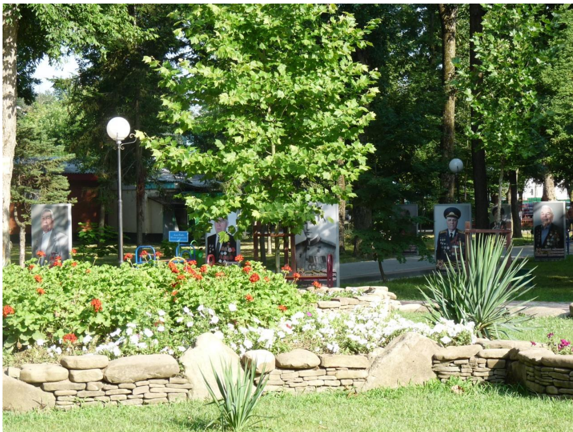
Рисунок 6 – Памятник природы «Парк имени Пушкина»