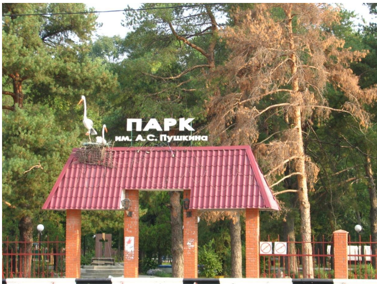
Рисунок 1 – Памятник природы «Парк имени Пушкина»

Дополнительные материалы – фотографии памятника природы или наиболее характерных его частей, картографический материал (карты (схемы) расположения памятника природы и охранной зоны (1:100000, 1:50000), карты (схемы) памятника природы с обозначением границ (1:2000 или 1:500, в зависимости от занимаемой площади), Охранное обязательство, иные материалы.