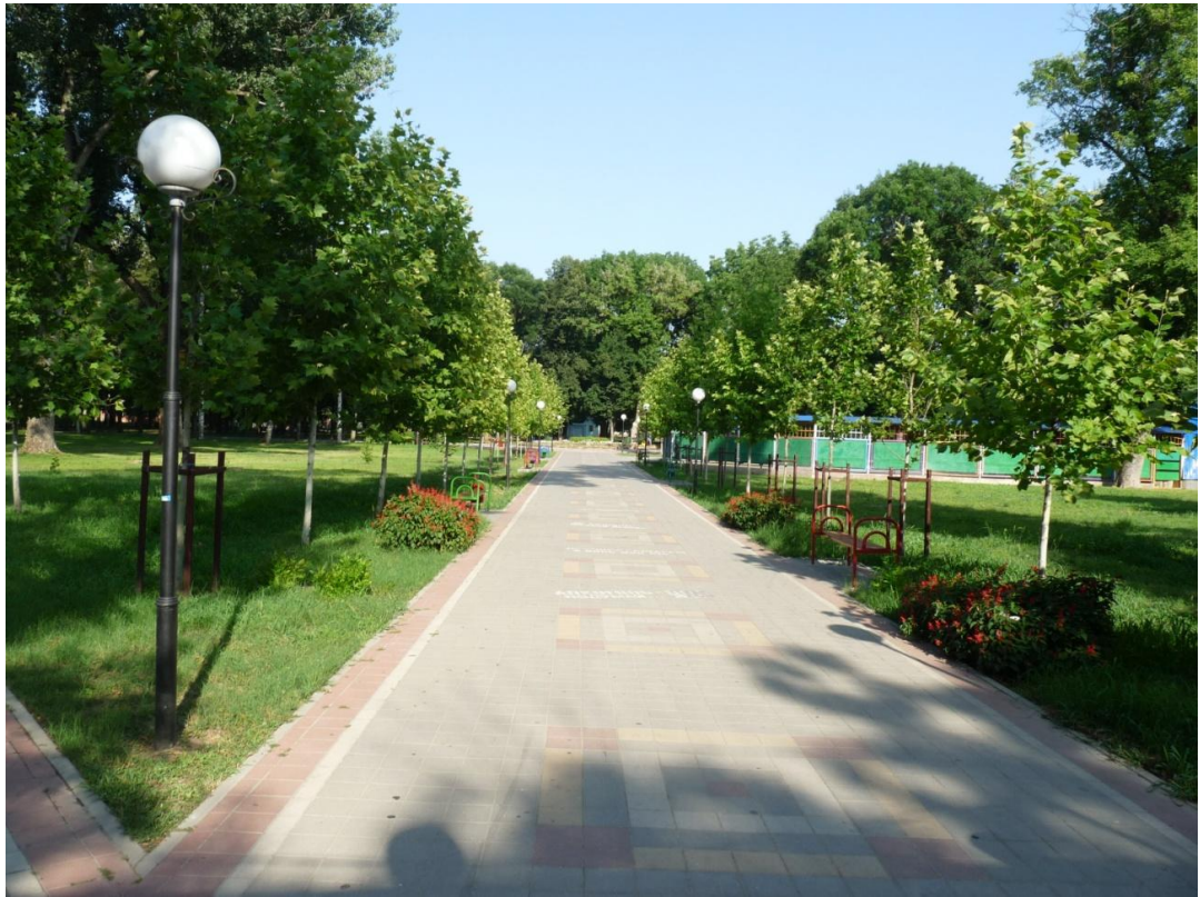
Рисунок 4 – Памятник природы «Парк имени Пушкина»