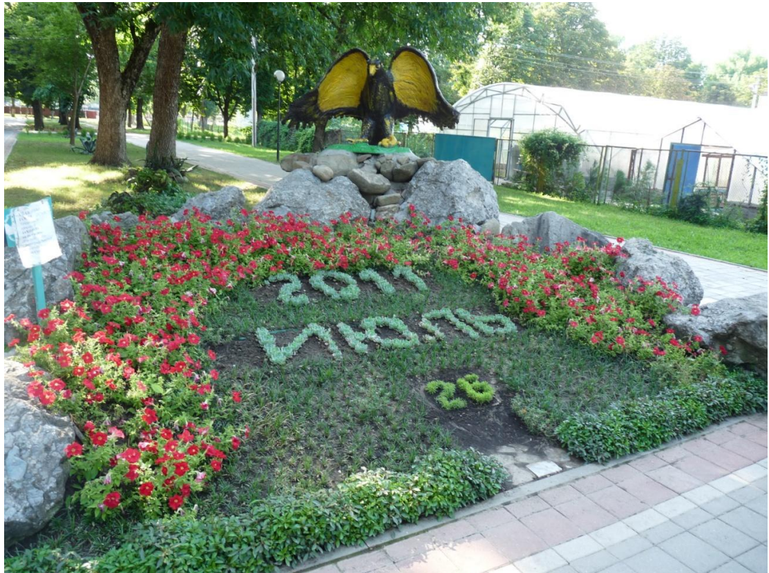
Рисунок 8 – Памятник природы «Парк имени Пушкина»