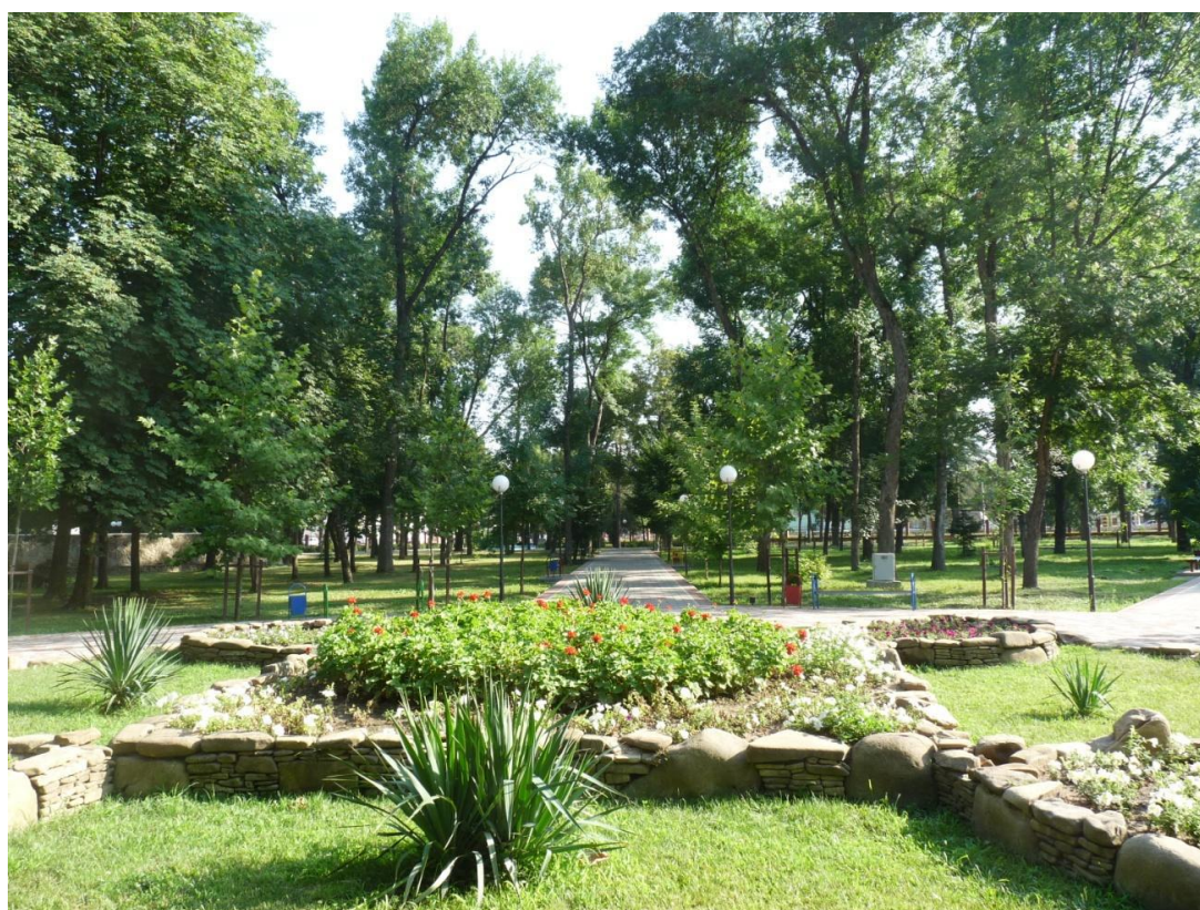
Рисунок 7 – Памятник природы «Парк имени Пушкина»