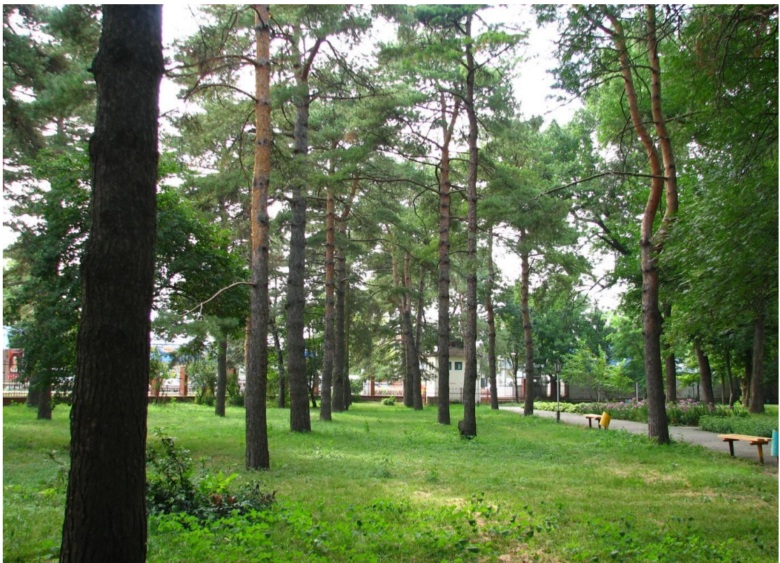
Рисунок 3 – Памятник природы «Парк имени Пушкина»