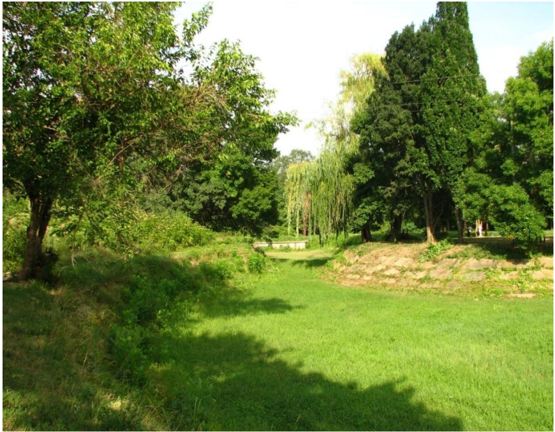
Рисунок 2 – Памятник природы «Парк имени Пушкина»