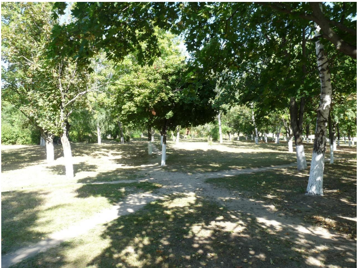
Рисунок 3- Памятник природы «Парк 30-летия Победы»