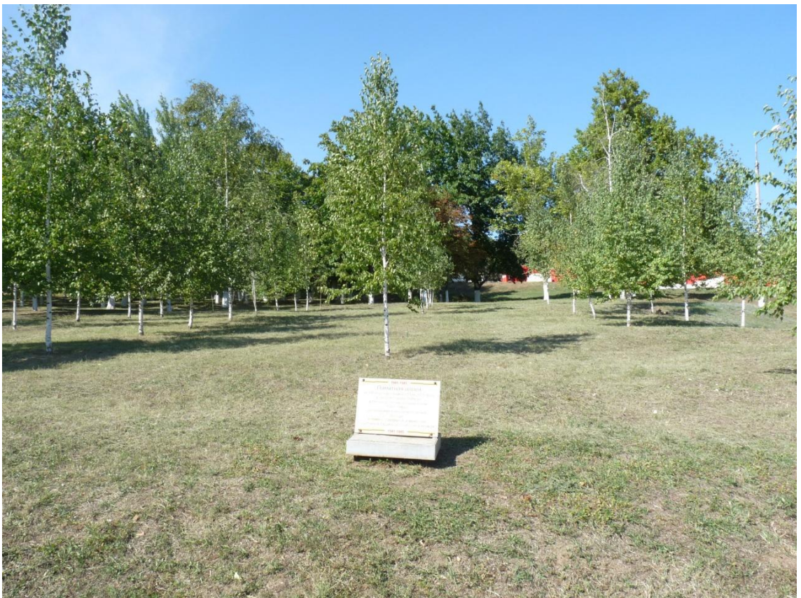
Рисунок 7- Памятник природы «Парк 30-летия Победы»