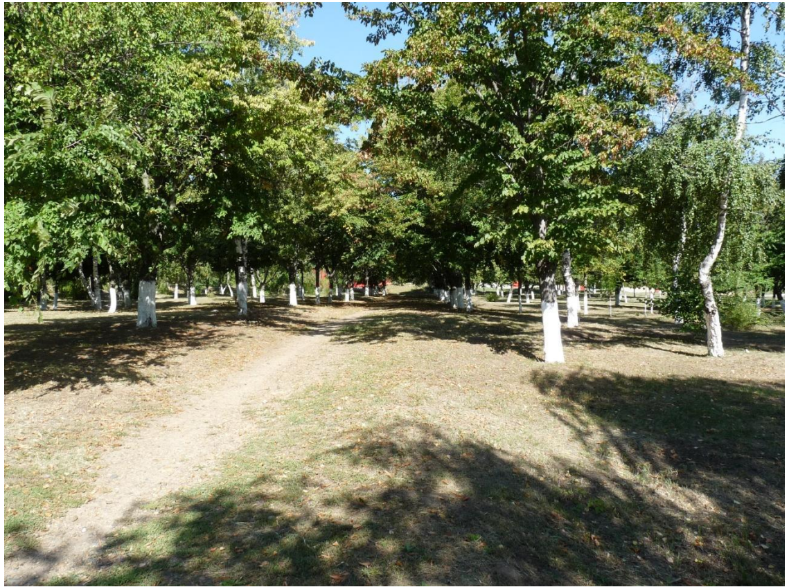
Рисунок 4- Памятник природы «Парк 30-летия Победы»