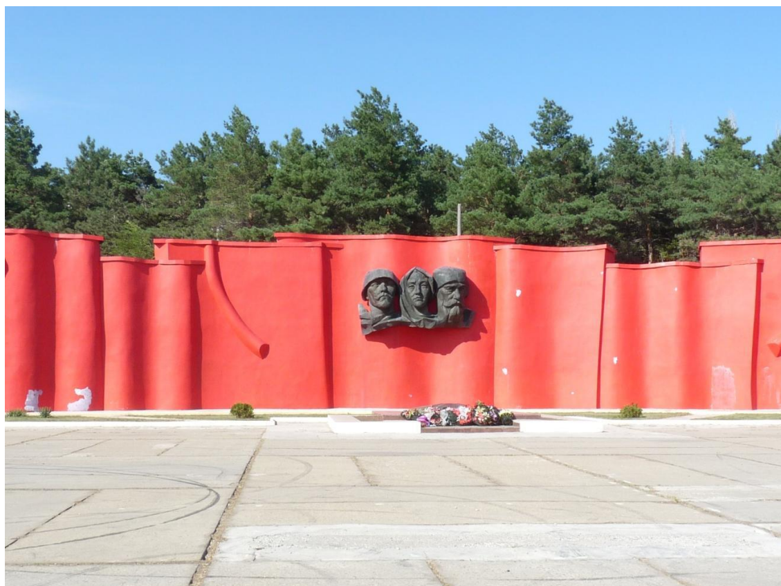
Рисунок 9- Памятник природы «Парк 30-летия Победы»