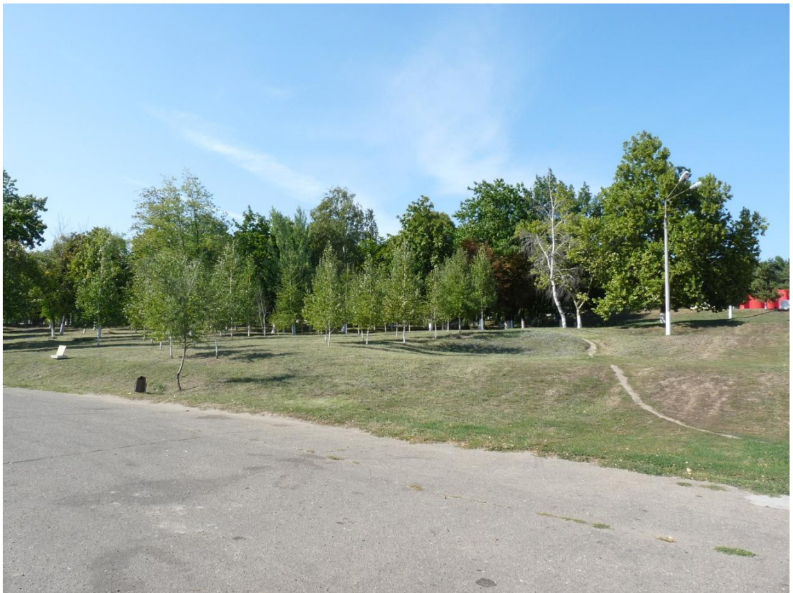
Рисунок 6- Памятник природы «Парк 30-летия Победы»