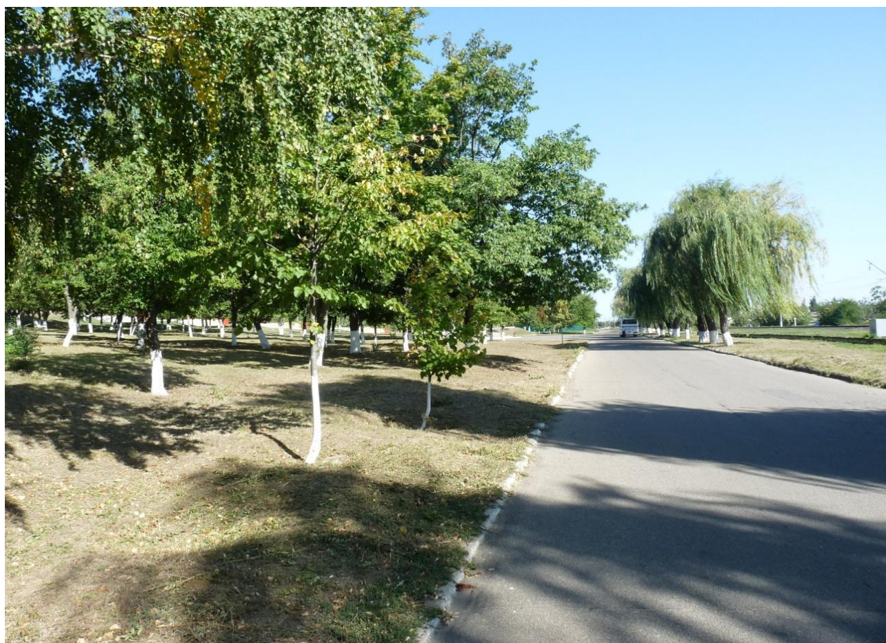
Рисунок 1 – Памятник природы «Парк 30-летия Победы»

Дополнительные материалы – фотографии памятника природы или наиболее характерных его частей, картографический материал (карты (схемы) расположения памятника природы и охранный зоны (1:100000, 1:50000), карты (схемы) памятника природы с обозначением границ (1:2000 или 1:500, в зависимости от занимаемой площади), Охранное обязательство, иные материалы.