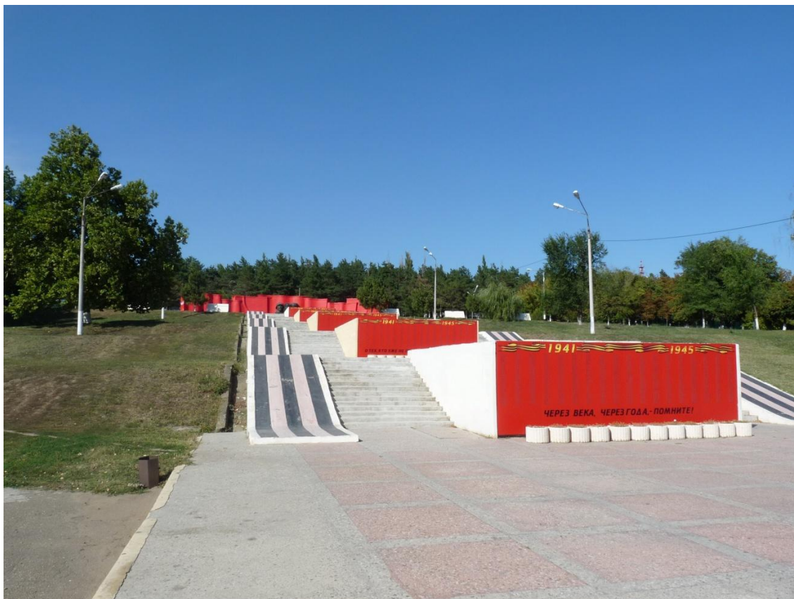
Рисунок 8- Памятник природы «Парк 30-летия Победы»