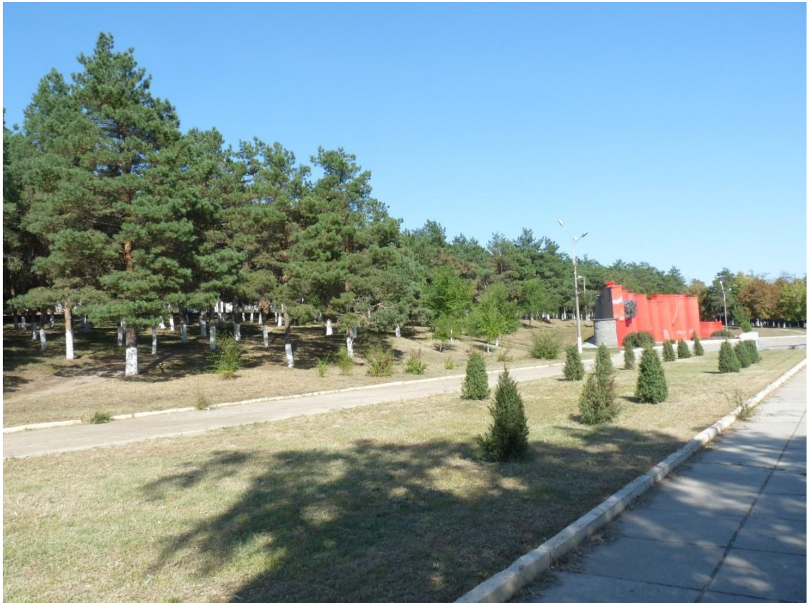
Рисунок 2- Памятник природы «Парк 30-летия Победы»