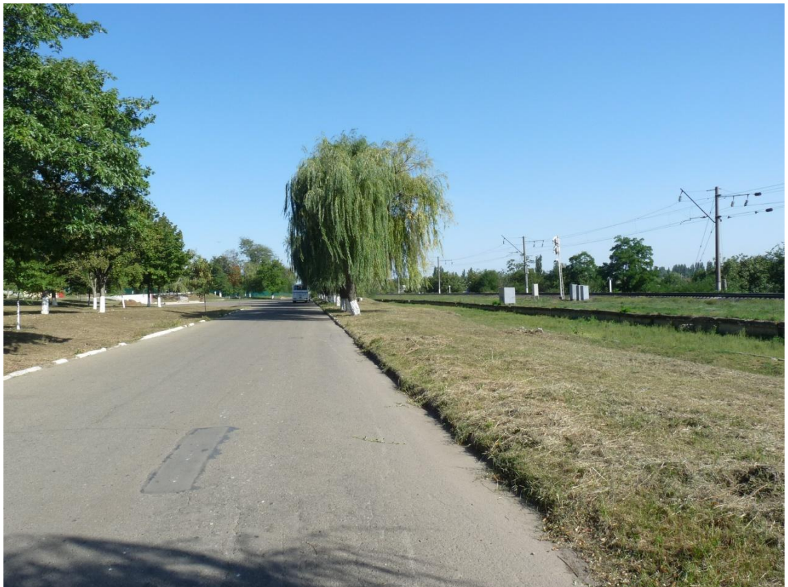
Рисунок 5- Памятник природы «Парк 30-летия Победы»