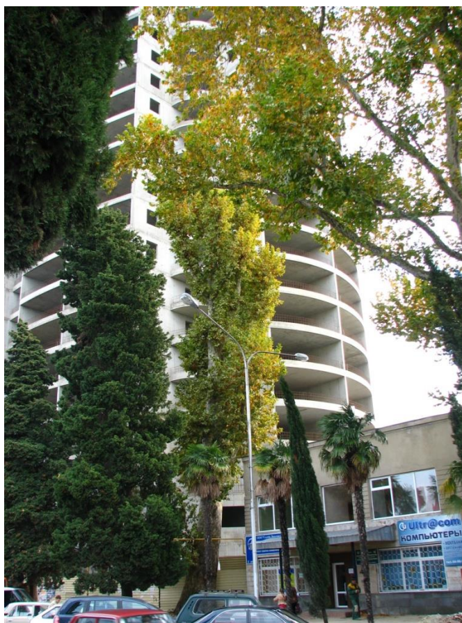
Рисунок 3 – Памятник природы «Платан восточный «Великан»