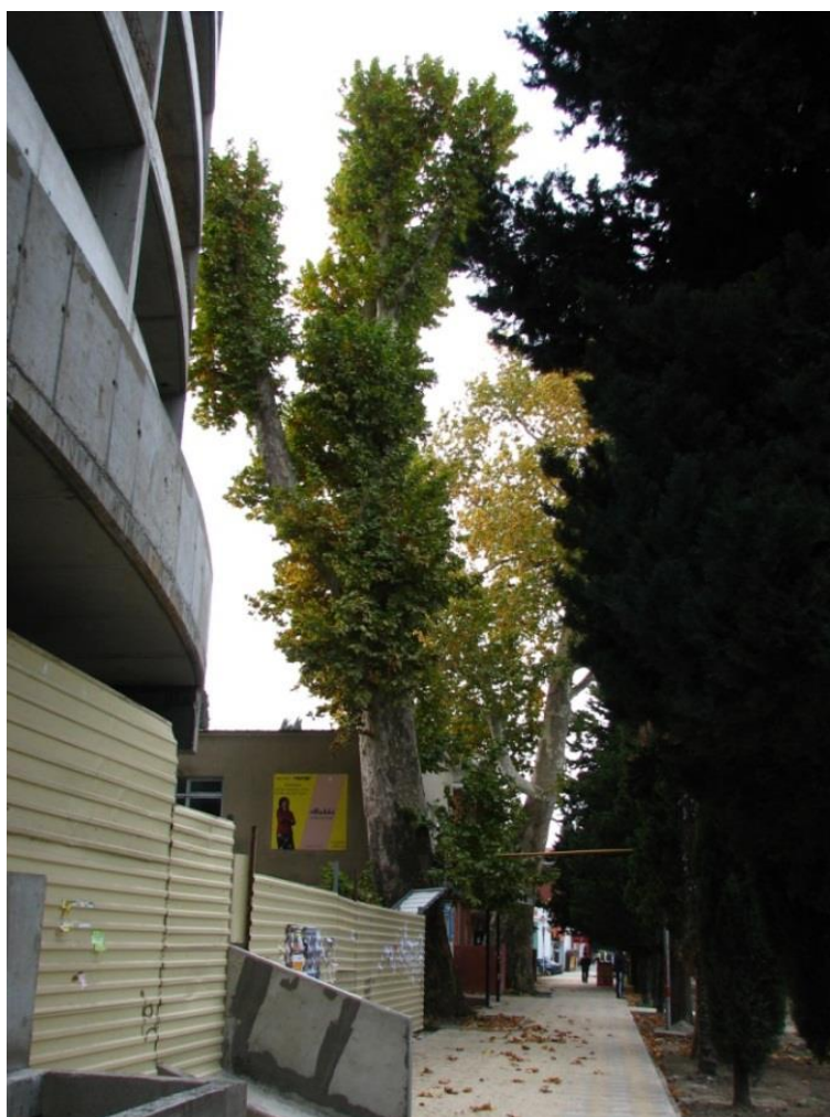
Рисунок 1 – Памятник природы «Платан восточный «Великан»

Дополнительные материалы – фотографии памятника природы или наиболее характерных его частей, картографический материал (карты (схемы) расположения памятника природы и охранной зоны (1:100000, 1:50000), карты (схемы) памятника природы с обозначением границ (1:2000 или 1:500, в зависимости от занимаемой площади), Охранное обязательство, иные материалы.