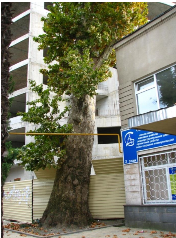
Рисунок 6 – Памятник природы «Платан восточный «Великан»