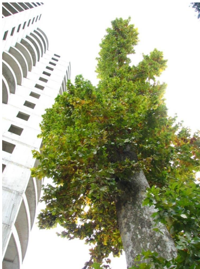
Рисунок 5 – Памятник природы «Платан восточный «Великан»