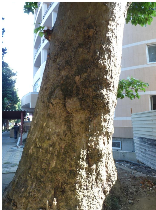
Рисунок 9 – Памятник природы «Платан восточный «Великан»