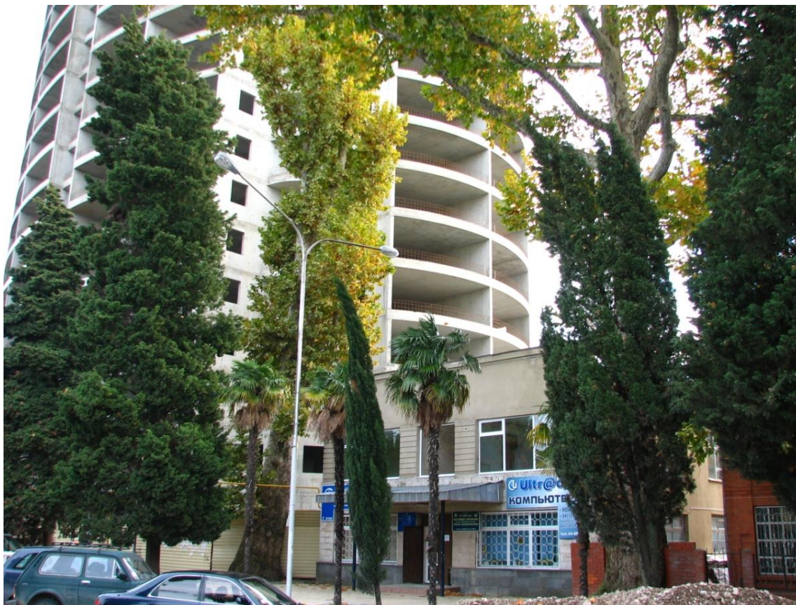
Рисунок 4 – Памятник природы «Платан восточный «Великан»