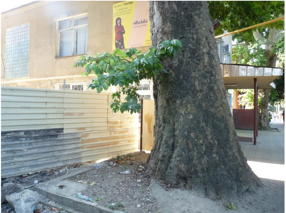
Рисунок 8 – Памятник природы «Платан восточный «Великан»