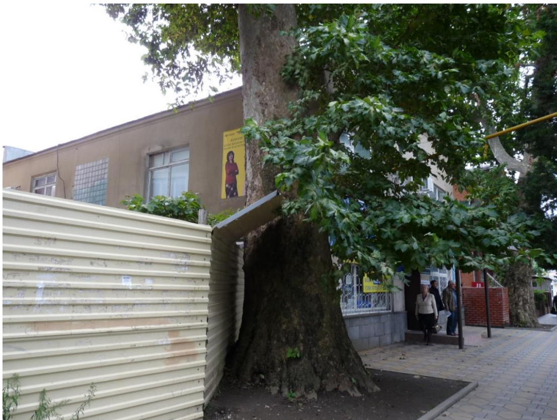
Рисунок 2 – Памятник природы «Платан восточный «Великан»