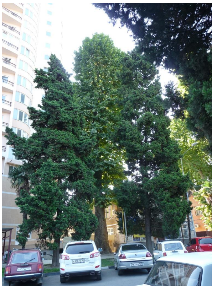
Рисунок 7 – Памятник природы «Платан восточный «Великан»