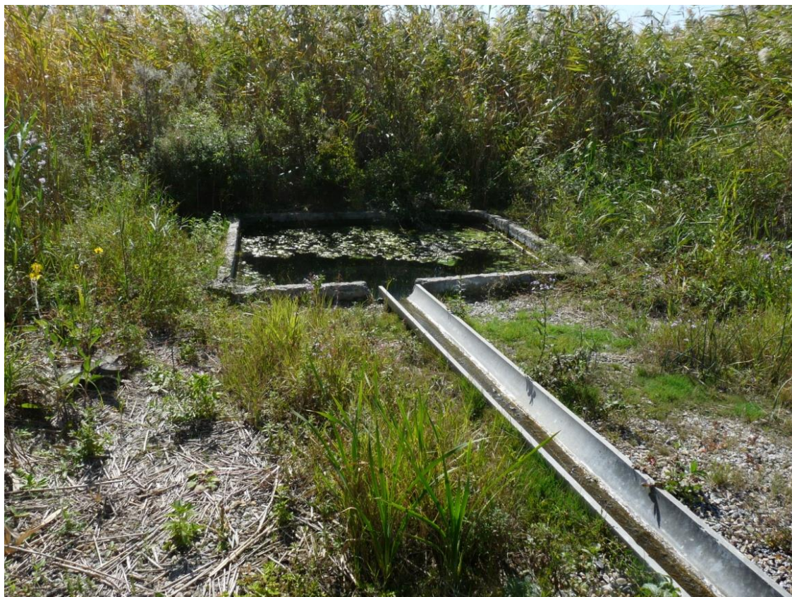
Рисунок 6 – Памятник природы «Родник колхоза «Россия»