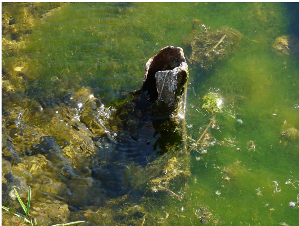
Рисунок 5 – Памятник природы «Родник колхоза «Россия»