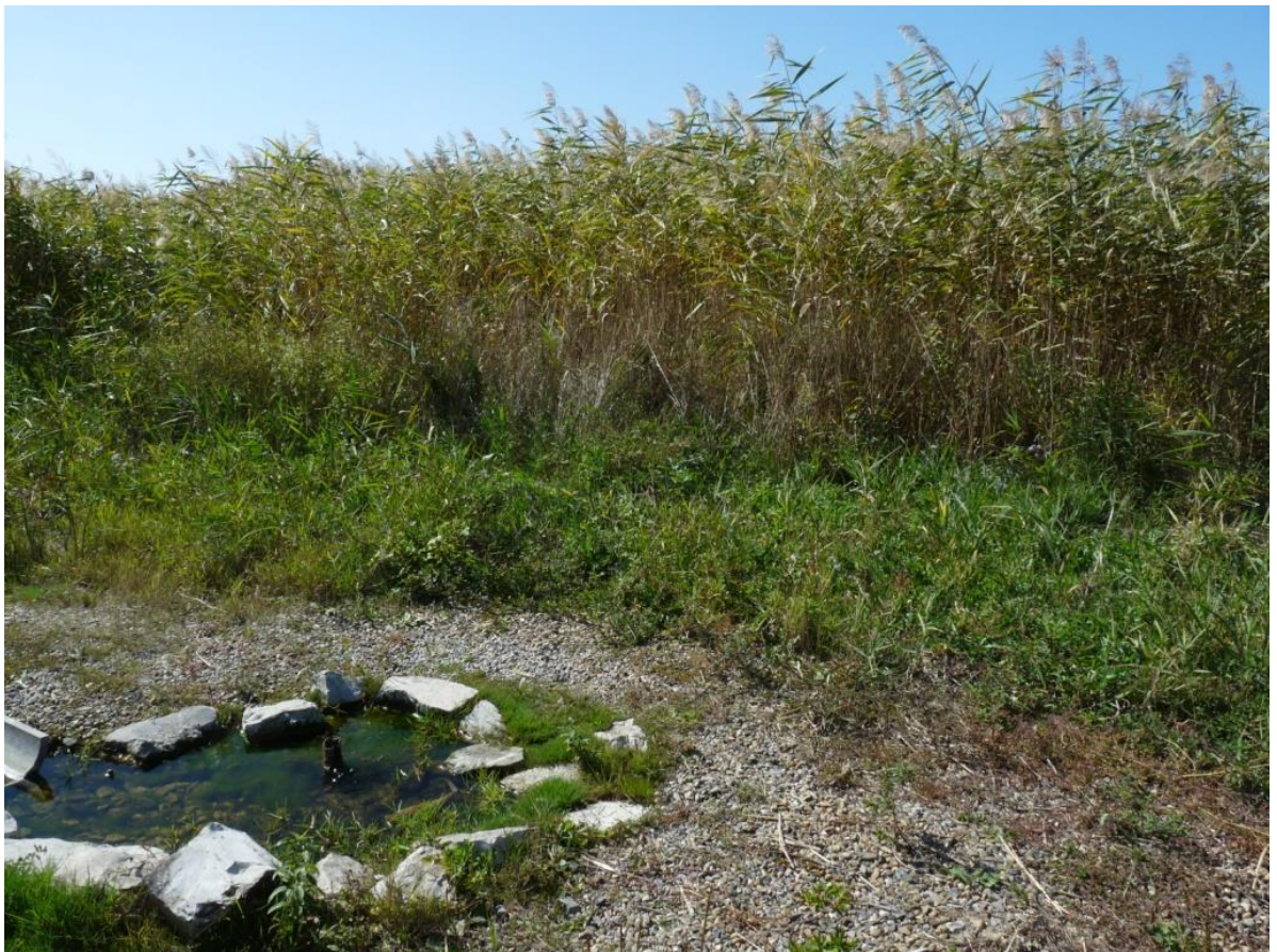
Рисунок 8 – Памятник природы «Родник колхоза «Россия»