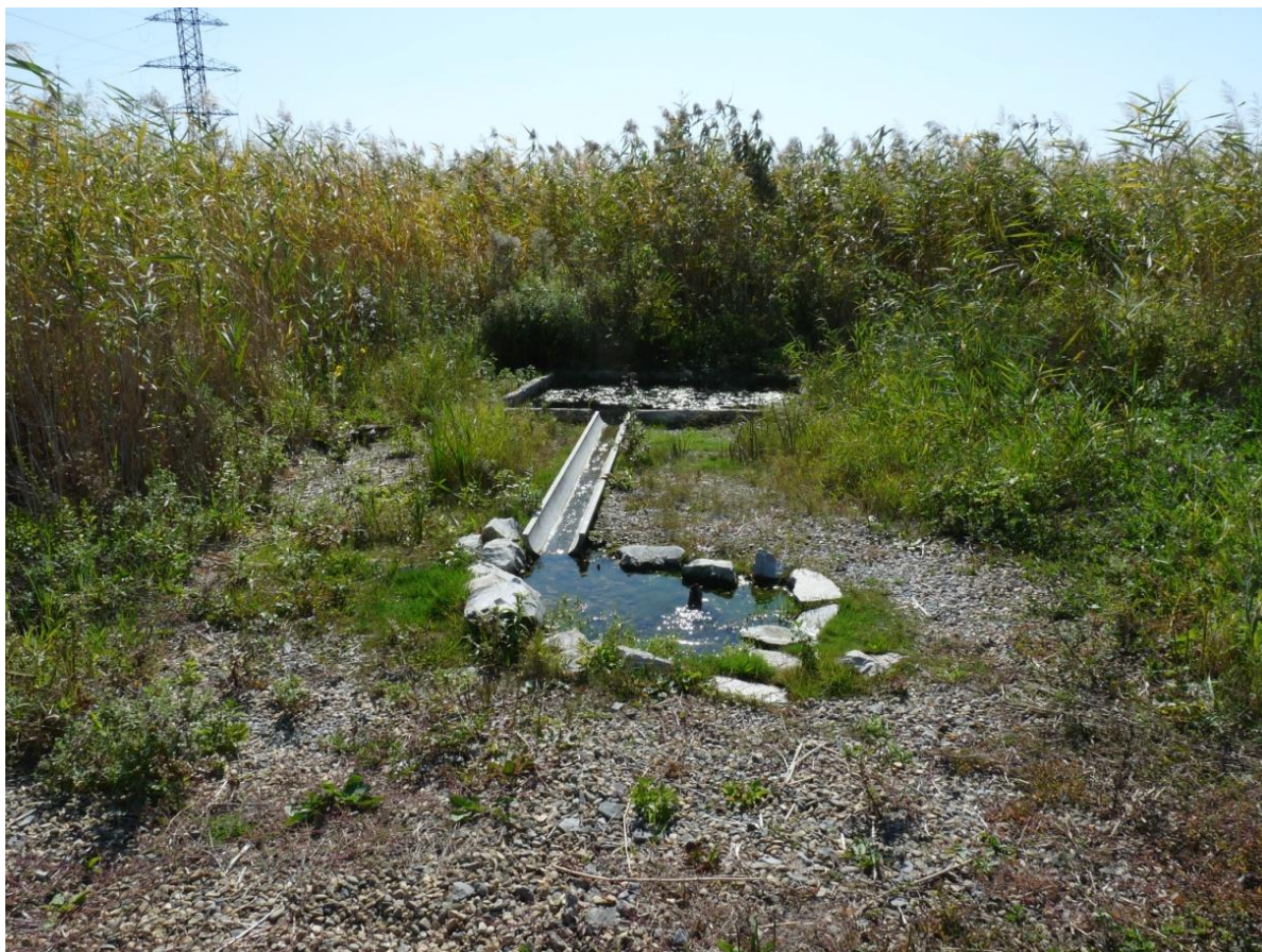
Рисунок 4 – Памятник природы «Родник колхоза «Россия»