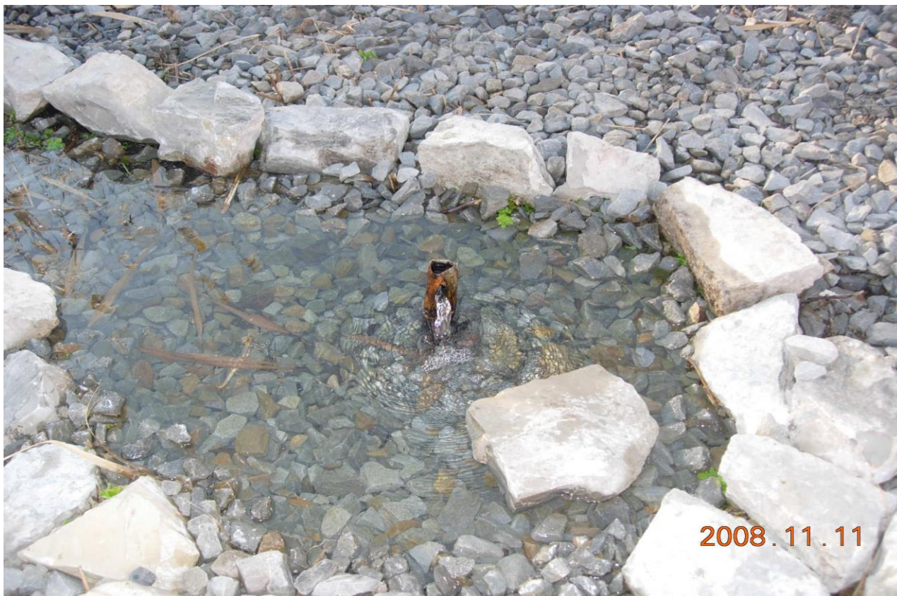
Рисунок 2 – Памятник природы «Родник колхоза «Россия»