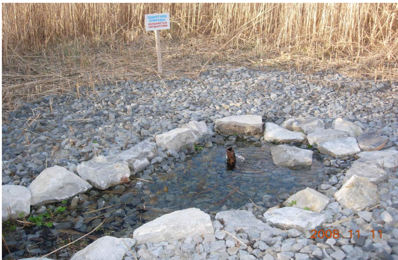
Рисунок 1 – Памятник природы «Родник колхоза «Россия»

Дополнительные материалы – фотографии памятника природы или наиболее характерных его частей, картографический материал (карты (схемы) расположения памятника природы и охранной зоны (1:100000, 1:50000), карты (схемы) памятника природы с обозначением границ (1:2000 или 1:500, в зависимости от занимаемой площади), Охранное обязательство, иные материалы.