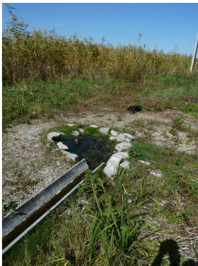
Рисунок 7 – Памятник природы «Родник колхоза «Россия»