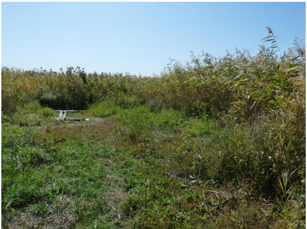
Рисунок 9 – Памятник природы «Родник колхоза Россия»