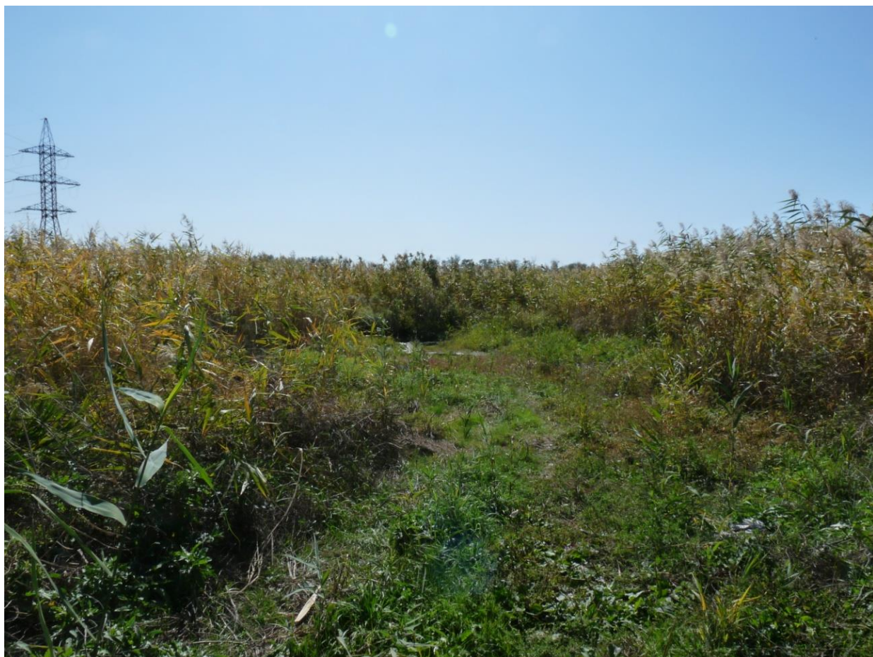
Рисунок 3 – Памятник природы «Родник колхоза «Россия»