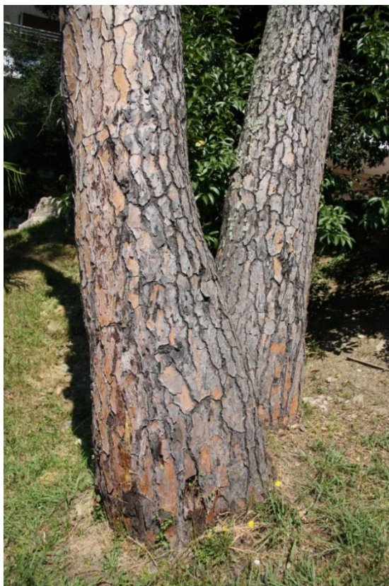
Рисунок 4 – Памятник природы «Сосна кедровая»