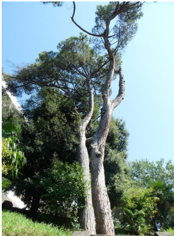
Рисунок 8 – Памятник природы «Сосна кедровая»