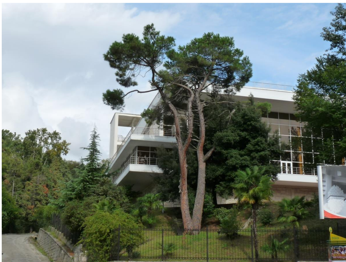
Рисунок 1 – Памятник природы «Сосна кедровая»

Дополнительные материалы – фотографии памятника природы или наиболее характерных его частей, картографический материал (карты (схемы) расположения памятника природы и охранной зоны (1:100000, 1:50000), карты (схемы) памятника природы с обозначением границ (1:2000 или 1:500, в зависимости от занимаемой площади), Охранное обязательство, иные материалы.