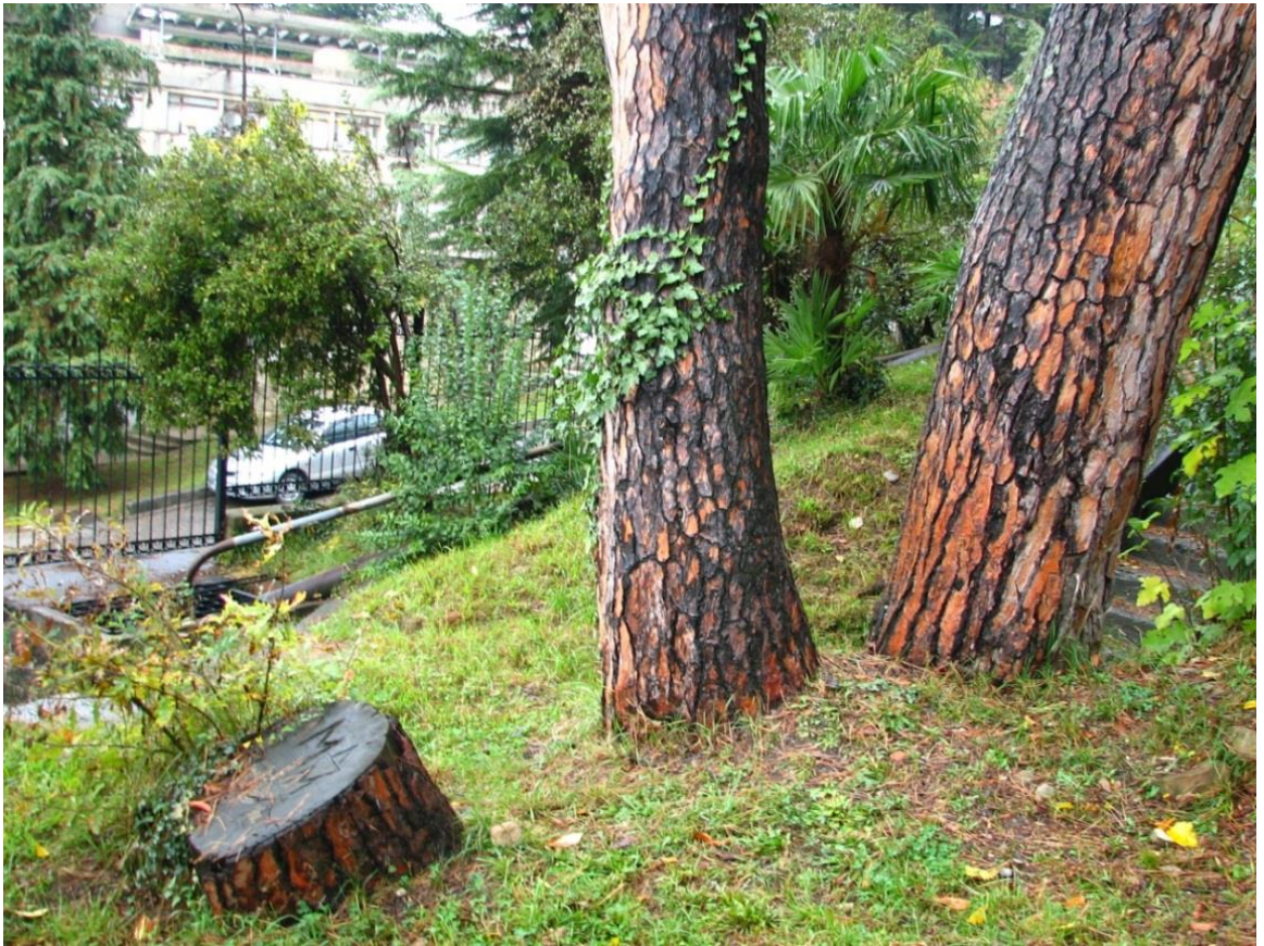
Рисунок 2 – Памятник природы «Сосна кедровая»