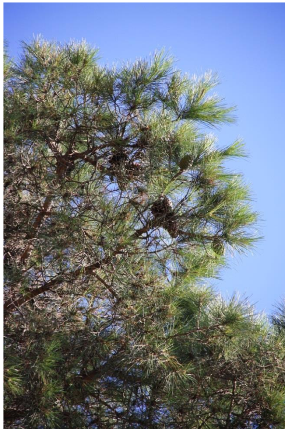
Рисунок 3 – Памятник природы «Сосна кедровая»