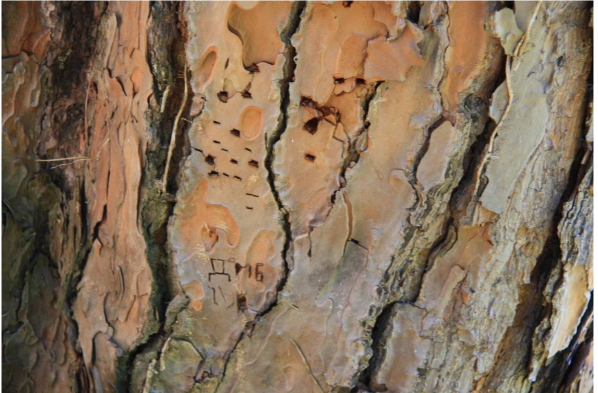
Рисунок 6 – Памятник природы «Сосна кедровая»