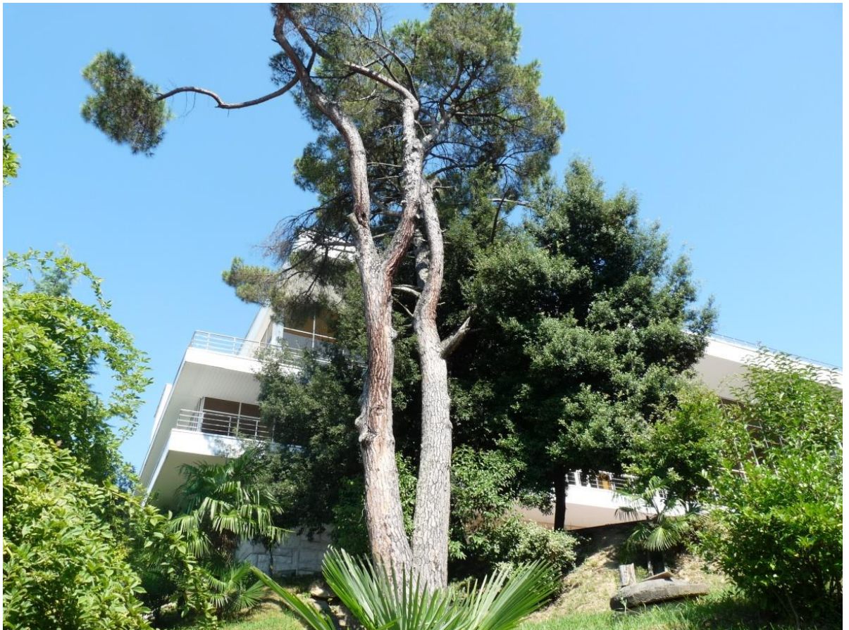
Рисунок 7 – Памятник природы «Сосна кедровая»