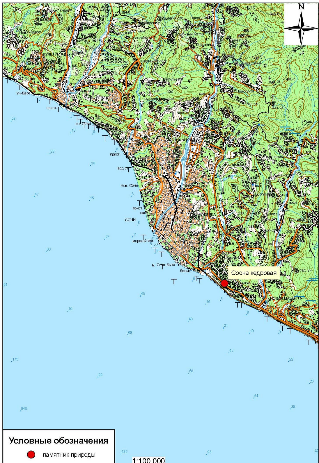
Схема расположения памятника природы «Сосна кедровая»