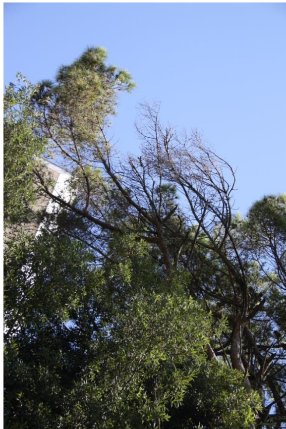
Рисунок 9 – Памятник природы «Сосна кедровая»