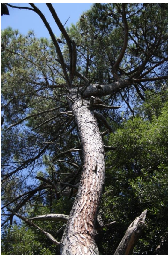
Рисунок 5 – Памятник природы «Сосна кедровая»