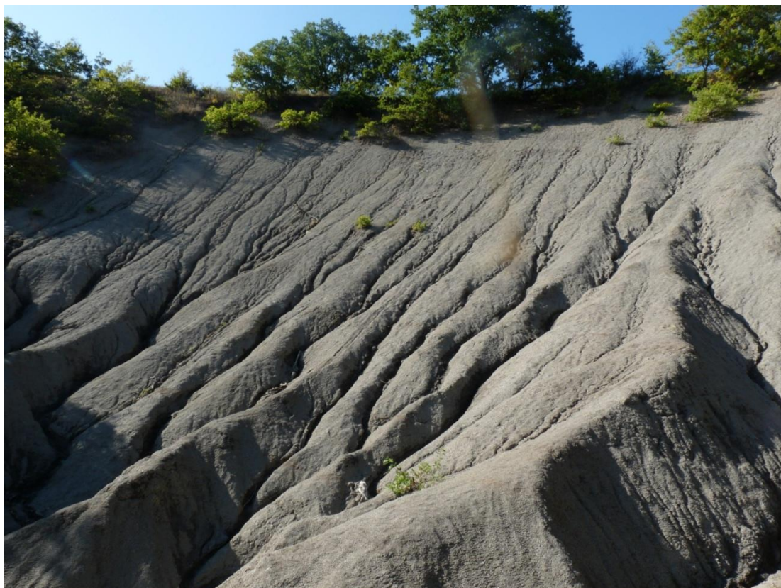
Рисунок 8 – Памятник природы «Урочище Кислое»