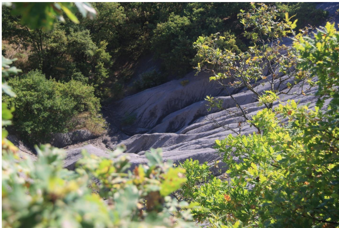
Рисунок 3 – Памятник природы «Урочище Кислое»