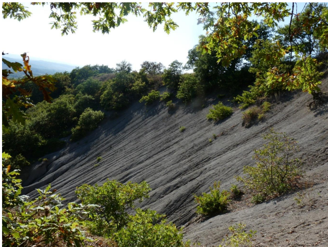
Рисунок 9 – Памятник природы «Урочище Кислое»