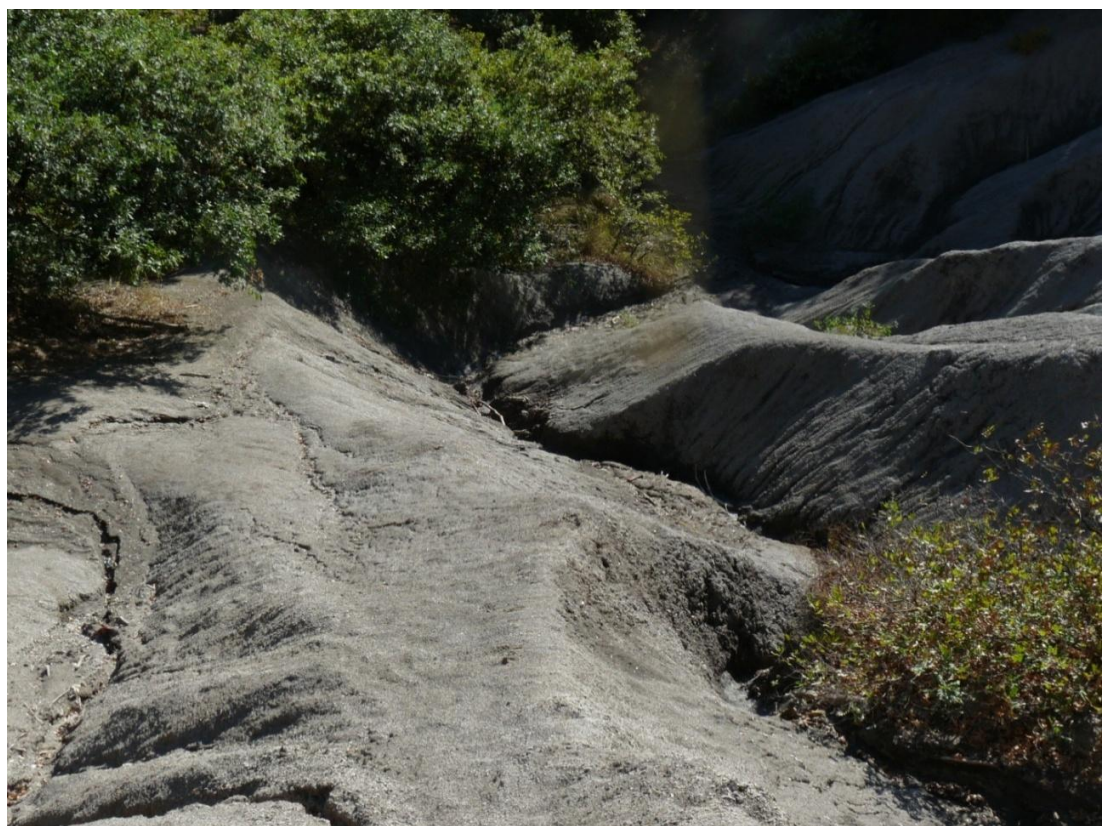
Рисунок 7 – Памятник природы «Урочище Кислое»