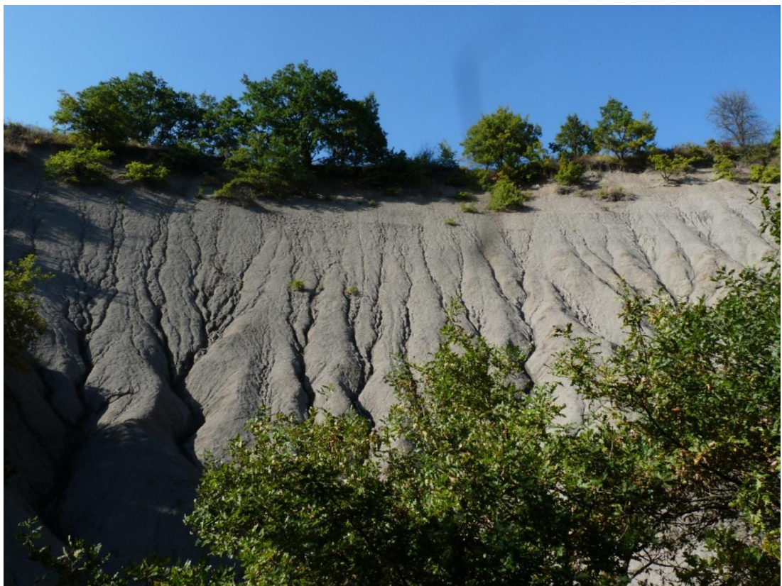
Рисунок 5– Памятник природы «Урочище Кислое»