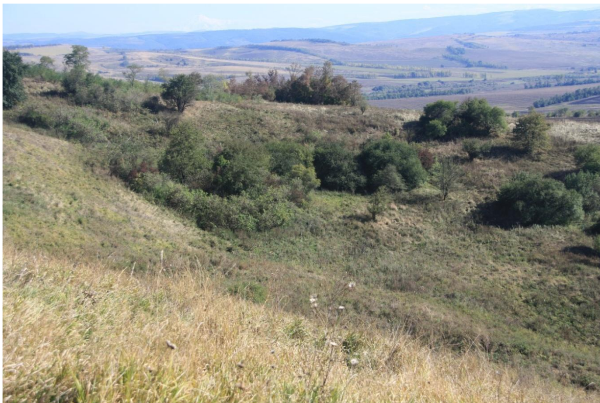
Рисунок 2 – Памятник природы «Урочище Кислое»