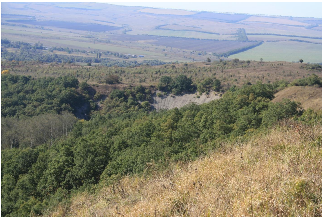
Рисунок 1 – Памятник природы «Урочище Кислое»

Дополнительные материалы – фотографии памятника природы или наиболее характерных его частей, картографический материал (карты (схемы) расположения памятника природы и охранный зоны (1:100000, 1:50000), карты (схемы) памятника природы с обозначением границ (1:2000 или 1:500, в зависимости от занимаемой площади), Охранное обязательство, иные материалы.