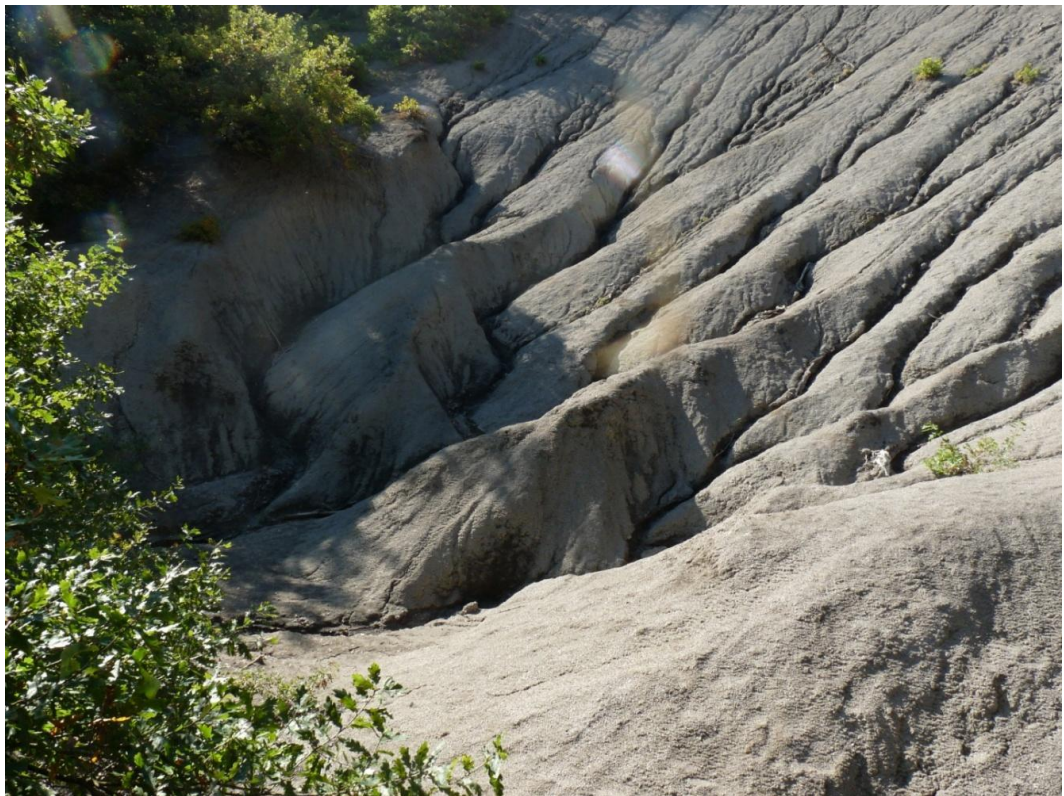
Рисунок 6 – Памятник природы «Урочище Кислое»