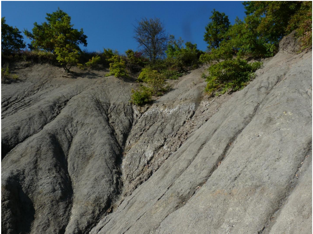
Рисунок 4– Памятник природы «Урочище Кислое»