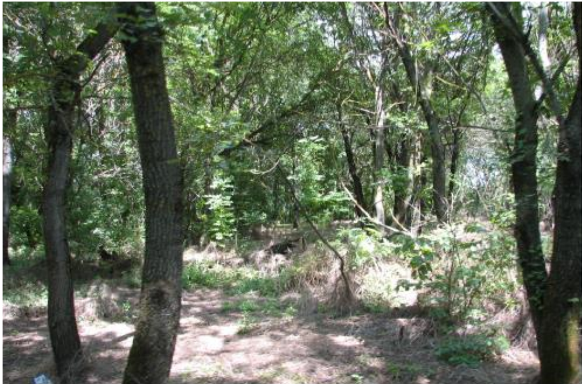
Рисунок 2 - Памятник природы «Роща Темная»