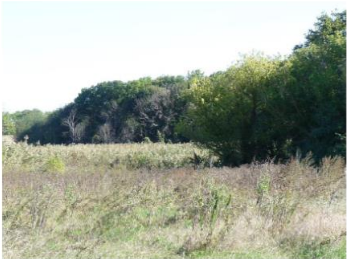
Рисунок 6 - Памятник природы «Роща Темная»