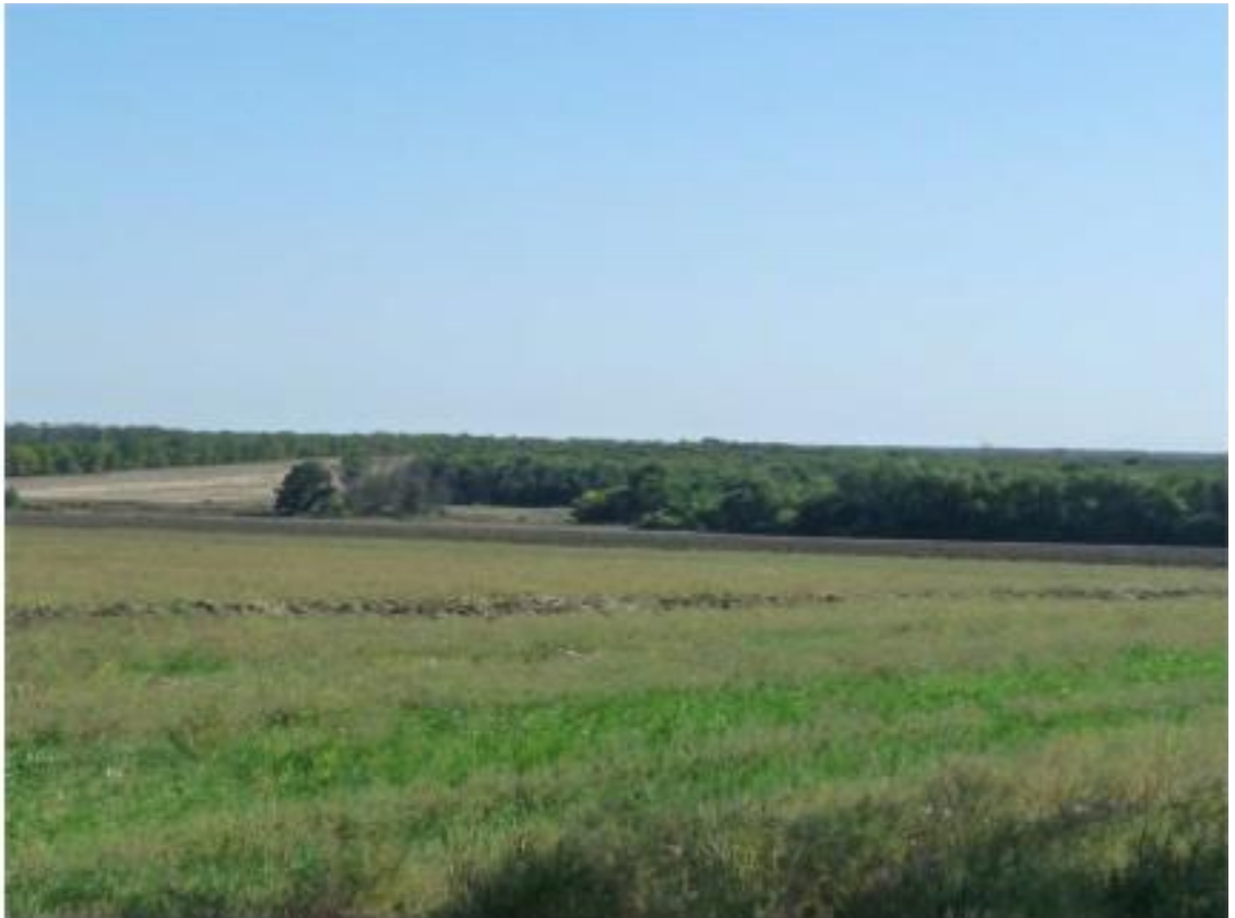
Рисунок 4 - Памятник природы «Роца Темная»