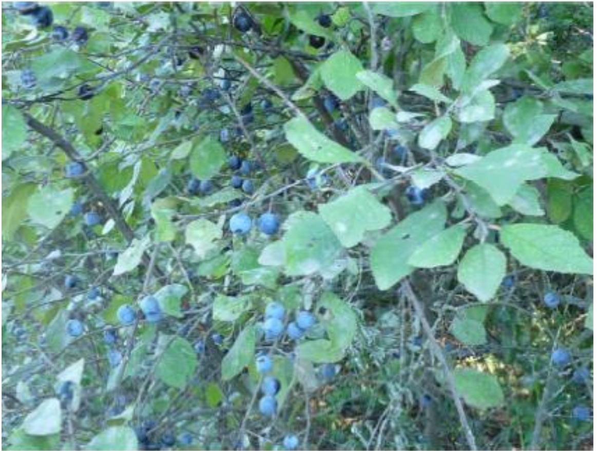
Рисунок 8 - Памятник природы «Роща Темная»