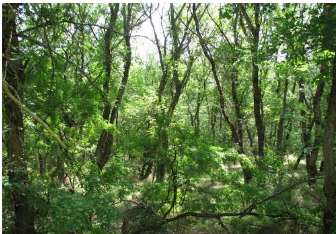
Рисунок 1 - Памятник природы «Роща Темная»

Дополнительные материалы – фотографии памятника природы или наиболее характерных его частей, картографический материал (карты (схемы) расположения памятника природы и охранной зоны (1:100000, 1:50000), карты (схемы) памятника природы с обозначением границ (1:2000 или 1:500, в зависимости от занимаемой площади), Охранное обязательство, иные материалы.