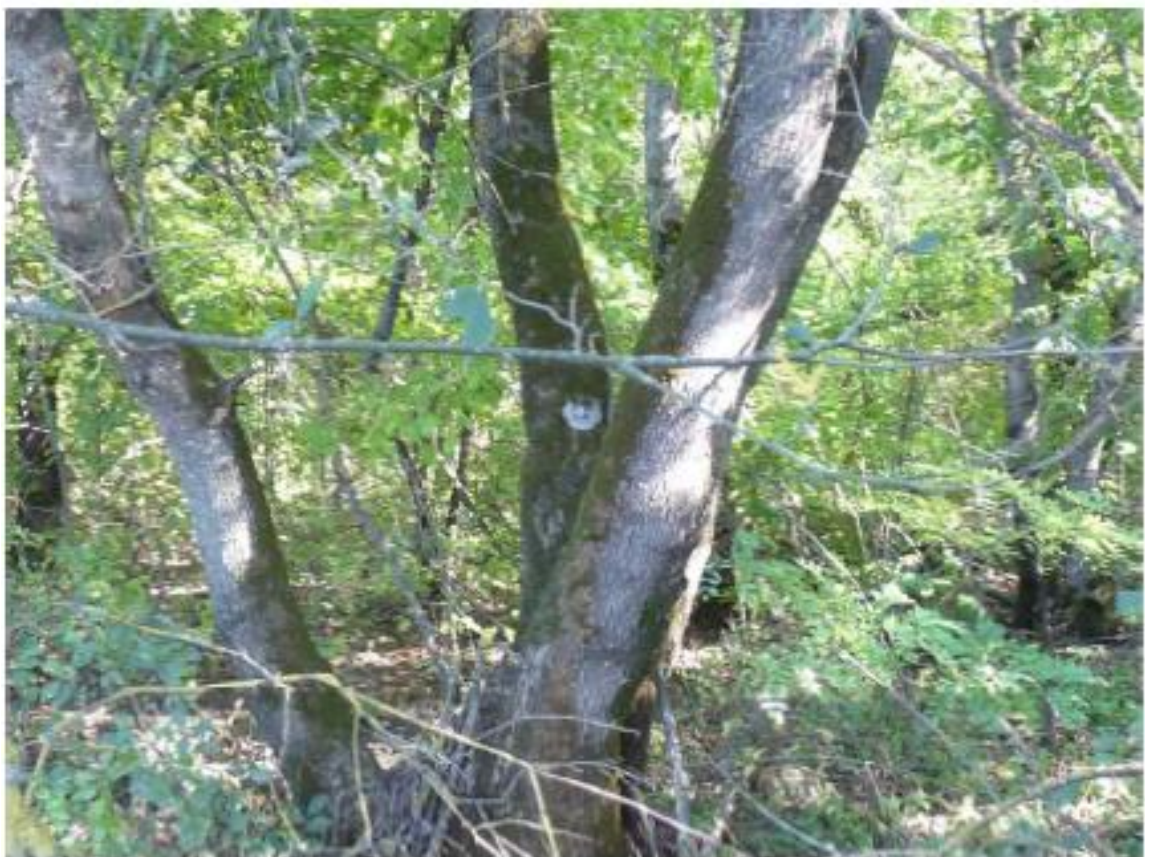
Рисунок 7 - Памятник природы «Роща Темная»