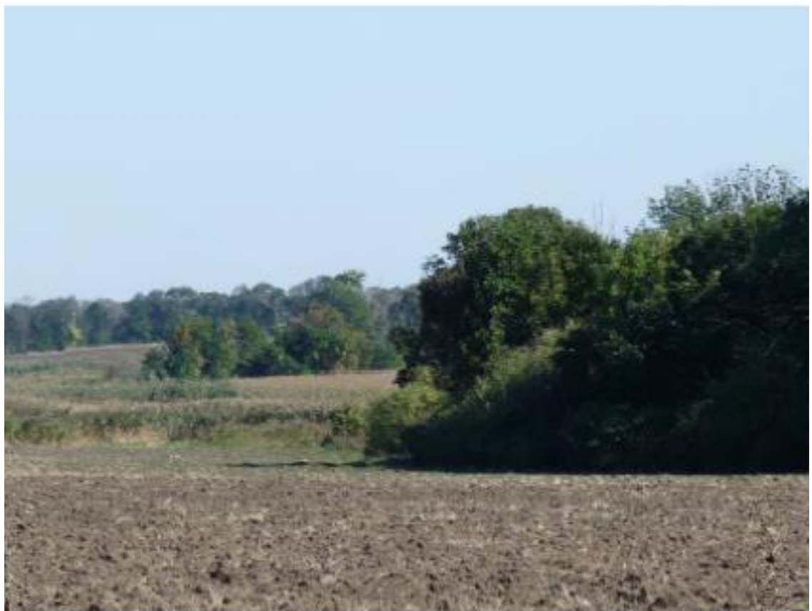
Рисунок 9 - Памятник природы «Роща Темная»