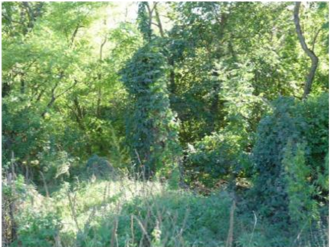
Рисунок 5 - Памятник природы «Роца Темная»