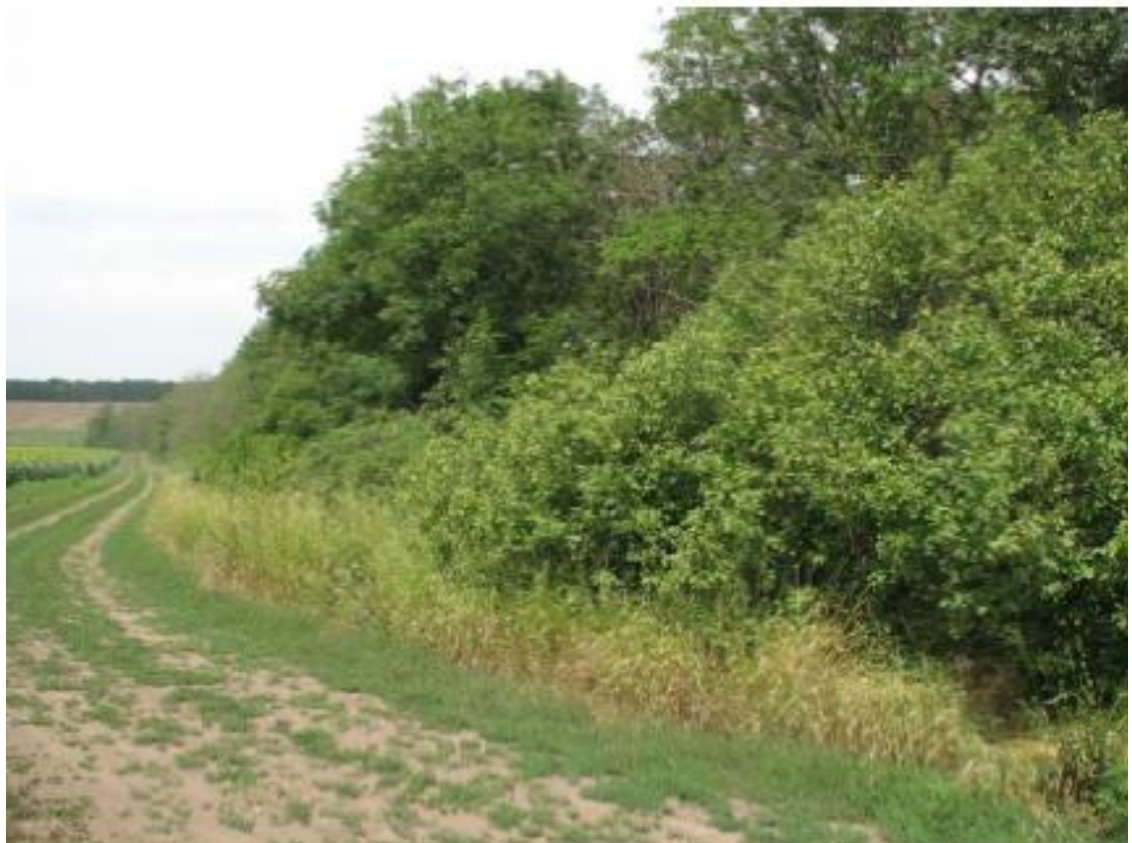
Рисунок 3 - Памятник природы «Роща Темная»