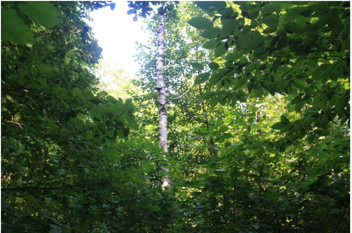
Рисунок 6 - Памятник природы «Берёзовая роща»