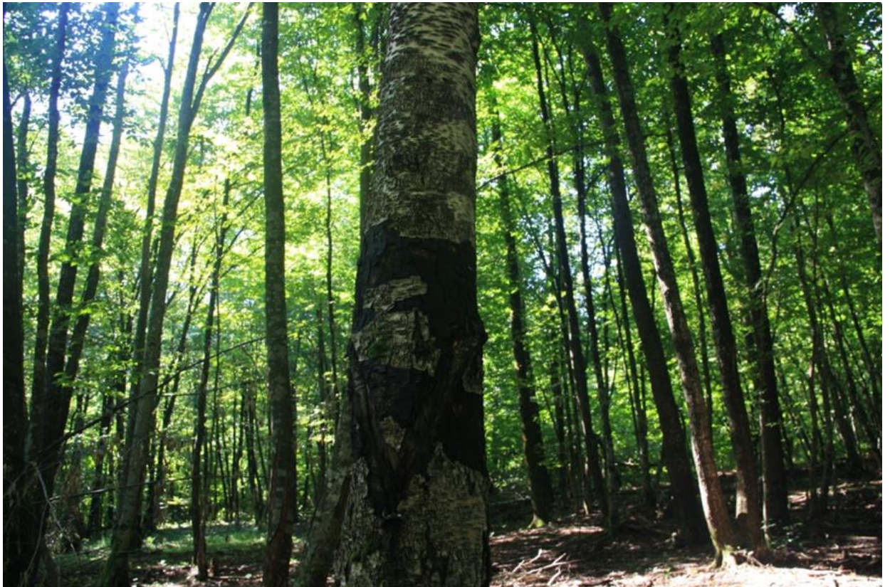
Рисунок 4 - Памятник природы «Берёзовая роща»