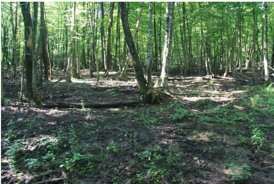
Рисунок 1 - Памятник природы «Берёзовая роща»

Дополнительные материалы – фотографии памятника природы или наиболее характерных его частей, картографический материал (карты (схемы) расположения памятника природы и охранной зоны (1:100000, 1:50000), карты (схемы) памятника природы с обозначением границ (1:2000 или 1:500, в зависимости от занимаемой площади), Охранное обязательство, иные материалы.