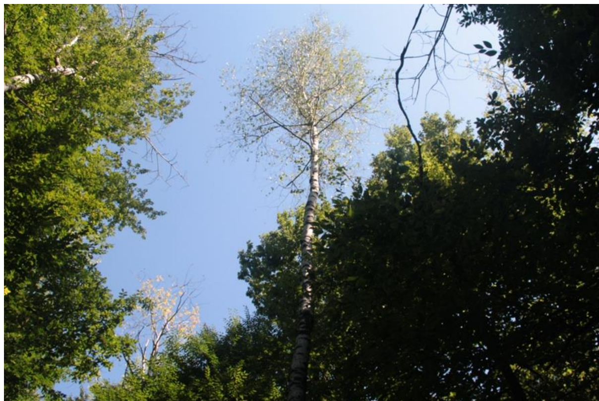
Рисунок 3 - Памятник природы «Берёзовая роща»