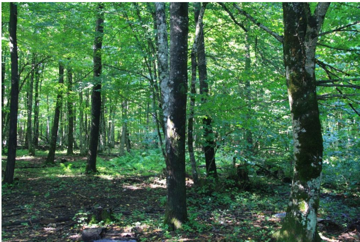
Рисунок 2 - Памятник природы «Берёзовая роща»