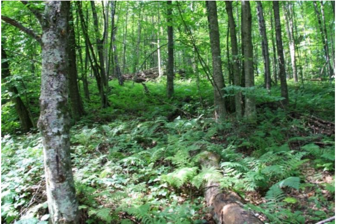
Рисунок 4 – памятник природы «Буковое насаждение»