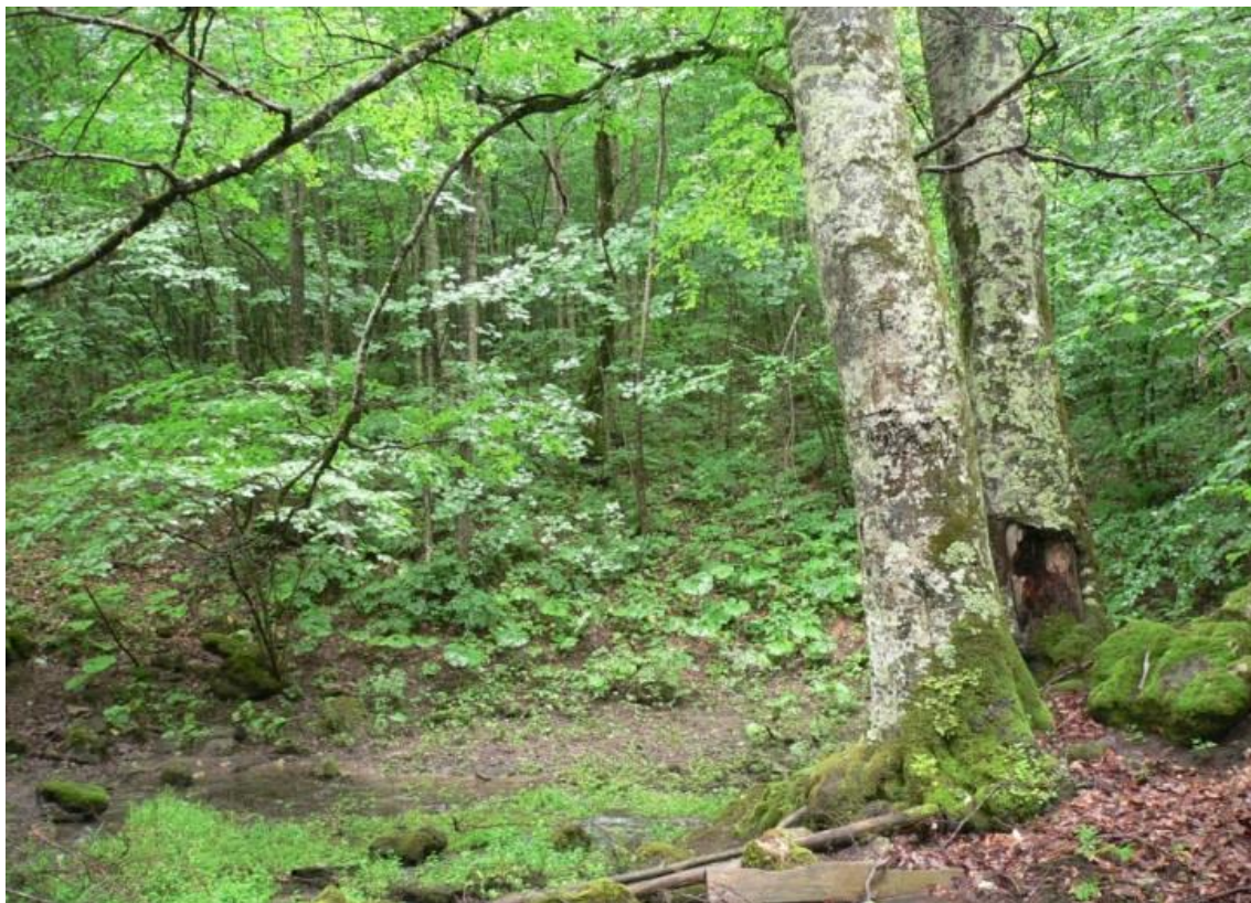
Рисунок 2 – памятник природы «Буковое насаждение»