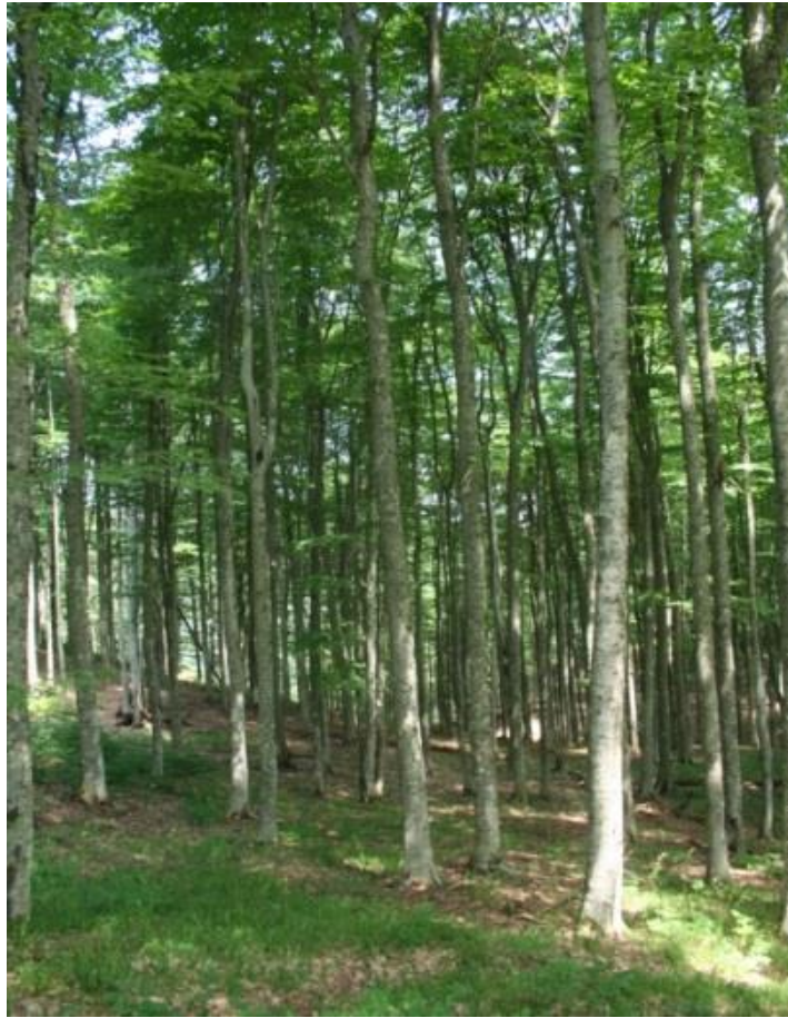
Рисунок 8 – памятник природы «Буковое насаждение»