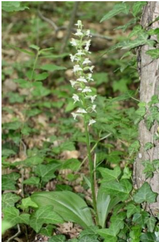
Рисунок 9 – памятник природы «Буковое насаждение»