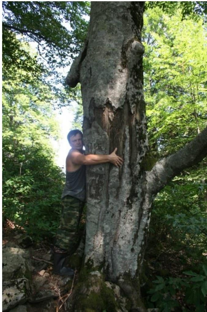
Рисунок 6 – памятник природы «Буковое насаждение»