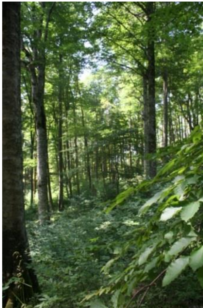
Рисунок 5 – памятник природы «Буковое насаждение»