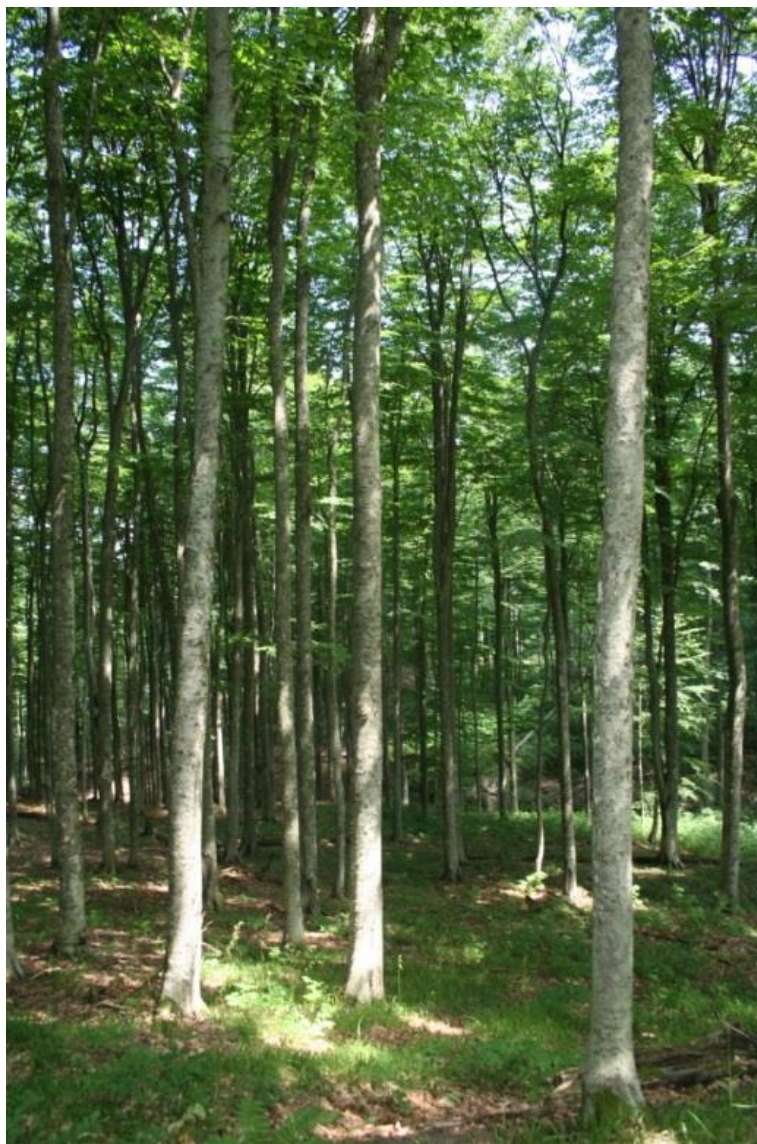
Рисунок 1 – памятник природы «Буковое насаждение»

Дополнительные материалы – фотографии памятника природы или наиболее характерных его частей, картографический материал (карты (схемы) расположения памятника природы и охранный зоны (1:100000, 1:50000), карты (схемы) памятника природы с обозначением границ (1:2000 или 1:500, в зависимости от занимаемой площади), Охранное обязательство, иные материалы.