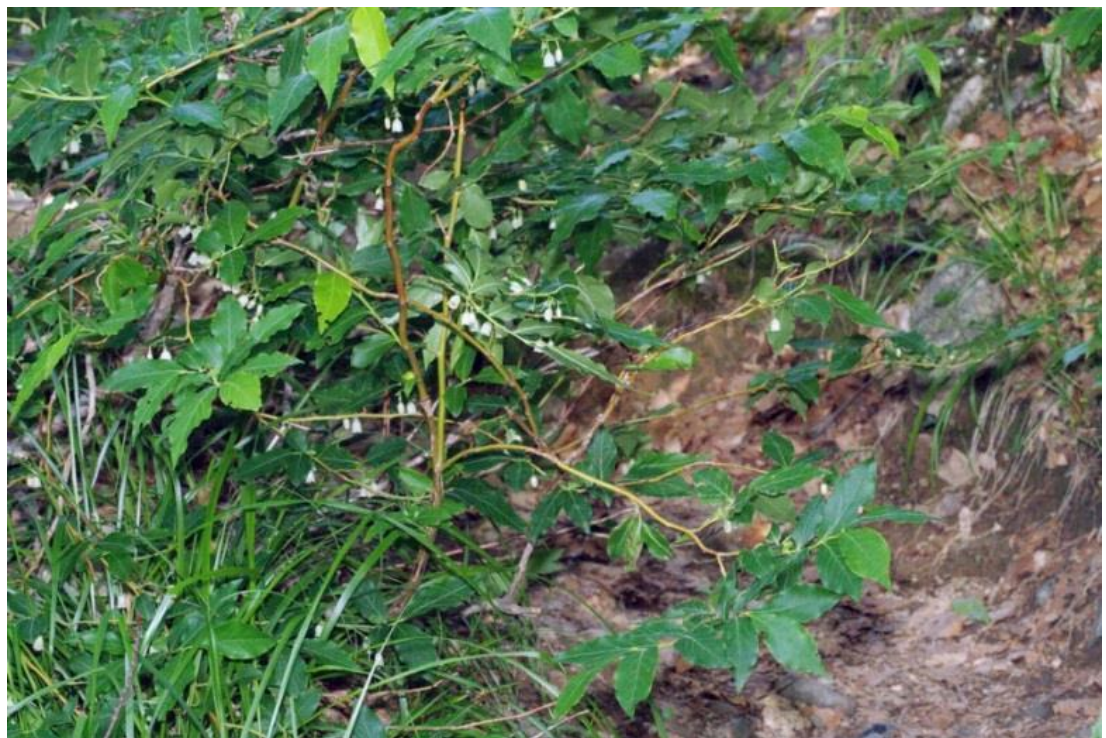
Рисунок 7 – памятник природы «Буковое насаждение»