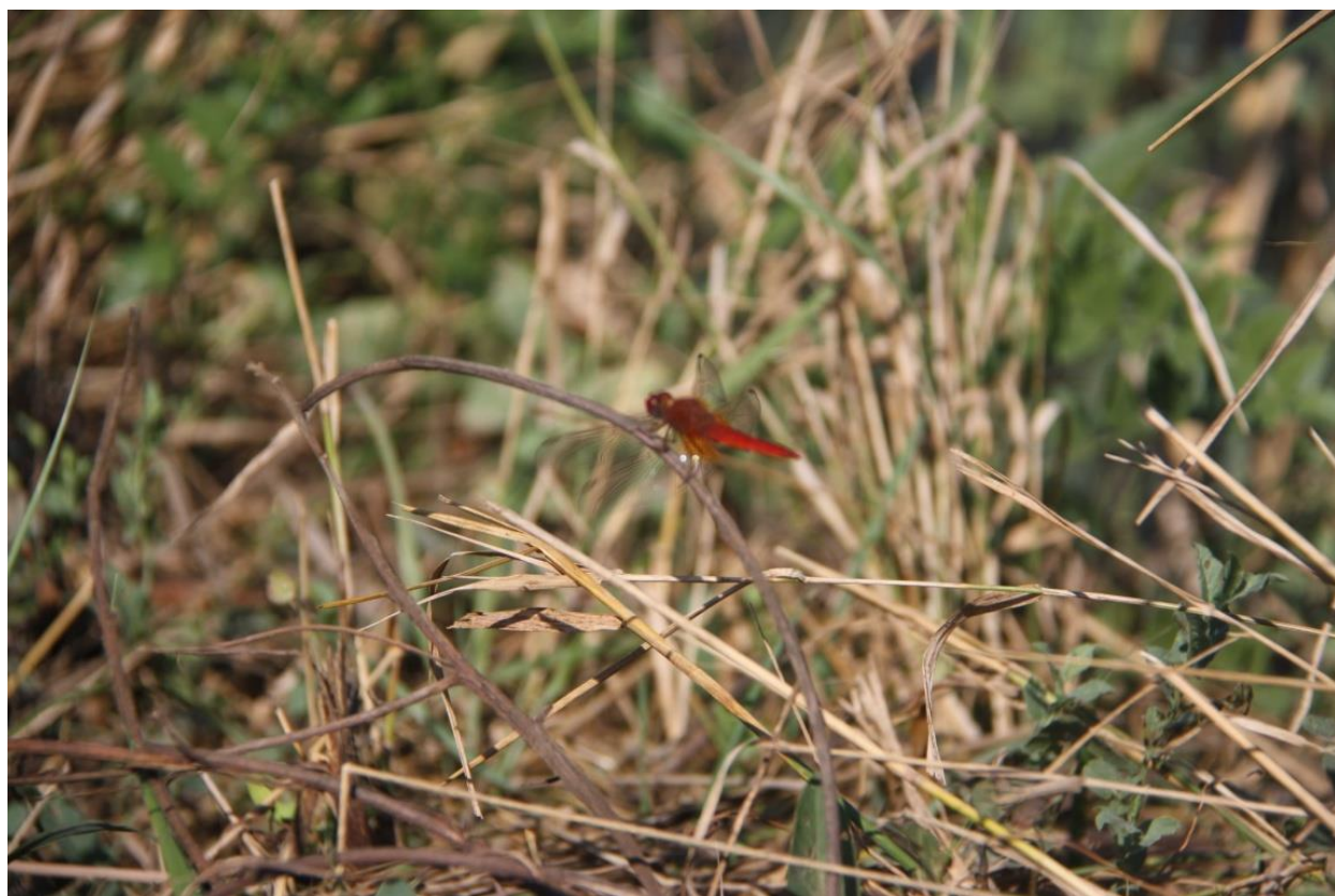
Рисунок 7 – Памятник природы «Грязелечебный участок (Стеблиевская соленая подкова)»