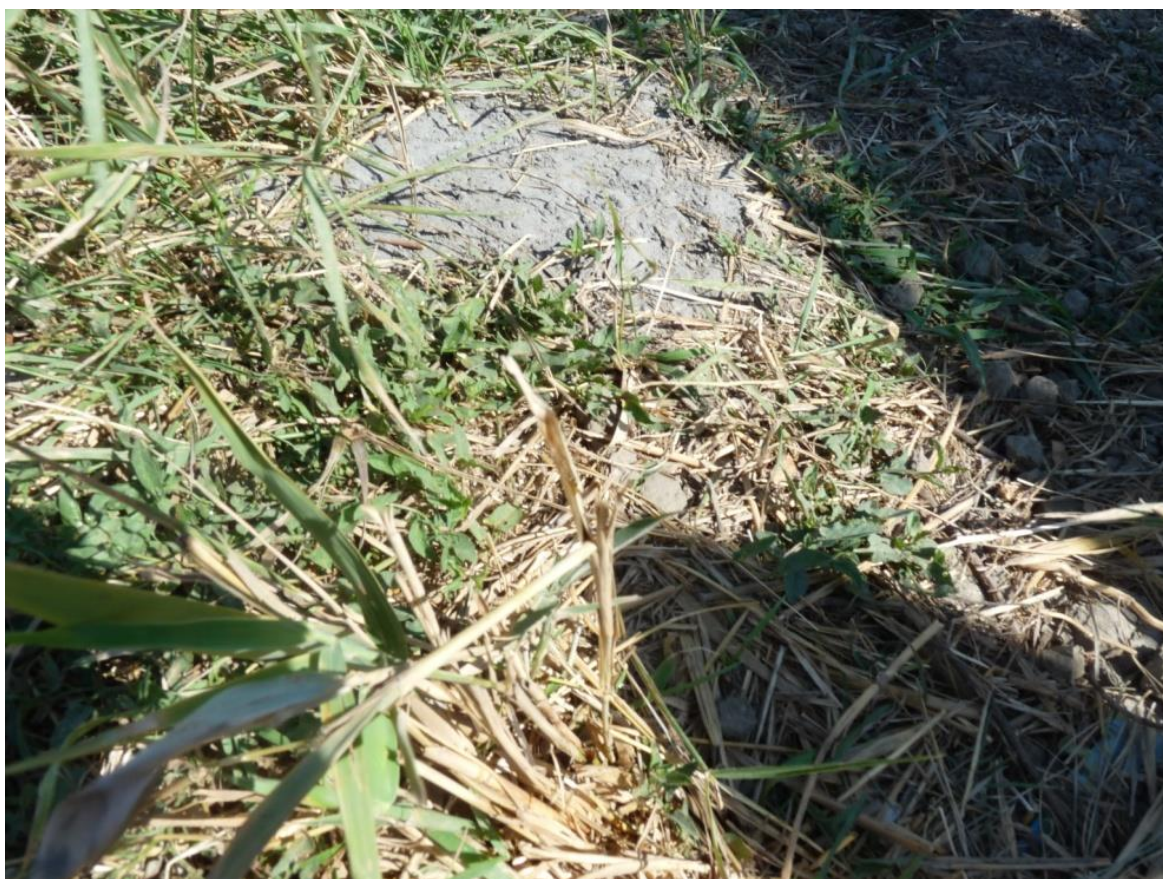
Рисунок 3 – Памятник природы «Грязелечебный участок (Стеблиевская соленая подкова)»