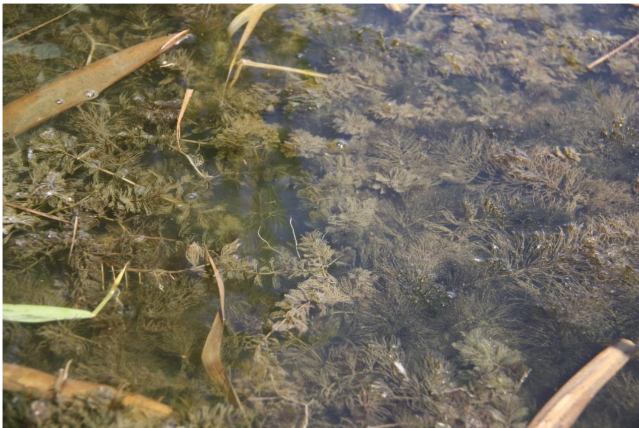
Рисунок 4 – Памятник природы «Грязелечебный участок (Стеблиевская соленая подкова)»