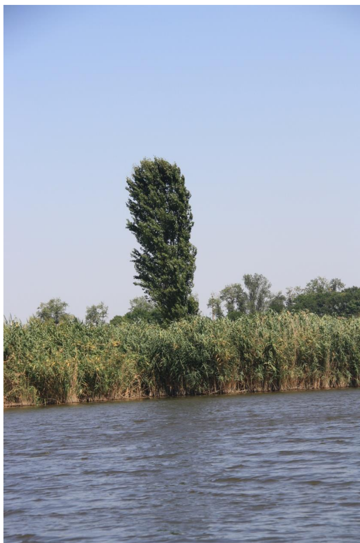
Рисунок 9 – Памятник природы «Грязелечебный участок (Стеблиевская соленая подкова)»