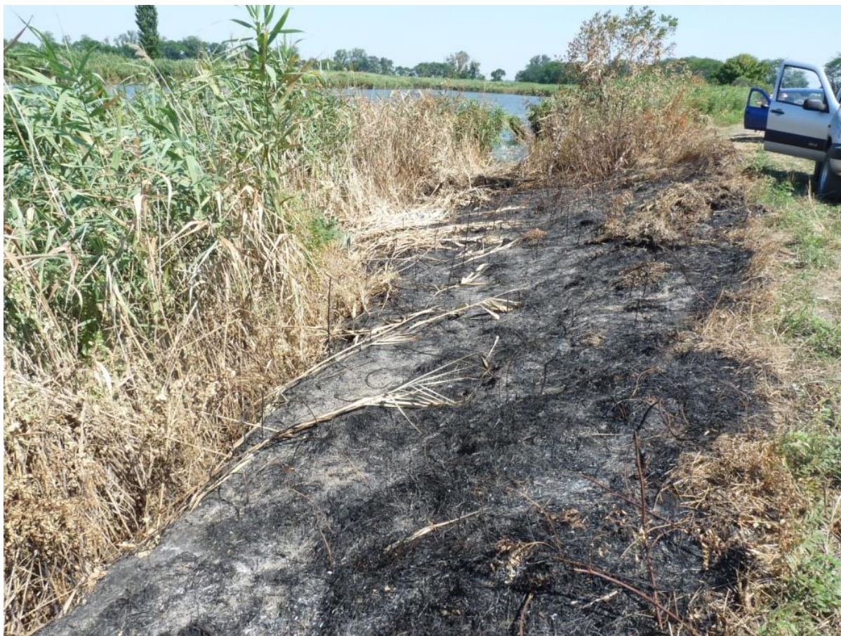
Рисунок 2 – Памятник природы «Грязелечебный участок (Стеблиевская соленая подкова)»