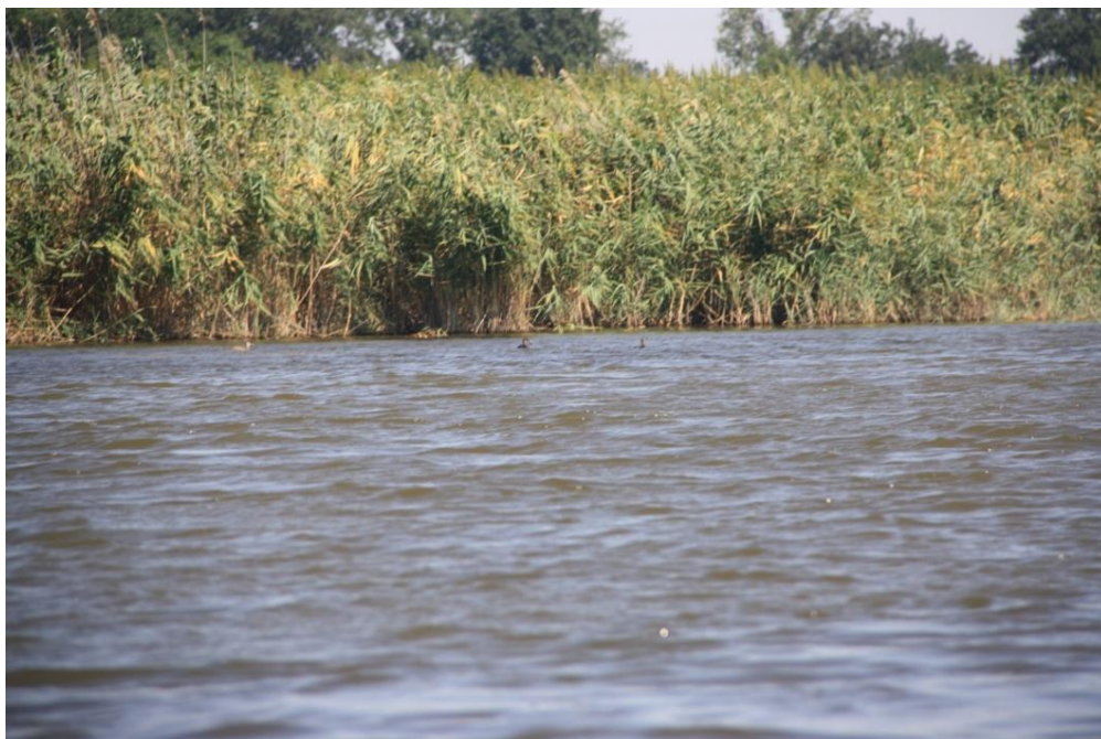
Рисунок 8 – Памятник природы «Грязелечебный участок (Стеблиевская соленая подкова)»