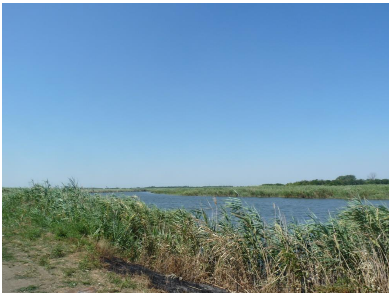
Рисунок 1 – Памятник природы «Грязелечебный участок (Стеблиевская соленая подкова)»

Дополнительные материалы – фотографии памятника природы или наиболее характерных его частей, картографический материал (карты (схемы) расположения памятника природы и охранный зоны (1:100000, 1:50000), карты (схемы) памятника природы с обозначением границ (1:2000 или 1:500, в зависимости от занимаемой площади), Охранное обязательство, иные материалы.