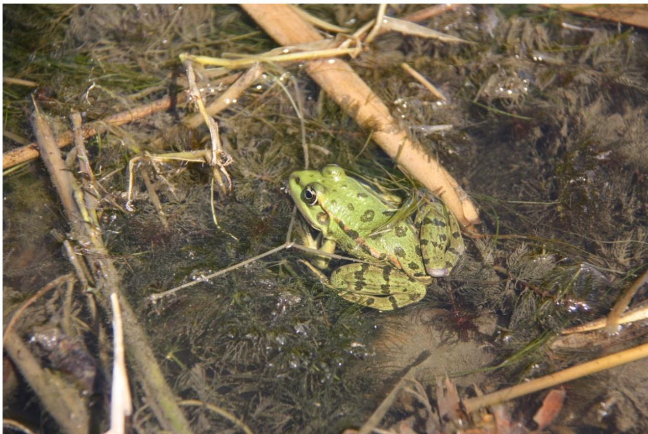
Рисунок 6 – Памятник природы «Грязелечебный участок (Стеблиевская соленая подкова)»