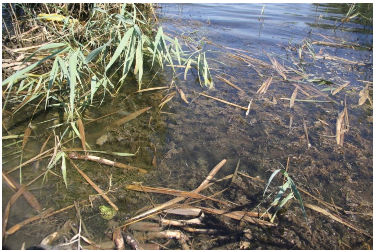
Рисунок 5 – Памятник природы «Грязелечебный участок (Стеблиевская соленая подкова)»