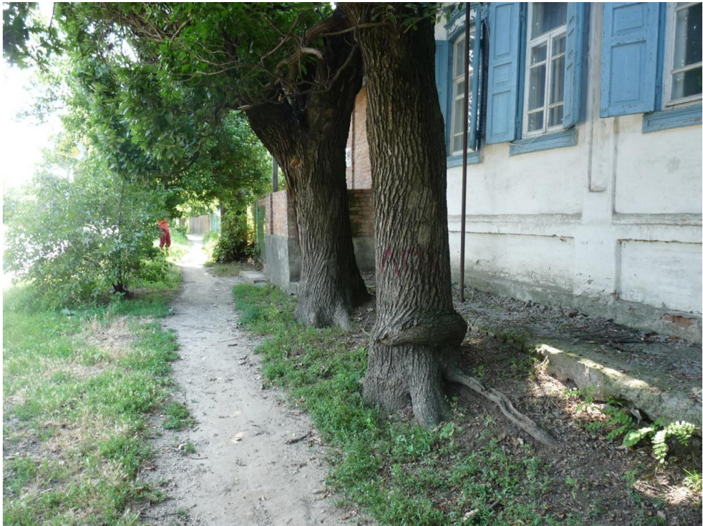
Рисунок 2 – Памятник природы «Дуб Старожил (3 дерева)»