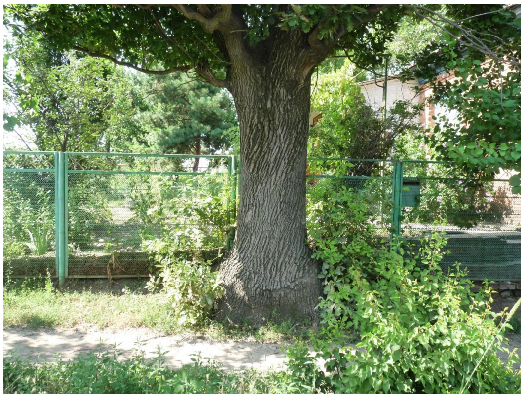
Рисунок 5 – Памятник природы «Дуб Старожил (3 дерева)»