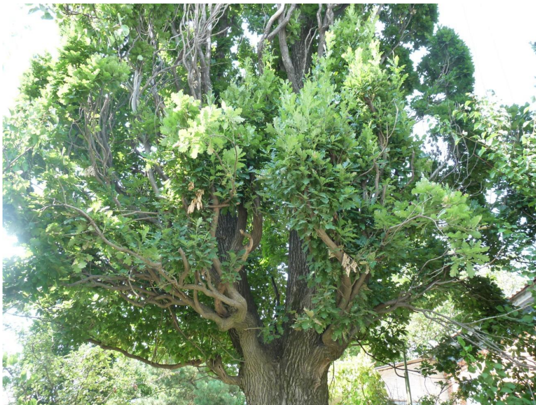
Рисунок 4 – Памятник природы «Дуб Старожил (3 дерева)»