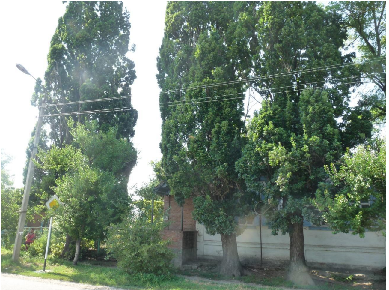
Рисунок 1 – Памятник природы «Дуб Старожил (3 дерева)»

Дополнительные материалы – фотографии памятника природы или наиболее характерных его частей, картографический материал (карты (схемы) расположения памятника природы и охранной зоны (1:100000, 1:50000), карты (схемы) памятника природы с обозначением границ (1:2000 или 1:500, в зависимости от занимаемой площади), Охранное обязательство, иные материалы.