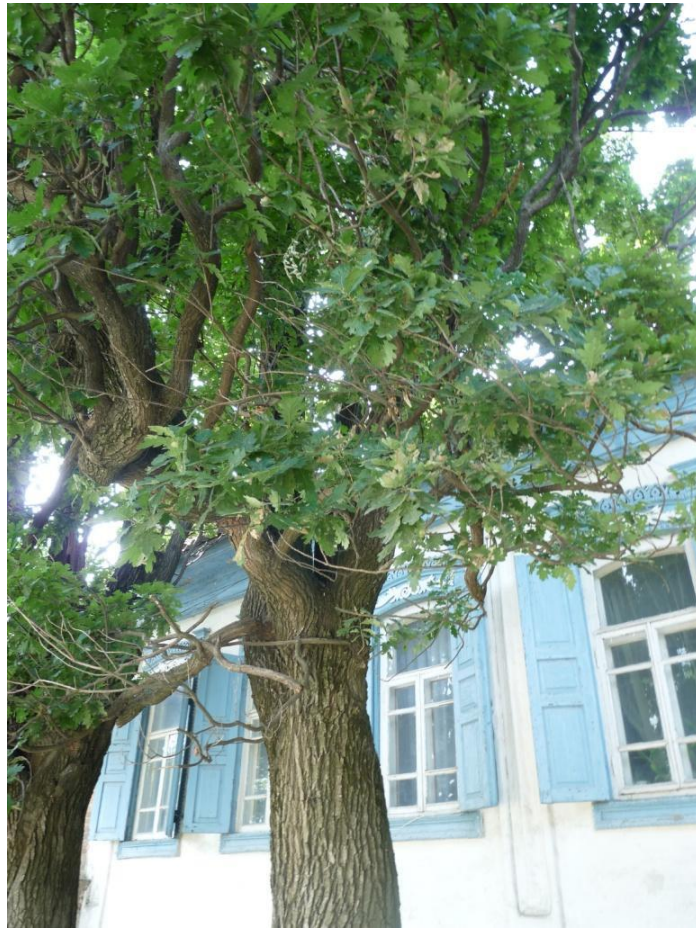
Рисунок 8 – Памятник природы «Дуб Старожил (3 дерева)»