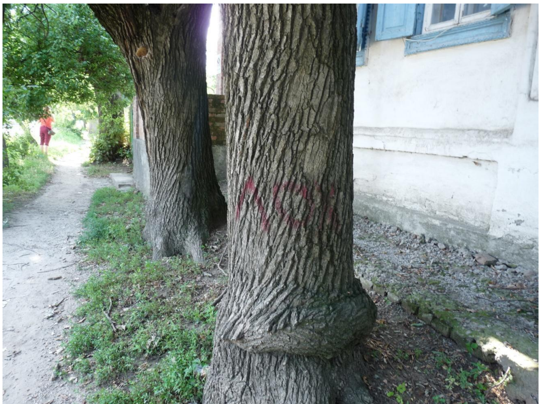
Рисунок 3 – Памятник природы «Дуб Старожил (3 дерева)»