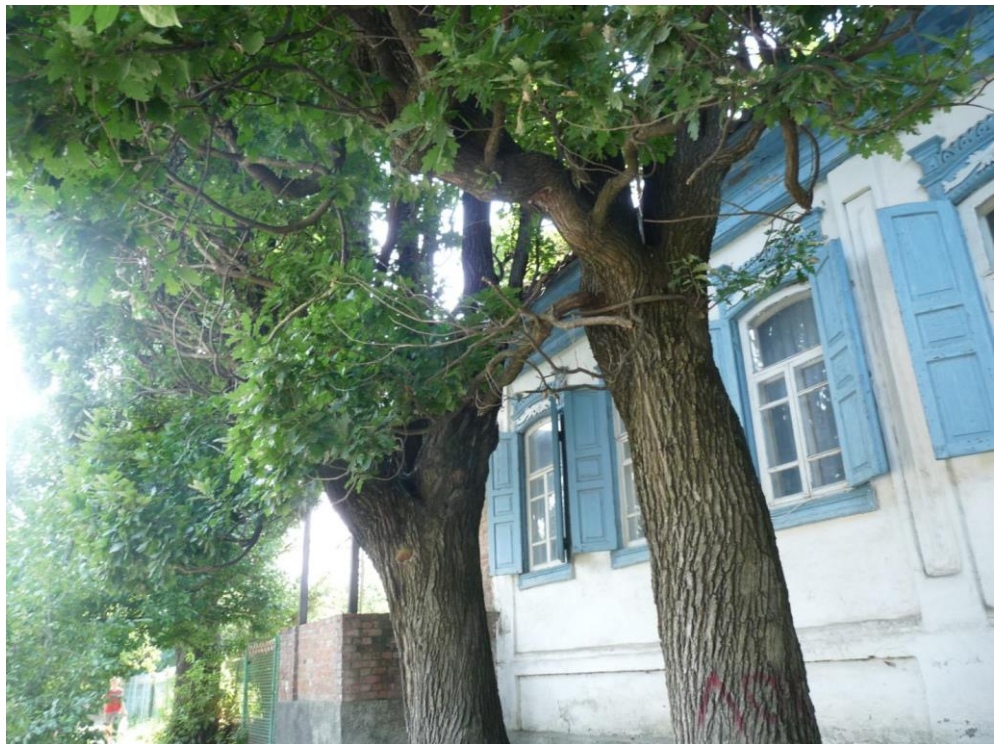
Рисунок 9 – Памятник природы «Дуб Старожил (3 дерева)»