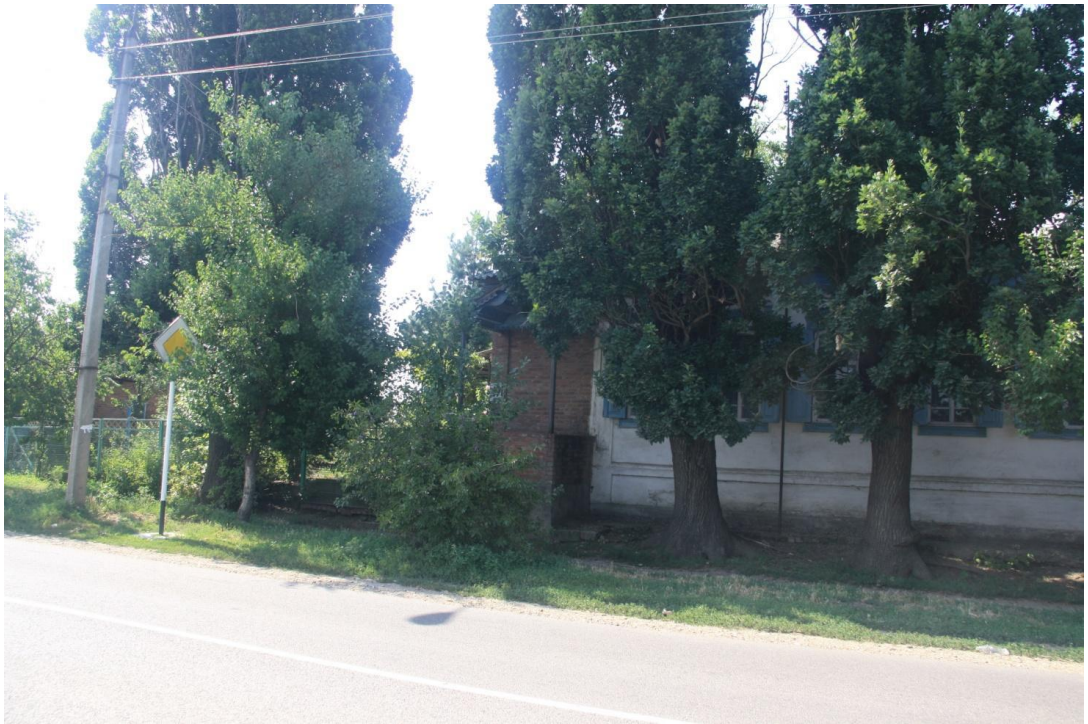
Рисунок 10 – Памятник природы «Дуб Старожил (3 дерева)»