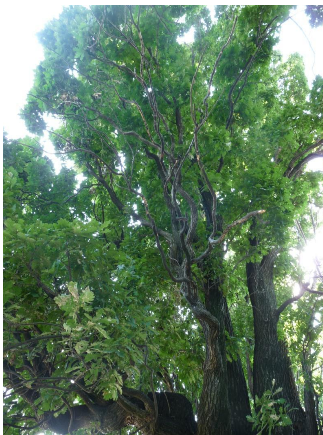
Рисунок 7 – Памятник природы «Дуб Старожил (3 дерева)»