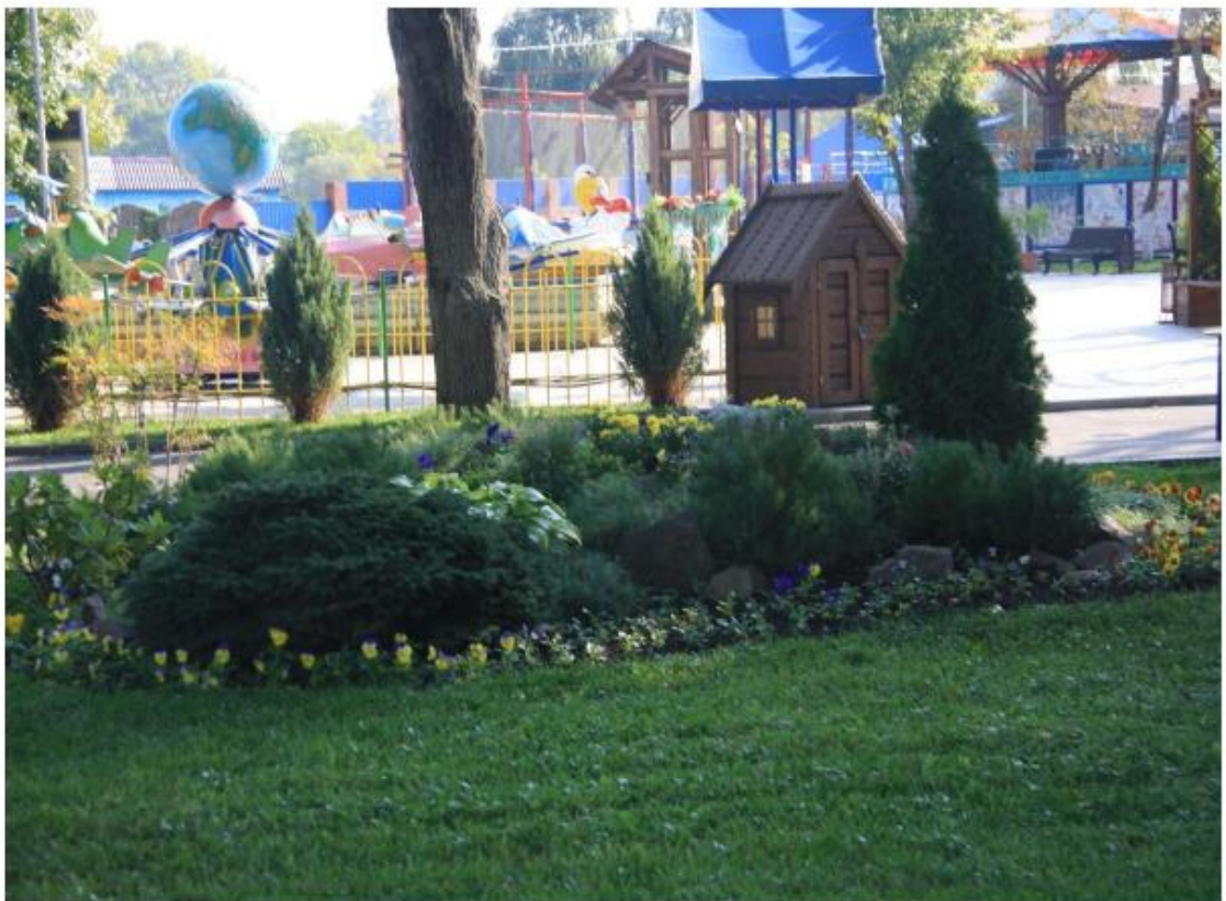
Рисунок 5 - Памятник природы «Парк Солнечный остров»