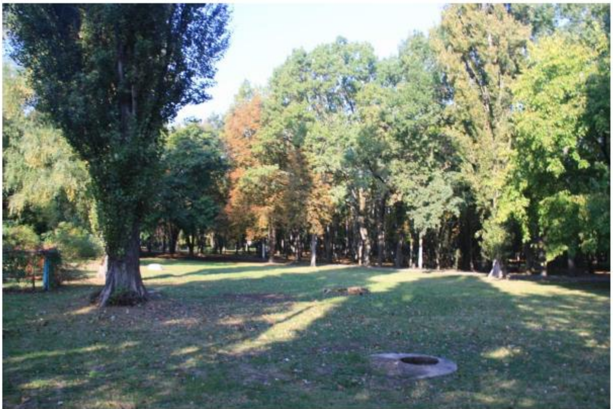
Рисунок 9 - Памятник природы «Парк Солнечный остров»