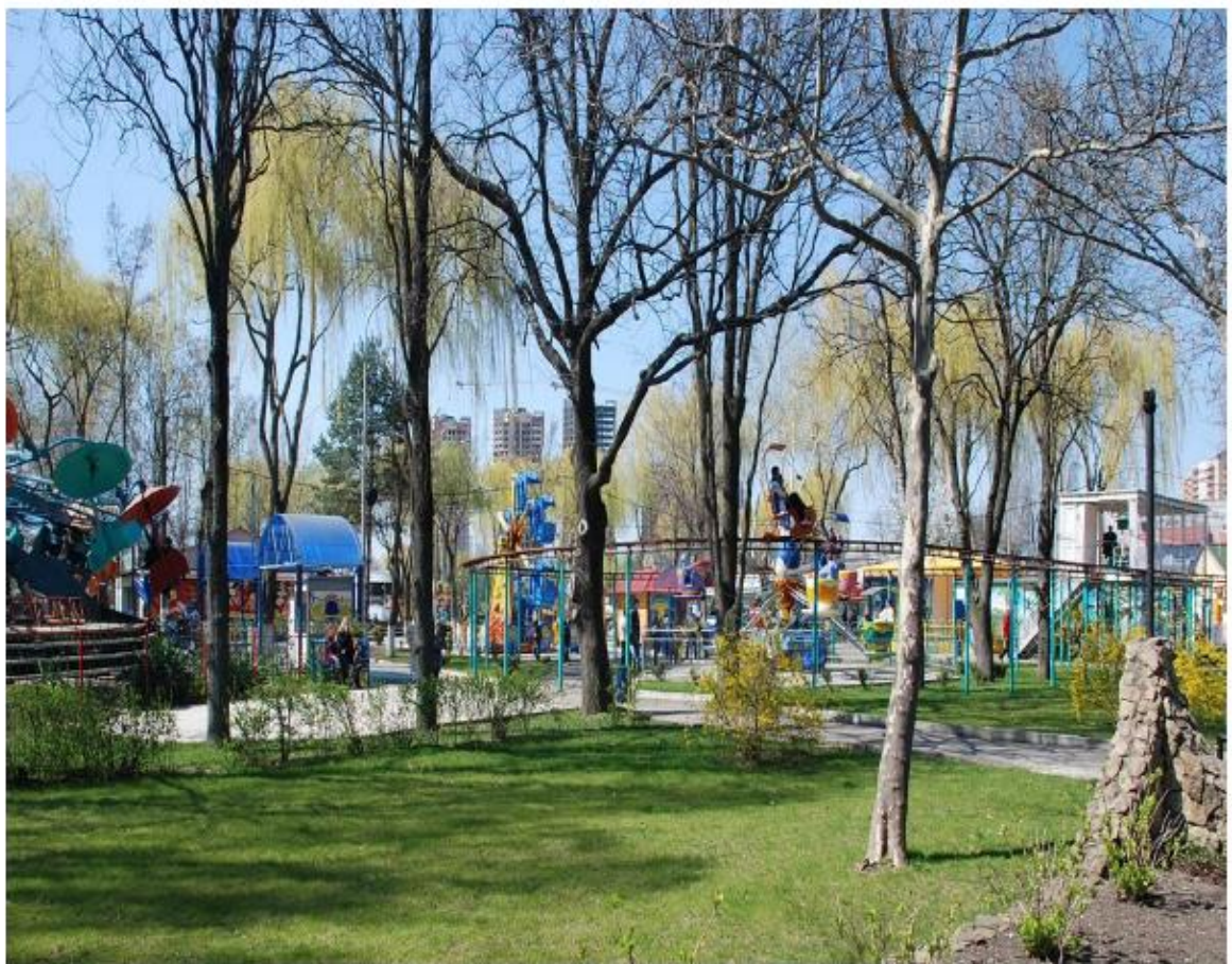
Рисунок 3 - Памятник природы «Парк Солнечный остров»