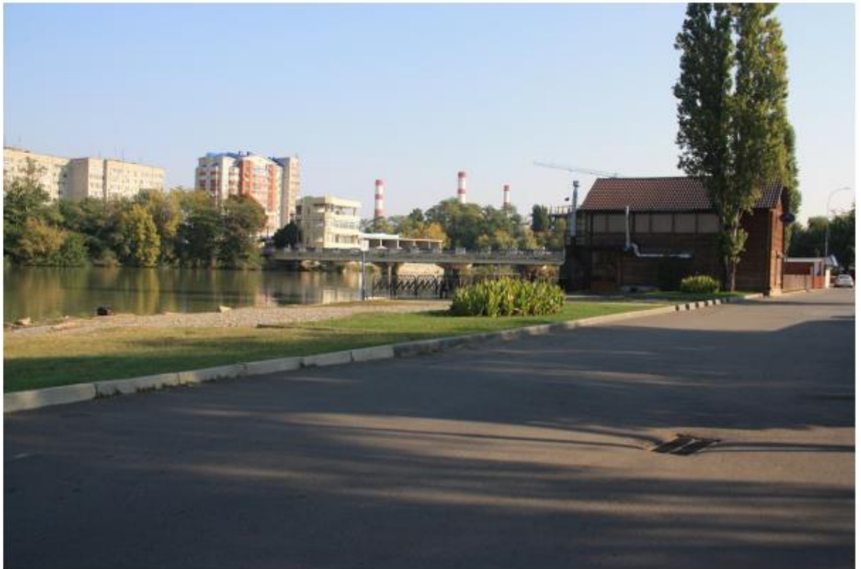
Рисунок 2 - Памятник природы «Парк Солнечный остров»