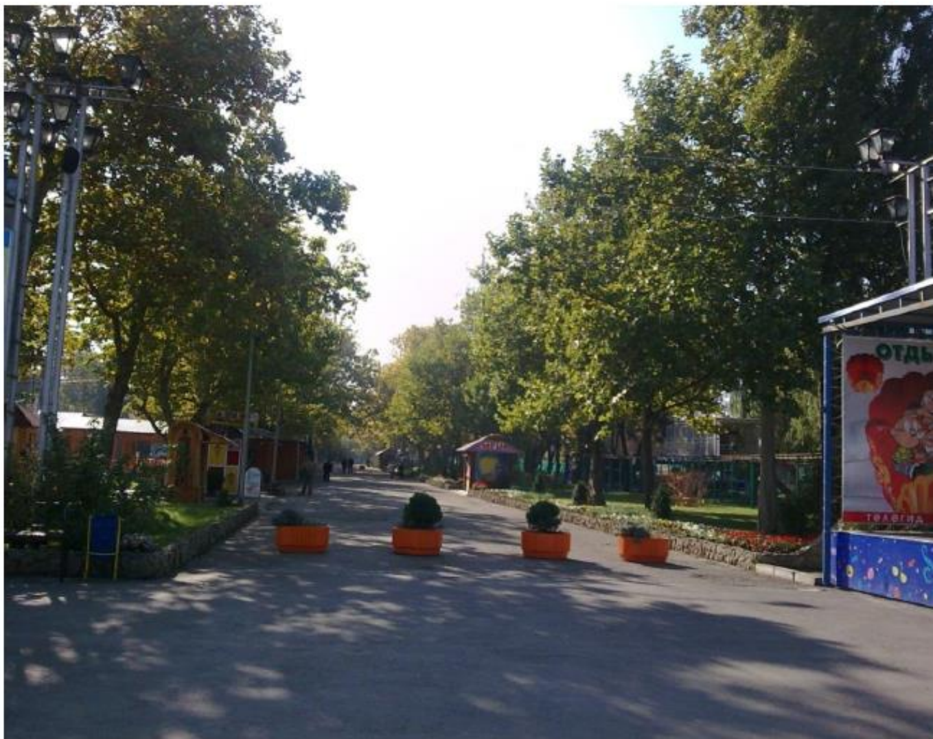
Рисунок 1 - Памятник природы «Парк Солнечный остров»

Дополнительные материалы – фотографии памятника природы или наиболее характерных его частей, картографический материал (карты (схемы) расположения памятника природы и охранный зоны (1:100000, 1:50000), карты (схемы) памятника природы с обозначением границ (1:2000 или 1:500, в зависимости от занимаемой площади), Охранное обязательство, иные материалы.