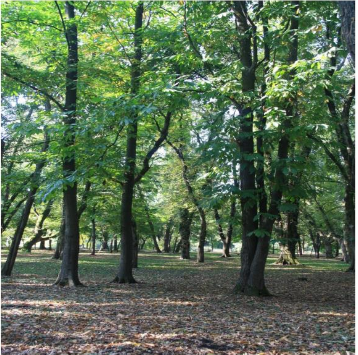
Рисунок 10 - Памятник природы «Парк Солнечный остров»