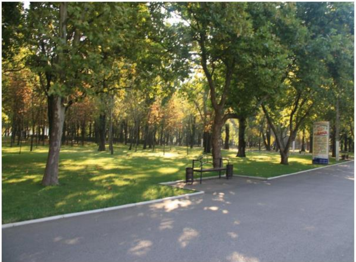
Рисунок 6 - Памятник природы «Парк Солнечный остров»