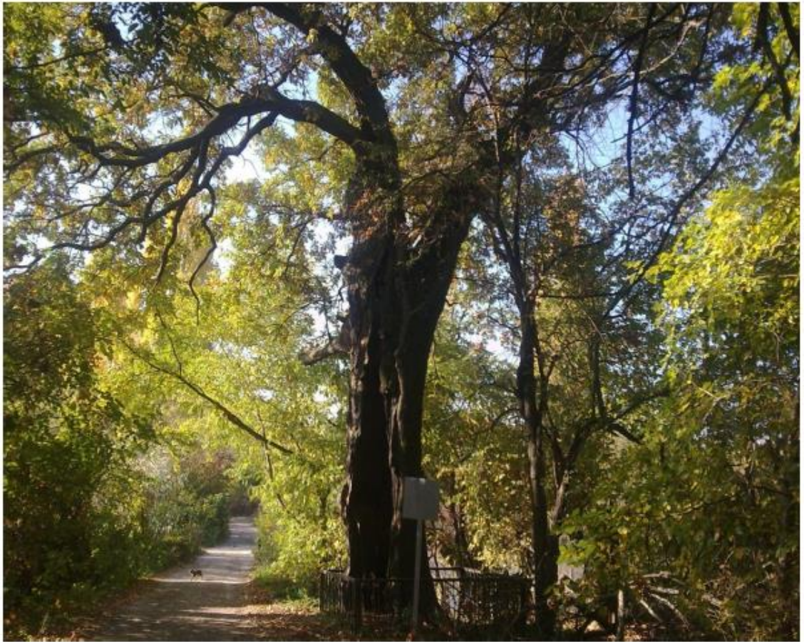
Рисунок 4 - Памятник природы «Парк Солнечный остров»