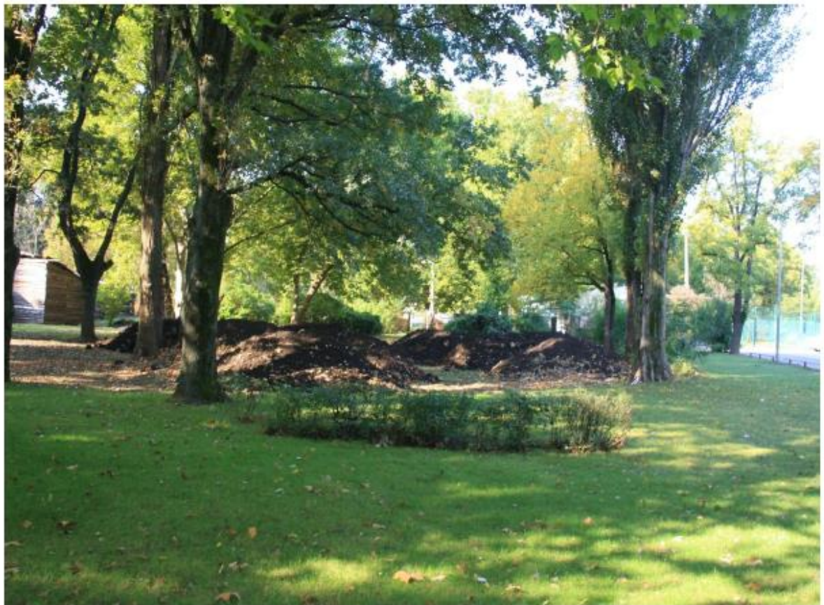
Рисунок 7 - Памятник природы «Парк Солнечный остров»