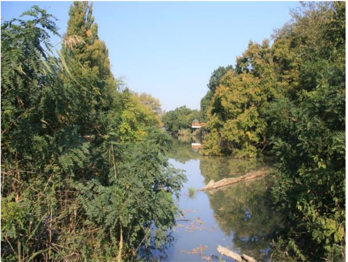
Рисунок 8 - Памятник природы «Парк Солнечный остров»