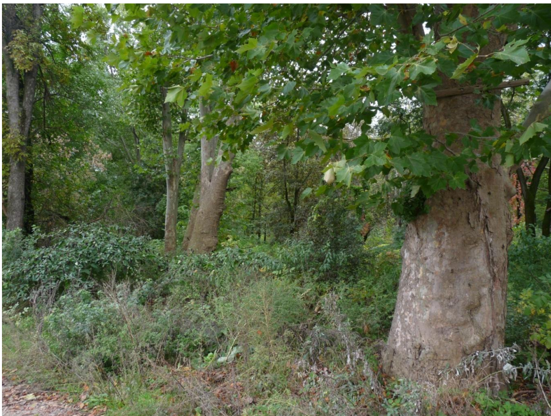
Рисунок 7 – Памятник природы «Платановая аллея»