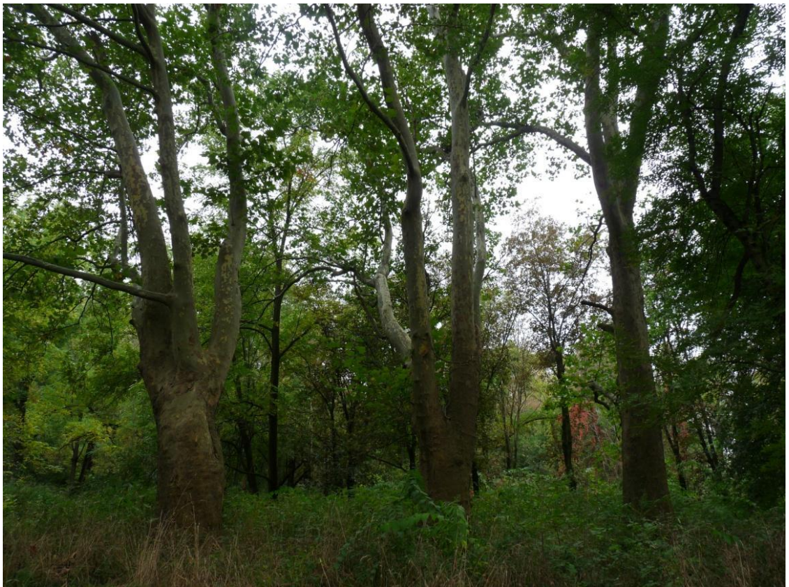
Рисунок 9 – Памятник природы «Платановая аллея»