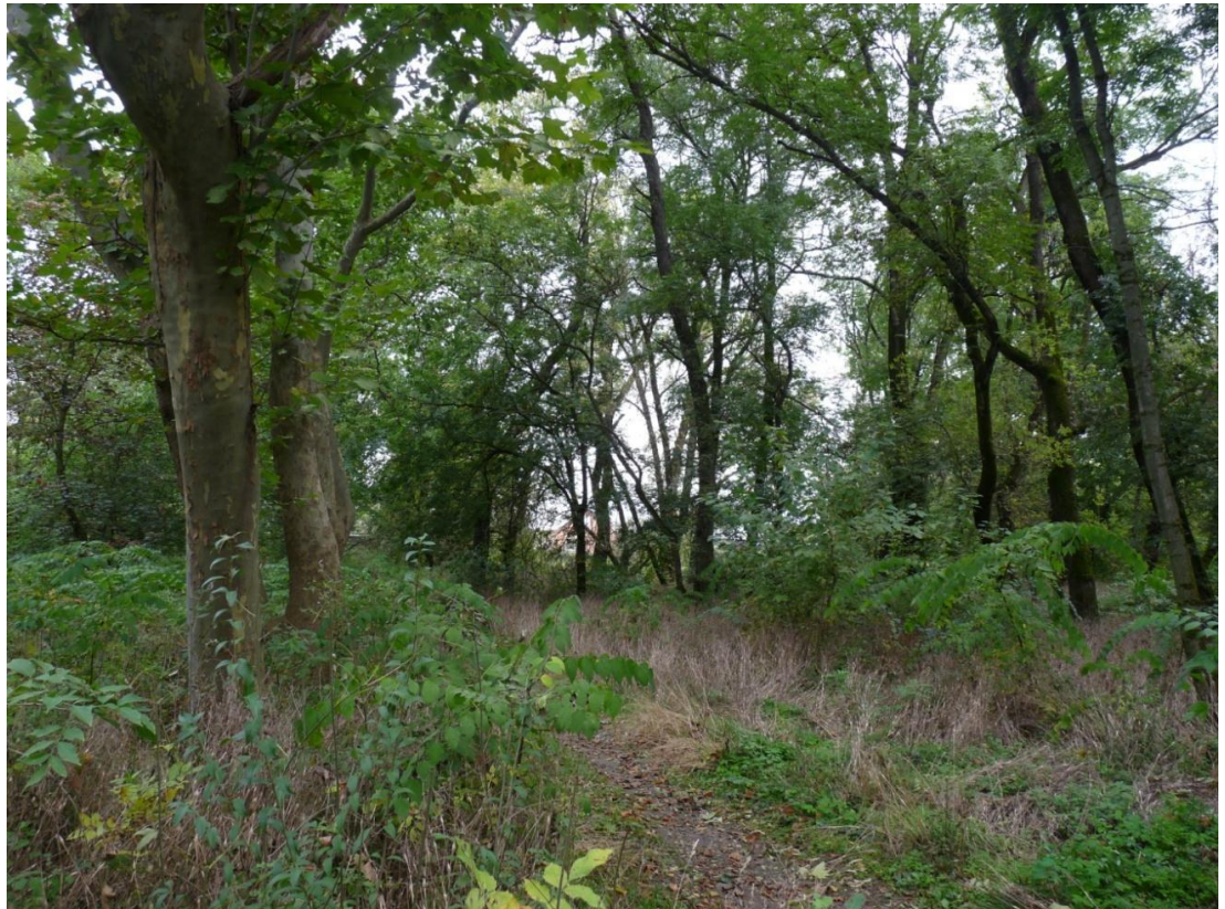
Рисунок 4 – Памятник природы «Платановая аллея»