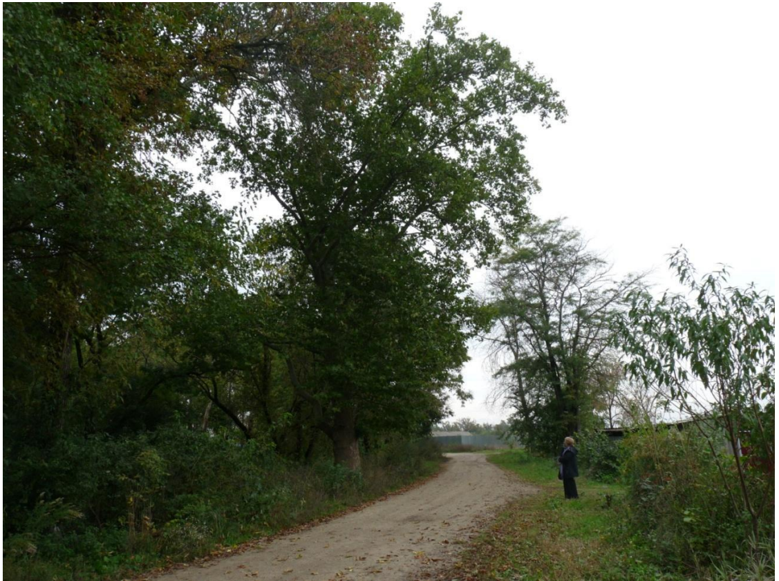
Рисунок 8 – Памятник природы «Платановая аллея»