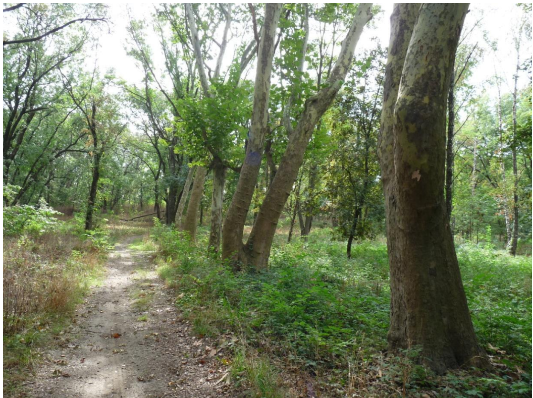
Рисунок 3– Памятник природы «Платановая аллея»