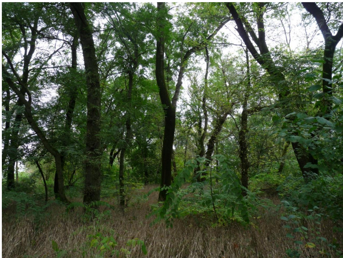
Рисунок 6— Памятник природы «Платановая аллея»