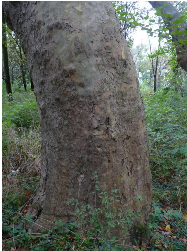
Рисунок 10 – Памятник природы «Платановая аллея»