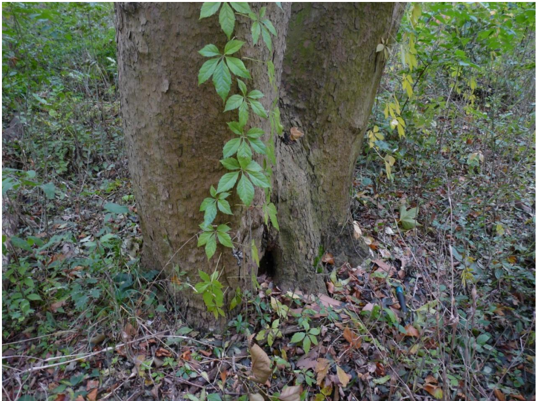
Рисунок 5 – Памятник природы «Платановая аллея»