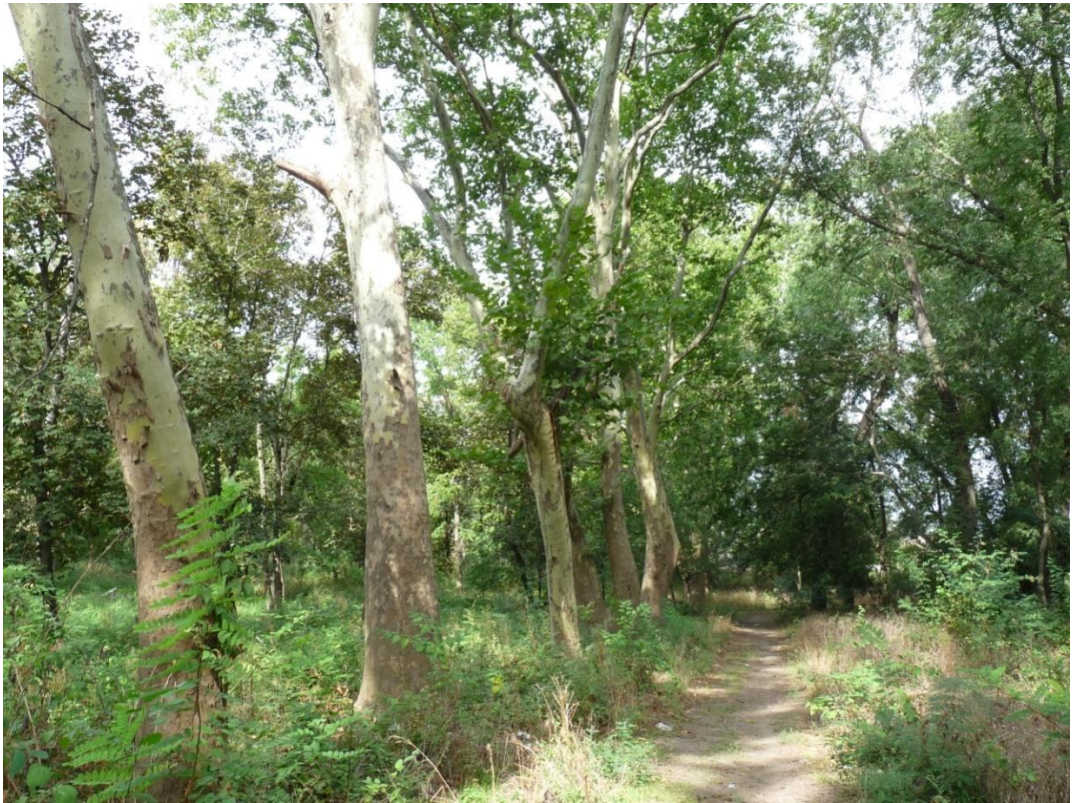
Рисунок 2 – Памятник природы «Платановая аллея»