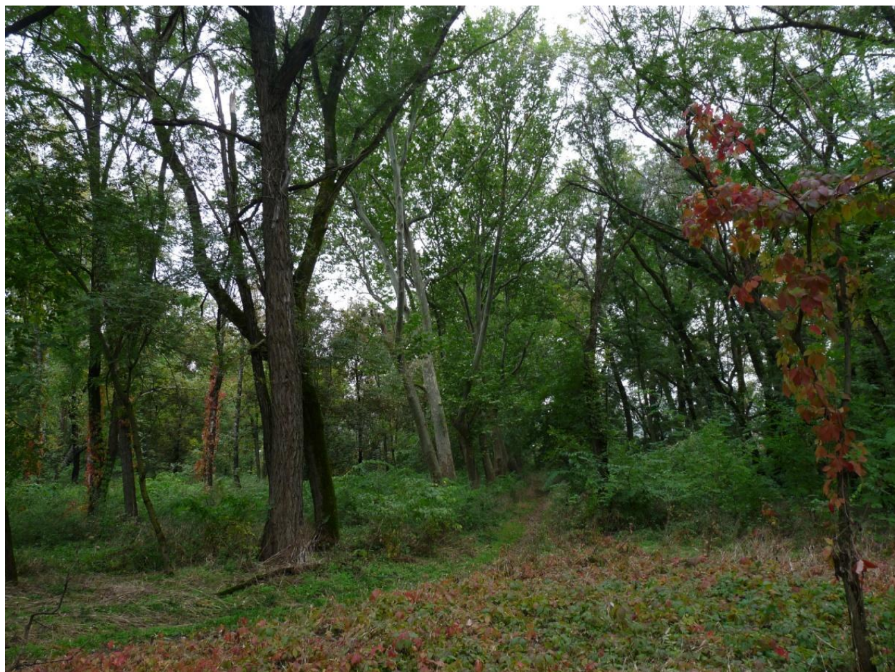
Рисунок 1 – Памятник природы «Платановая аллея»

Дополнительные материалы – фотографии памятника природы или наиболее характерных его частей, картографический материал (карты (схемы) расположения памятника природы и охранный зоны (1:100000, 1:50000), карты (схемы) памятника природы с обозначением границ (1:2000 или 1:500, в зависимости от занимаемой площади), Охранное обязательство, иные материалы.