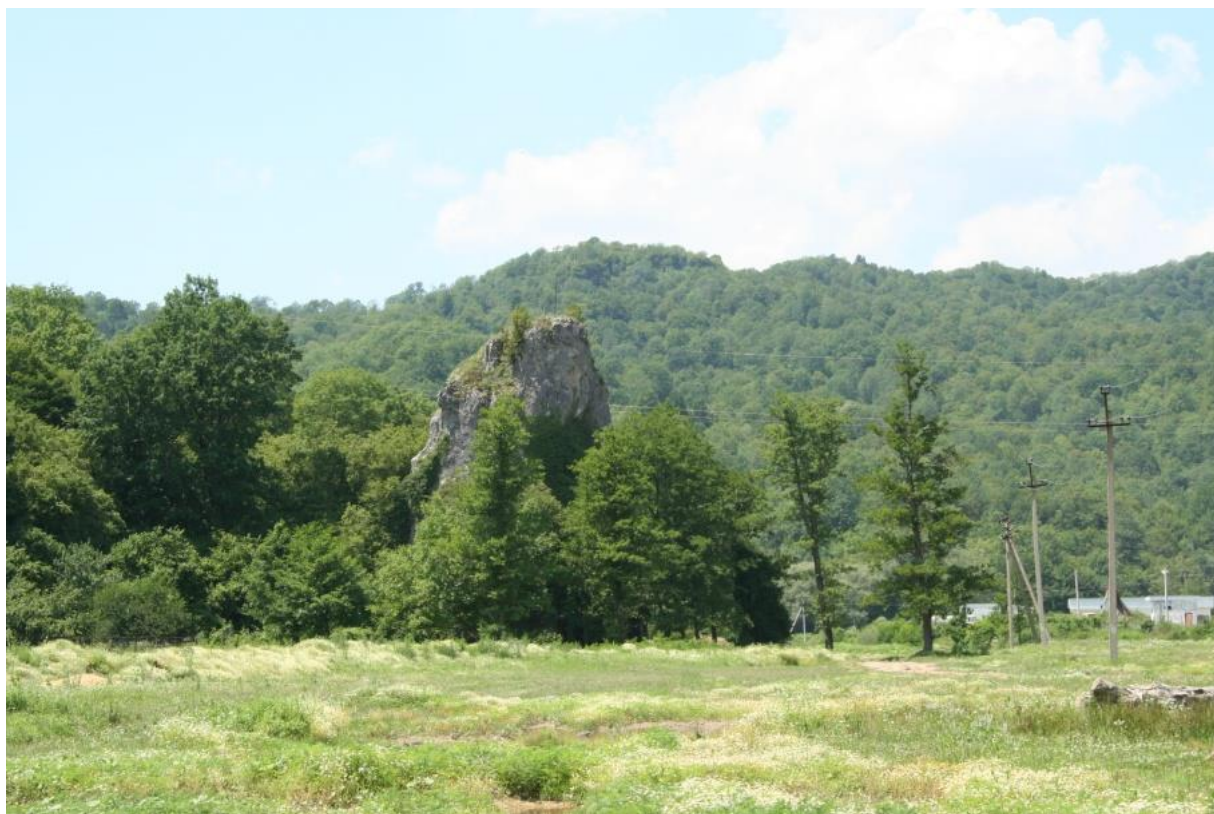
Рисунок 4 – Памятник природы «Скала Монах»