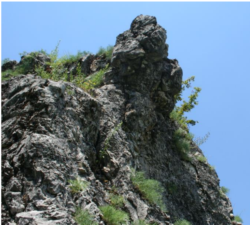
Рисунок 8 – Памятник природы «Скала Монах»