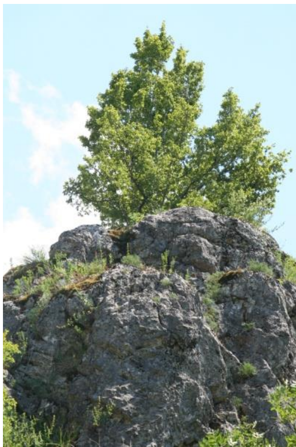
Рисунок 6 – Памятник природы «Скала Монах»