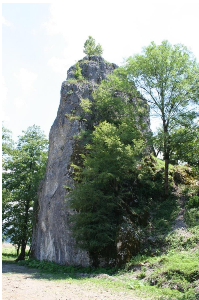
Рисунок 1 – Памятник природы «Скала Монах»

Дополнительные материалы – фотографии памятника природы или наиболее характерных его частей, картографический материал (карты (схемы) расположения памятника природы и охранный зоны (1:100000, 1:50000), карты (схемы) памятника природы с обозначением границ (1:2000 или 1:500, в зависимости от занимаемой площади), Охранное обязательство, иные материалы.