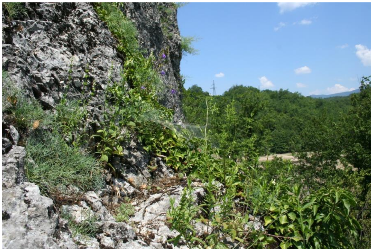
Рисунок 5 – Памятник природы «Скала Монах»