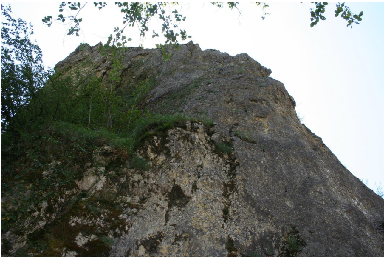
Рисунок 2 – Памятник природы «Скала Монах»