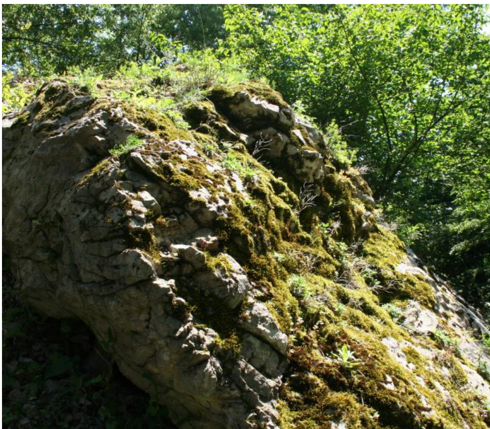
Рисунок 9 – Памятник природы «Скала Монах»