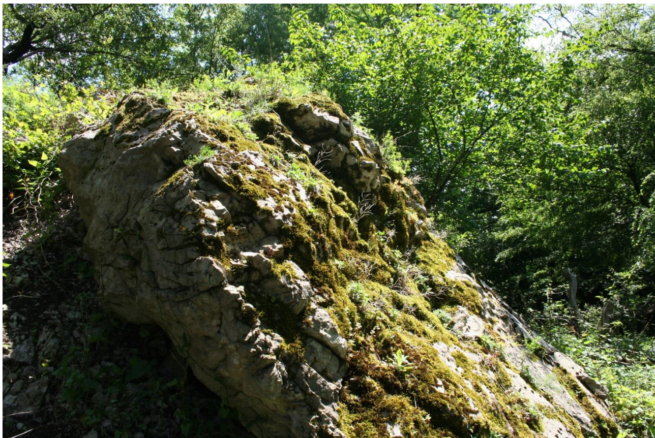
Рисунок 3 – Памятник природы «Скала Монах»