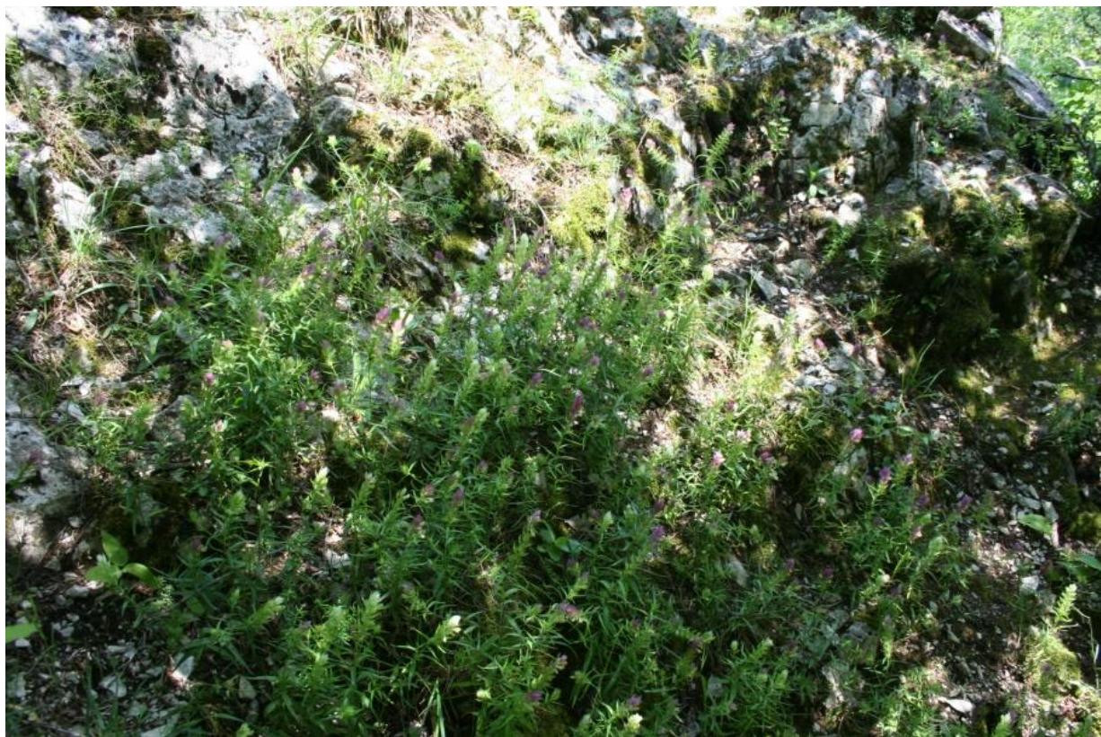
Рисунок 7 – Памятник природы «Скала Монах»