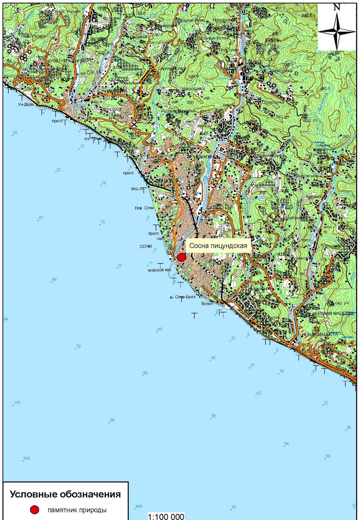
Схема расположения памятника природы «Сосна пицундская»