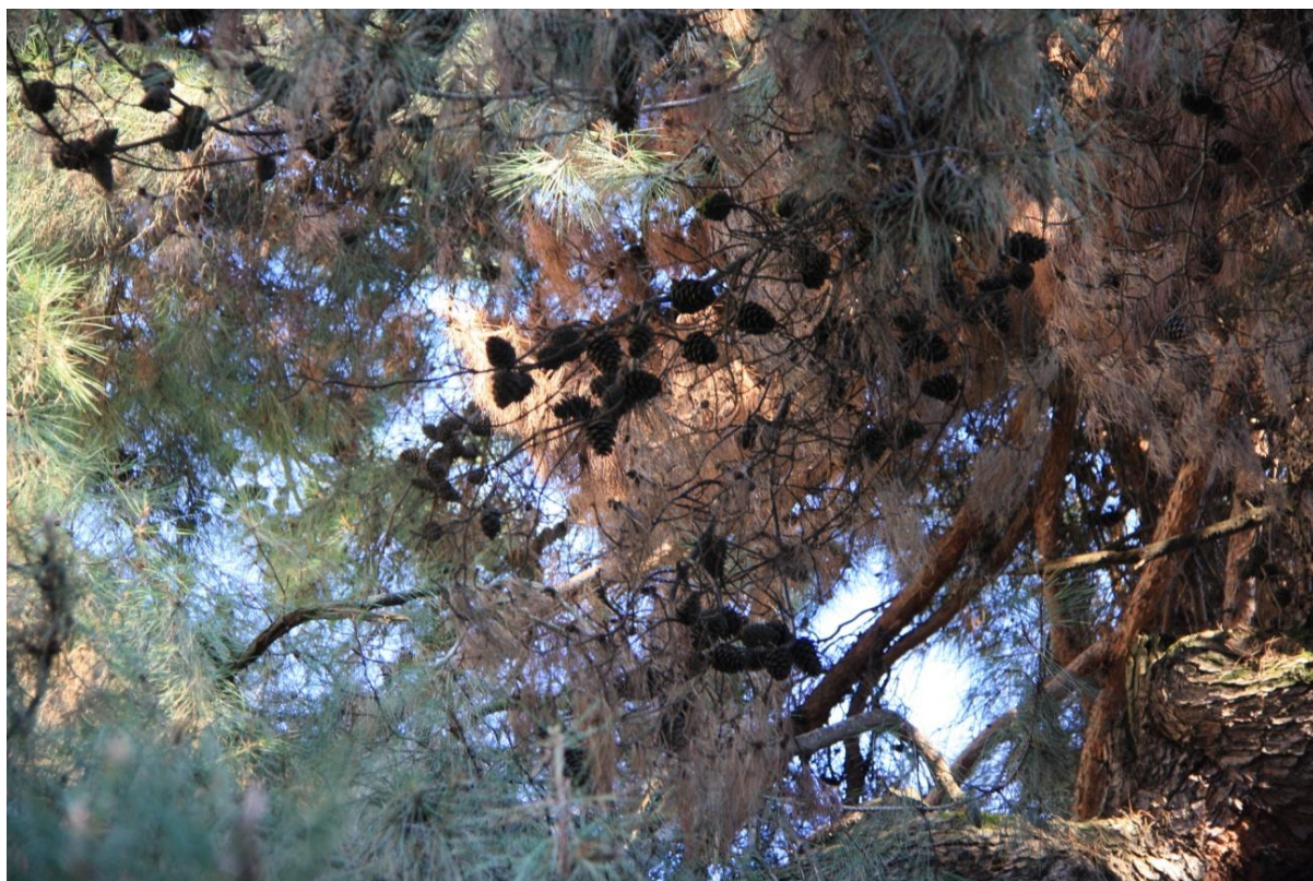
Рисунок 5 – Памятник природы «Сосна пицундская»