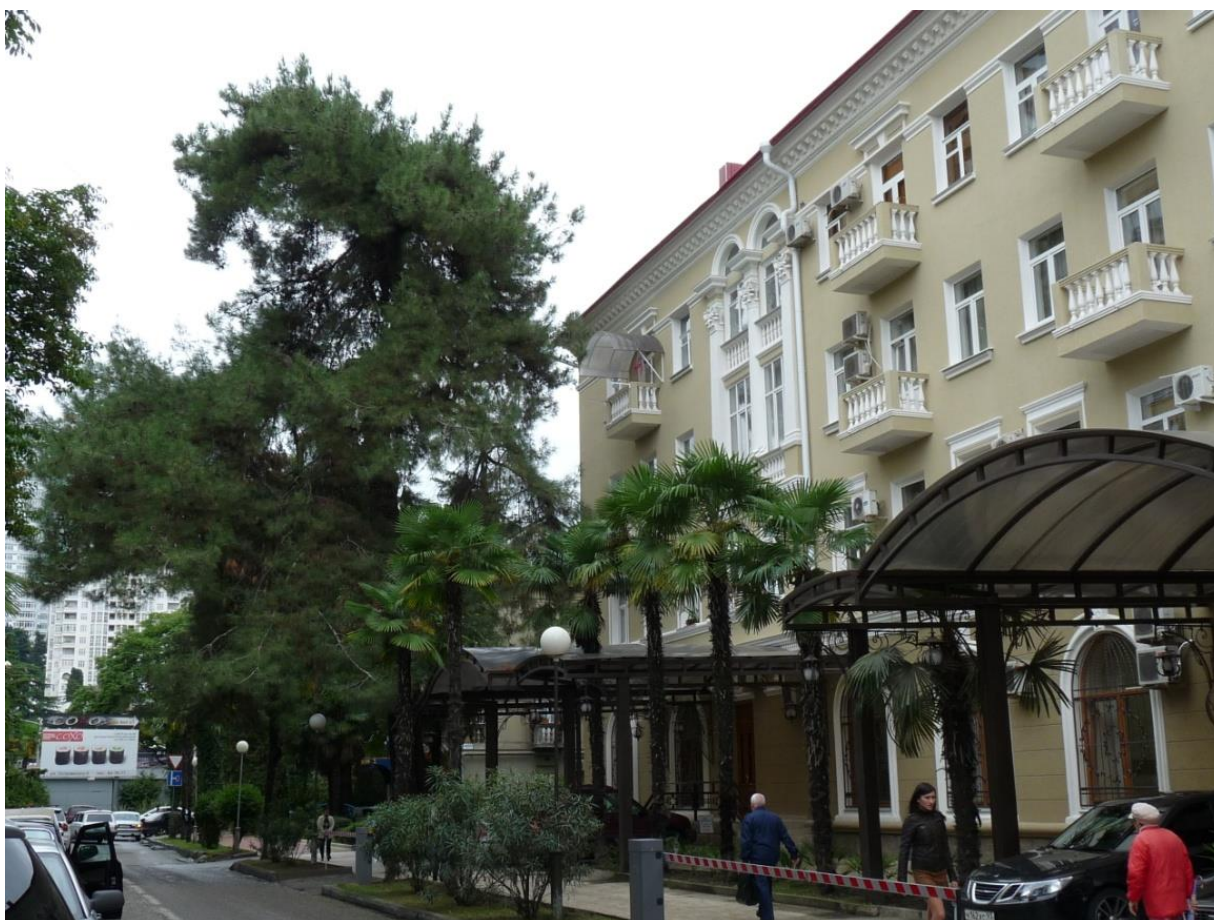
Рисунок 1 – Памятник природы «Сосна пицундская»

Дополнительные материалы – фотографии памятника природы или наиболее характерных его частей, картографический материал (карты (схемы) расположения памятника природы и охранный зоны (1:100000, 1:50000), карты (схемы) памятника природы с обозначением границ (1:2000 или 1:500, в зависимости от занимаемой площади), Охранное обязательство, иные материалы.