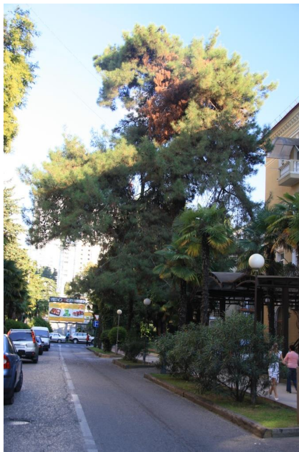
Рисунок 7 – Памятник природы «Сосна пицундская»