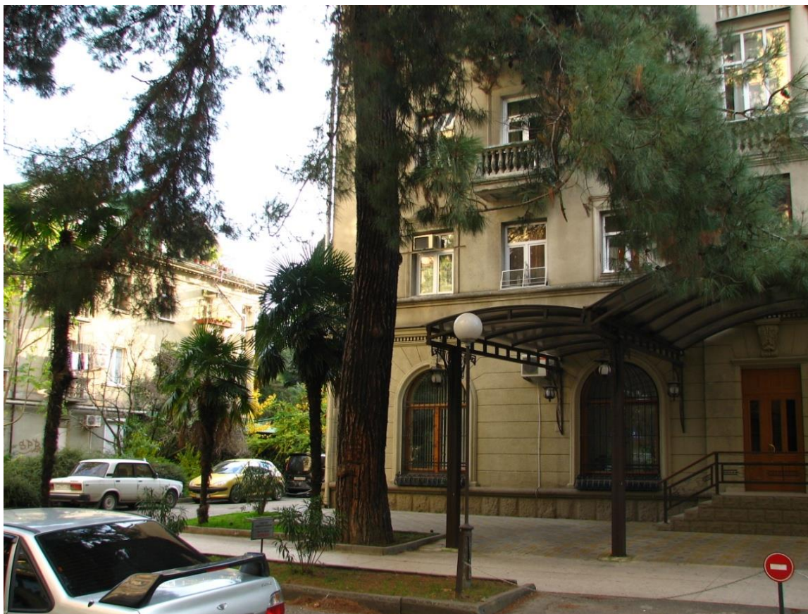
Рисунок 2 – Памятник природы «Сосна пицундская»