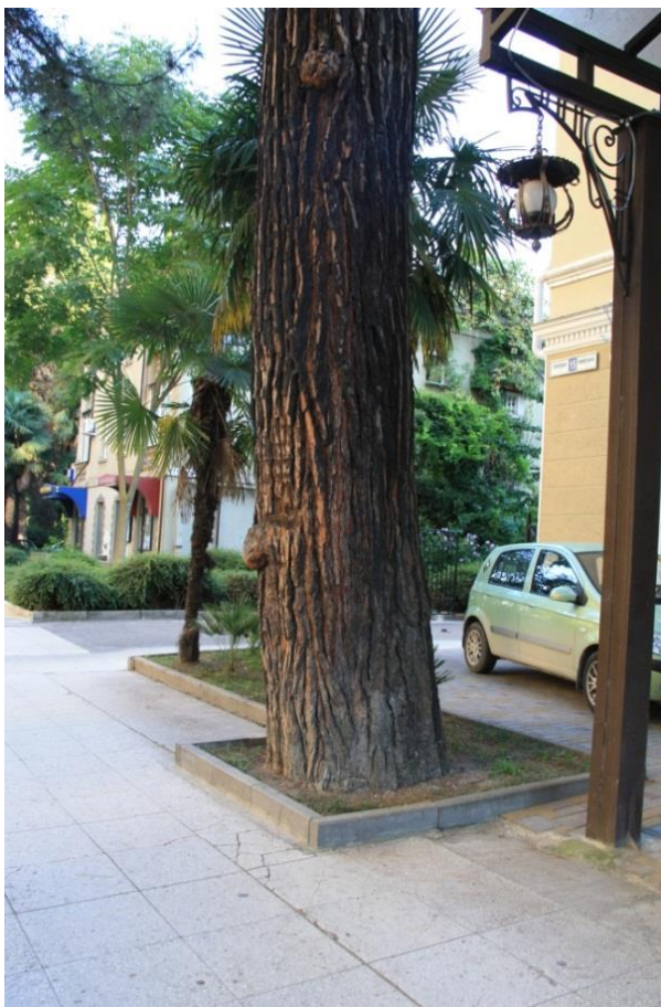
Рисунок 8 – Памятник природы «Сосна пицундская»