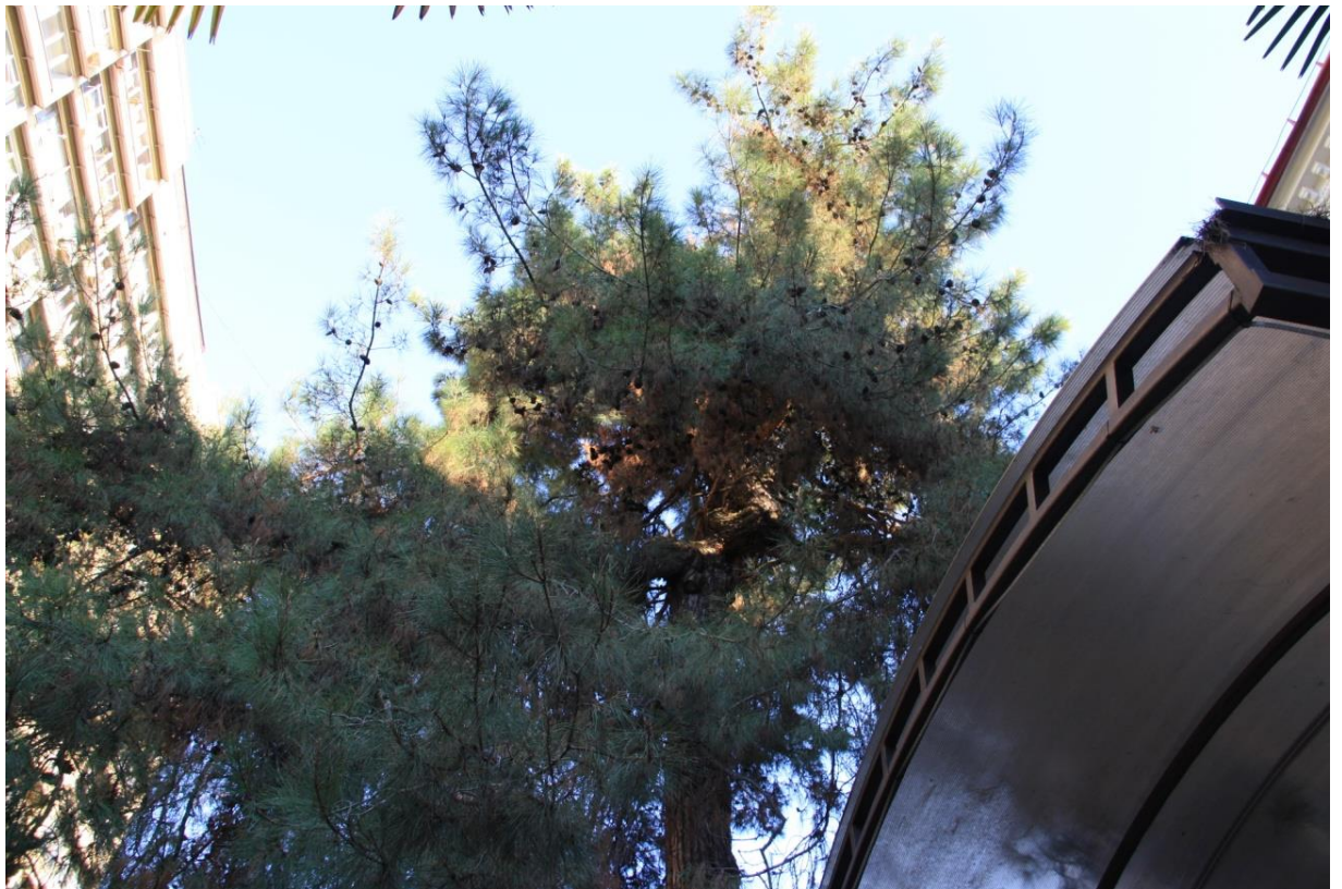
Рисунок 6 – Памятник природы «Сосна пицундская»