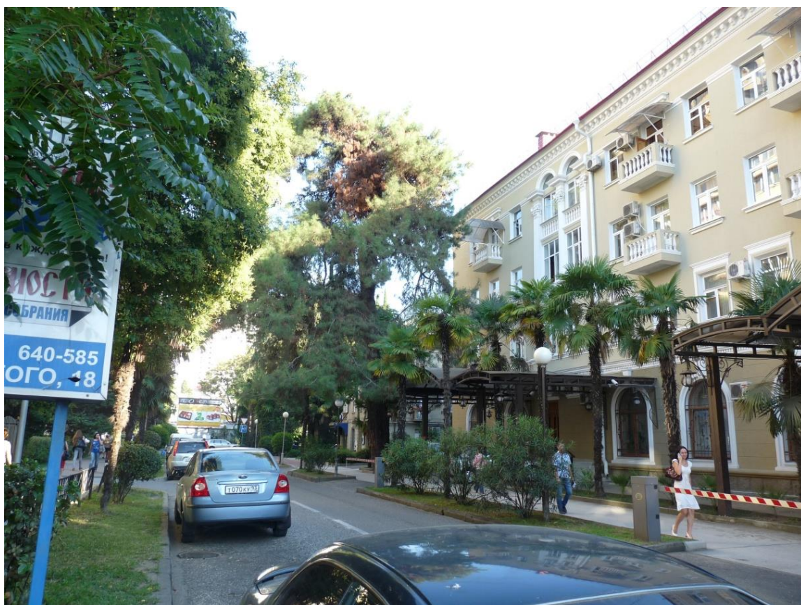
Рисунок 3 – Памятник природы «Сосна пицундская»