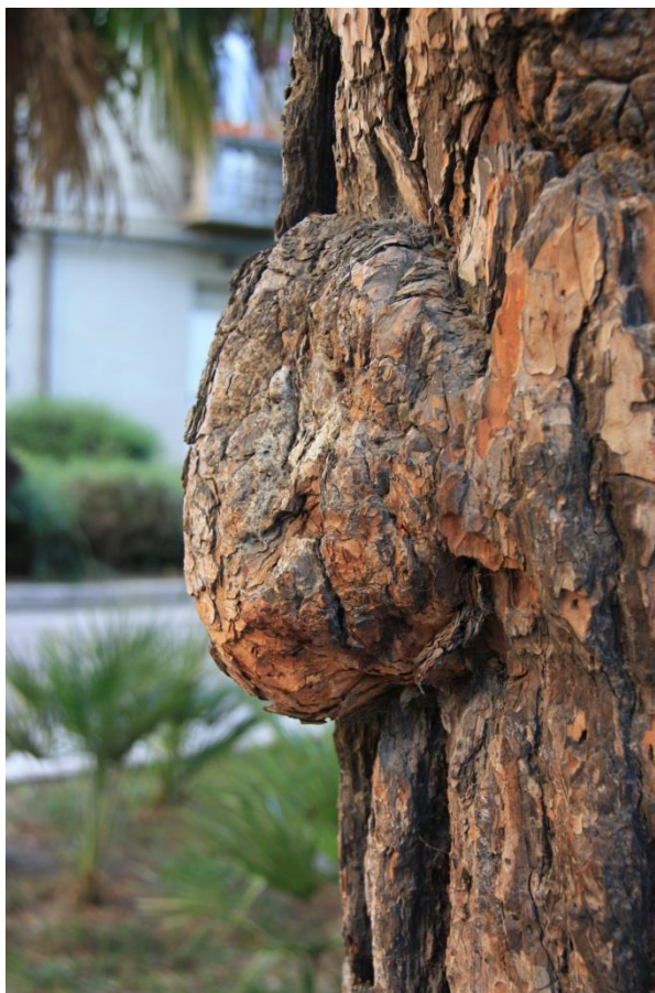
Рисунок 4 – Памятник природы «Сосна пицундская»