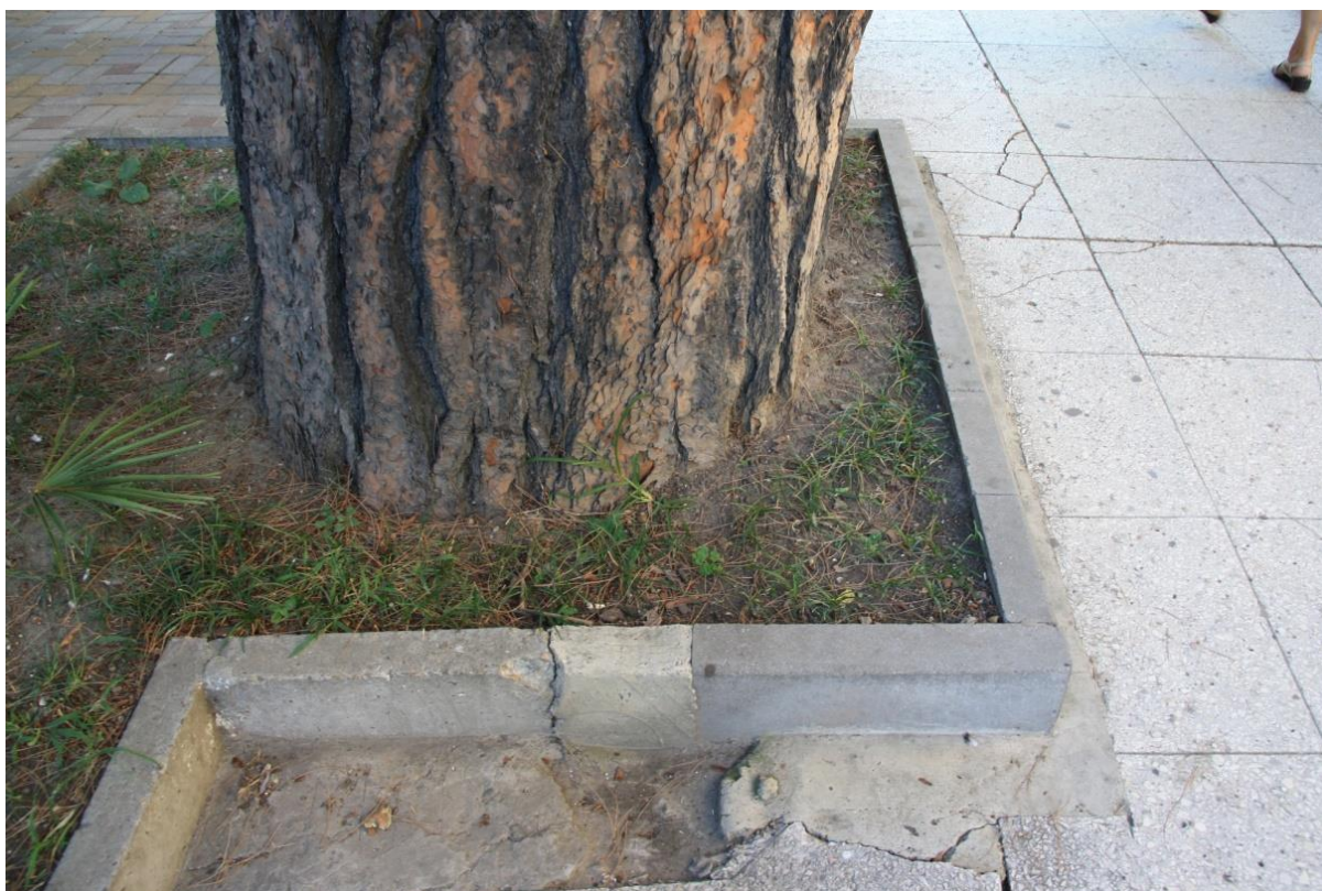
Рисунок 9 – Памятник природы «Сосна пицундская»