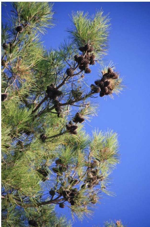
Рисунок 8 – Памятник природы «Сосновая роща»