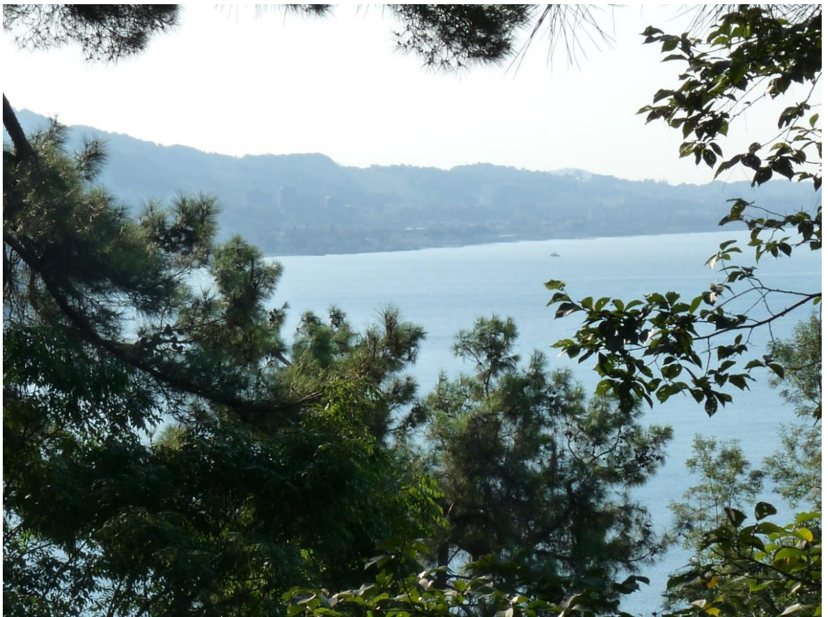
Рисунок 3 – Памятник природы «Сосновая роща»