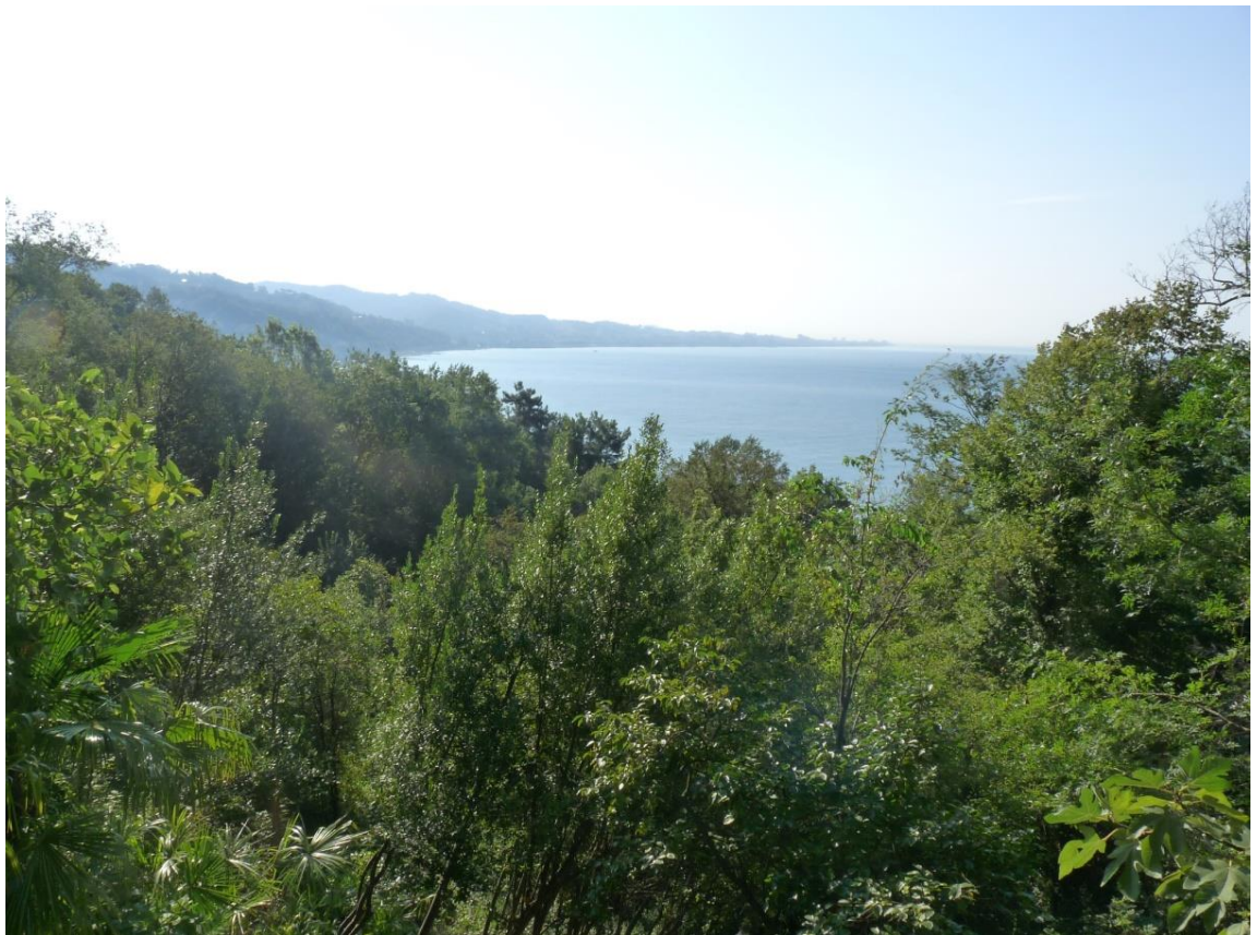
Рисунок 5 – Памятник природы «Сосновая роща»