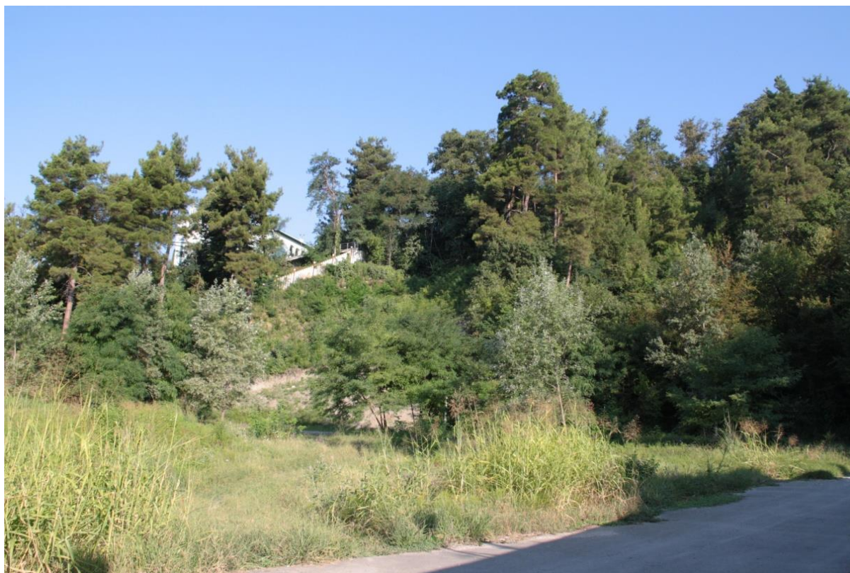
Рисунок 9 – Памятник природы «Сосновая роща»