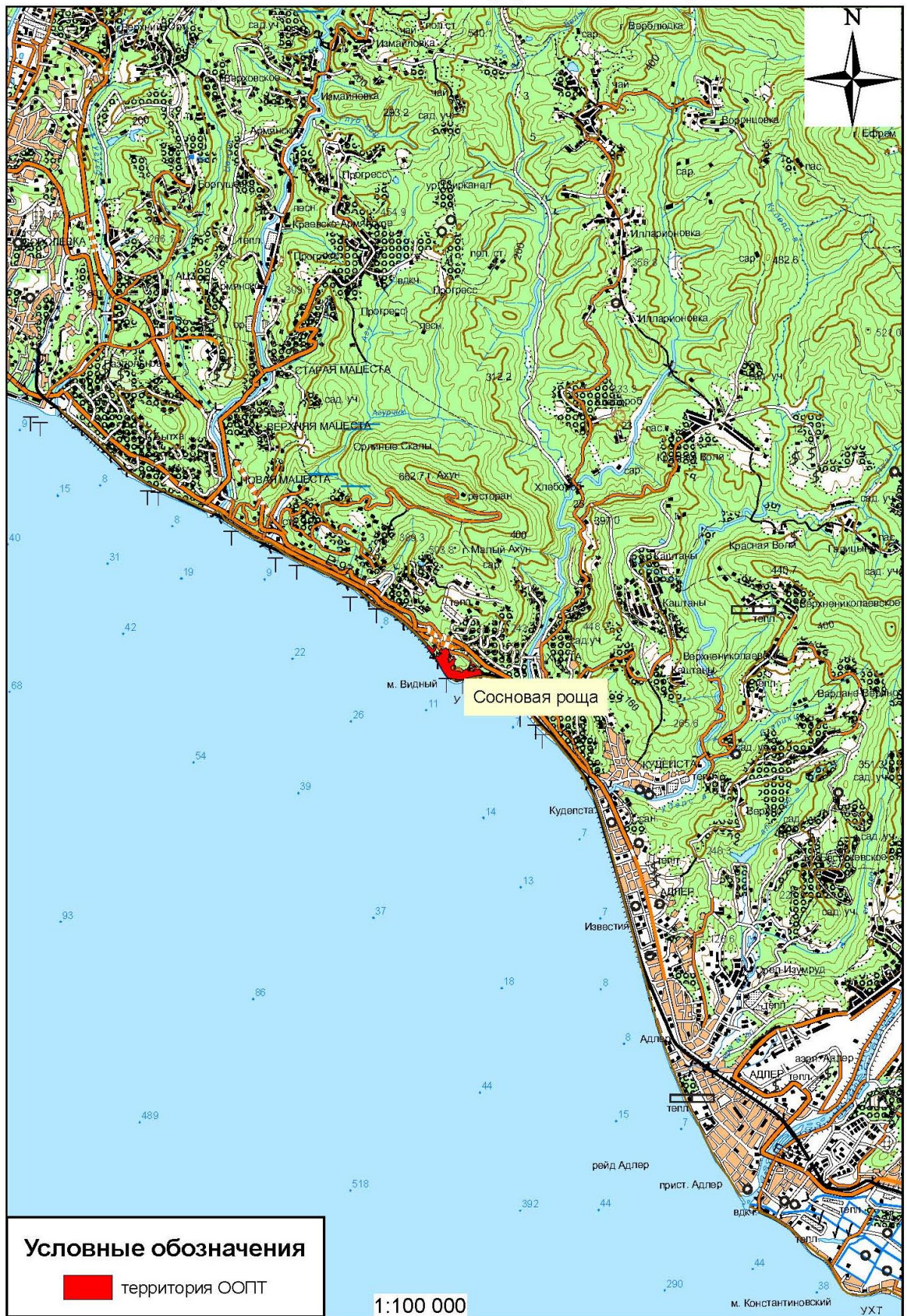
Схема расположения памятника природы «Сосновая роща»