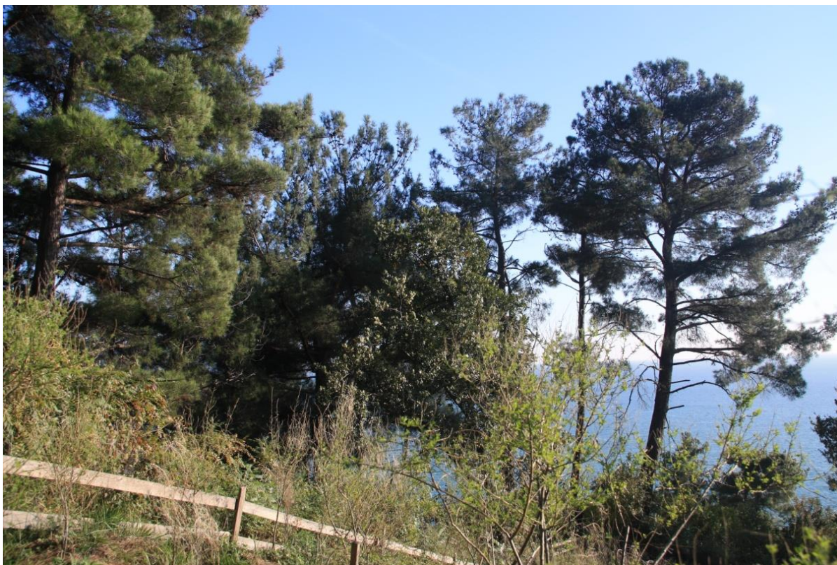
Рисунок 6 – Памятник природы «Сосновая роща»