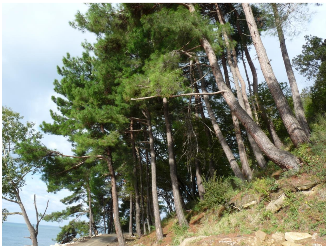
Рисунок 1 – Памятник природы «Сосновая роща»

Дополнительные материалы – фотографии памятника природы или наиболее характерных его частей, картографический материал (карты (схемы) расположения памятника природы и охранной зоны (1:100000, 1:50000), карты (схемы) памятника природы с обозначением границ (1:2000 или 1:500, в зависимости от занимаемой площади), Охранное обязательство, иные материалы.