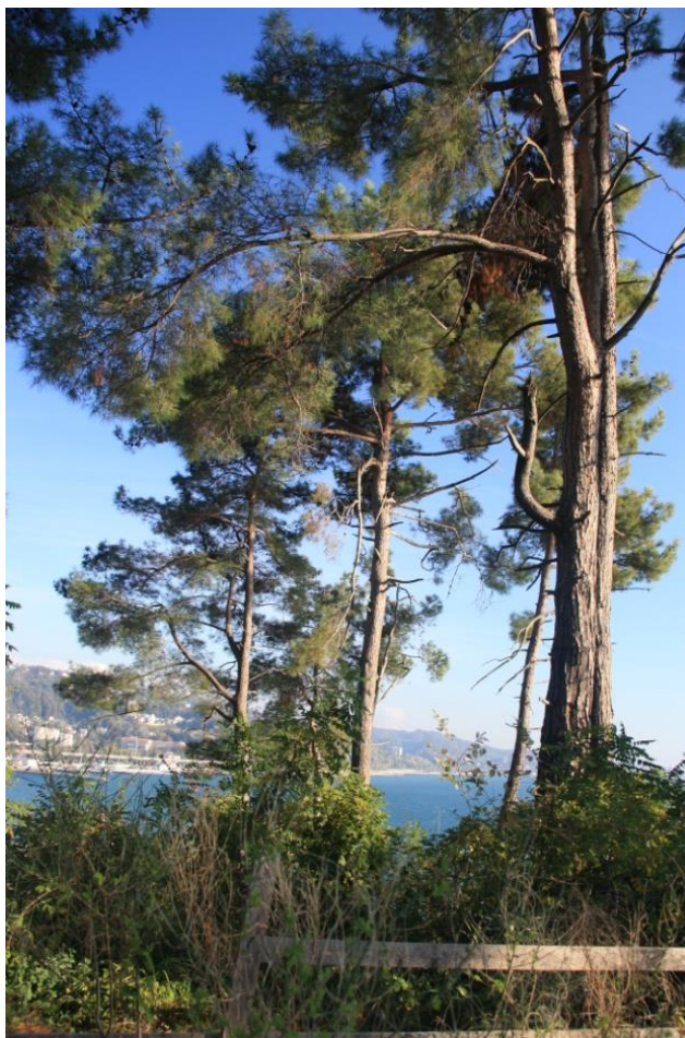
Рисунок 7 – Памятник природы «Сосновая роща»