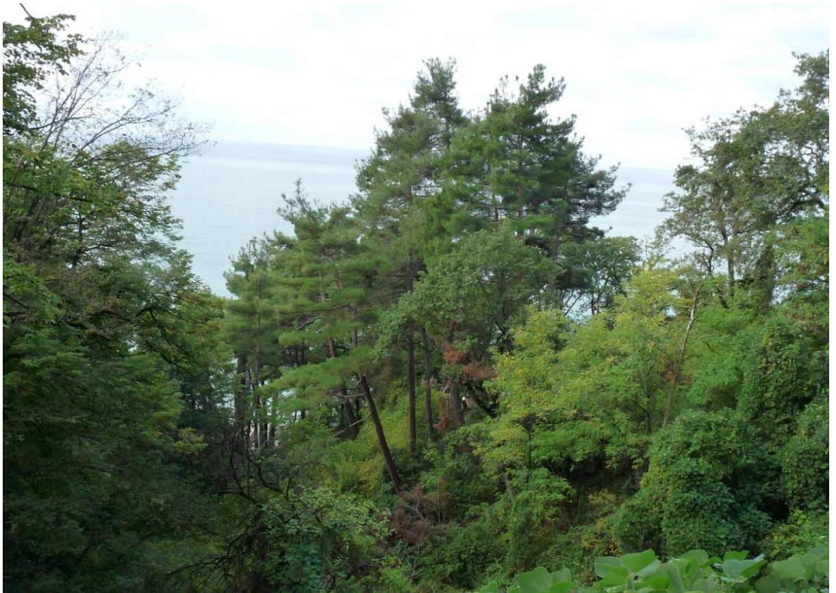
Рисунок 2 – Памятник природы «Сосновая роща»