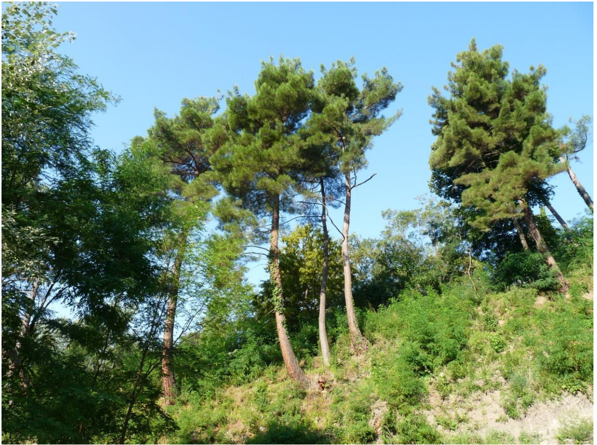
Рисунок 4 – Памятник природы «Сосновая роща»