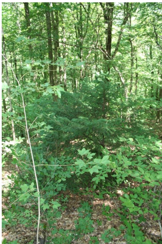
Рисунок 3 – памятник природы «Тисовая роща»