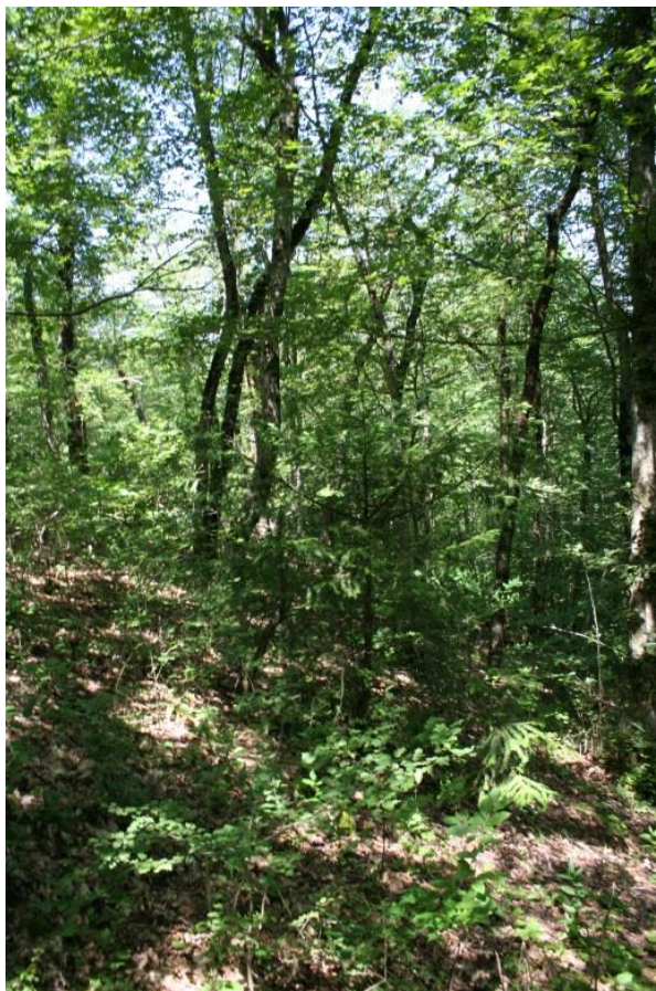
Рисунок 4 – памятник природы «Тисовая роща»