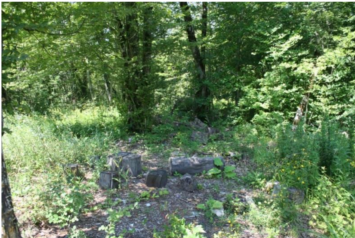
Рисунок 5 – памятник природы «Тисовая роща»