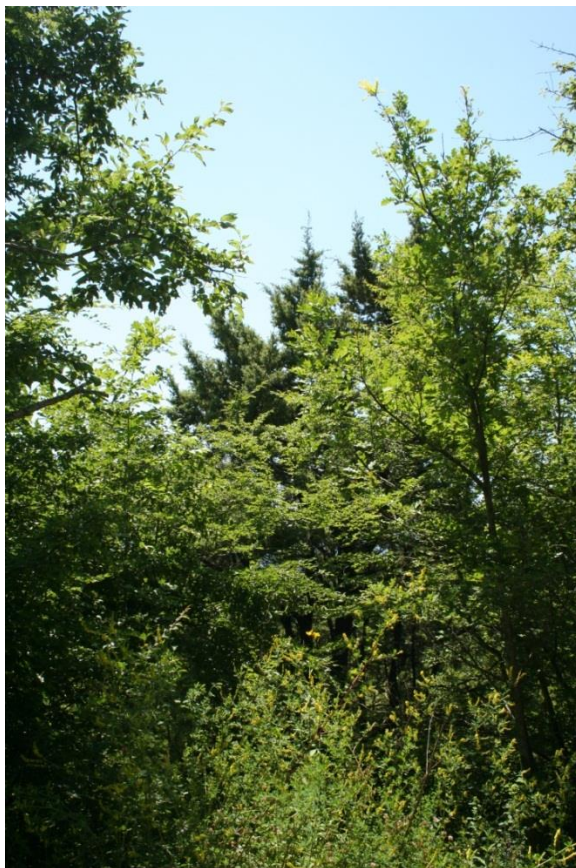
Рисунок 2 – памятник природы «Тисовая роща»