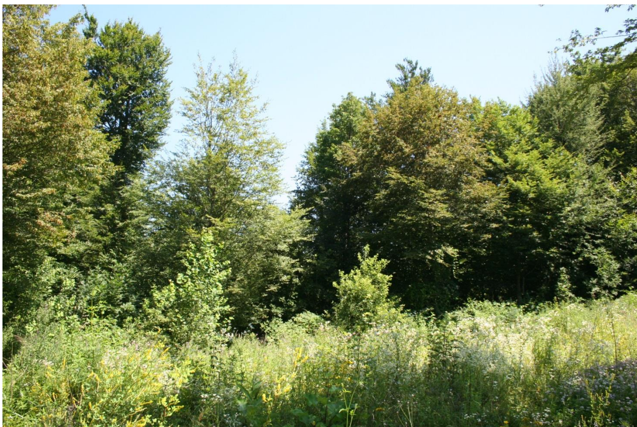
Рисунок 1 – памятник природы «Тисовая роща»

Дополнительные материалы – фотографии памятника природы или наиболее характерных его частей, картографический материал (карты (схемы) расположения памятника природы и охранной зоны (1:100000, 1:50000), карты (схемы) памятника природы с обозначением границ (1:2000 или 1:500, в зависимости от занимаемой площади), Охранное обязательство, иные материалы.