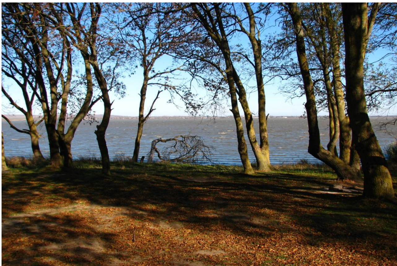
Рисунок 1 – памятник природы «Урочище Яхно»

Дополнительные материалы – фотографии памятника природы или наиболее характерных его частей, картографический материал (карты (схемы) расположения памятника природы и охранной зоны (1:100000, 1:50000), карты (схемы) памятника природы с обозначением границ (1:2000 или 1:500, в зависимости от занимаемой площади), Охранное обязательство, иные материалы.