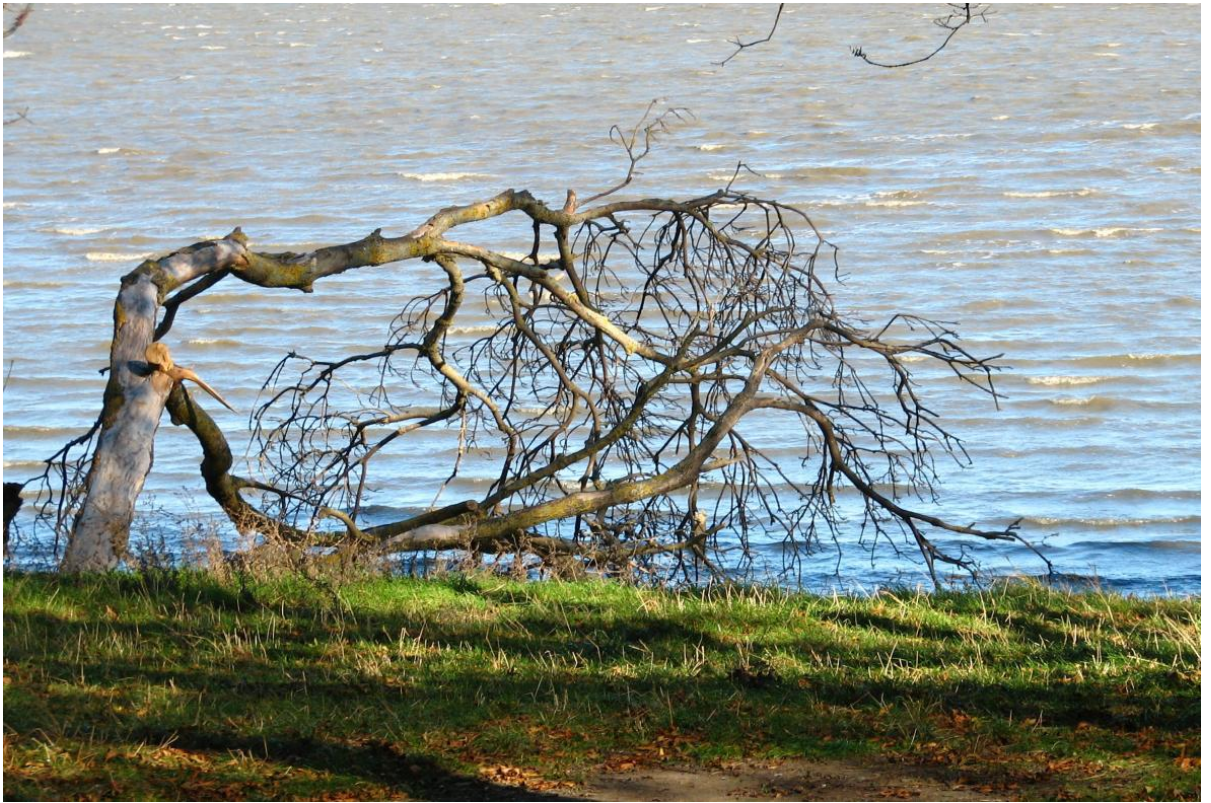
Рисунок 2 – памятник природы «Урочище Яхно»