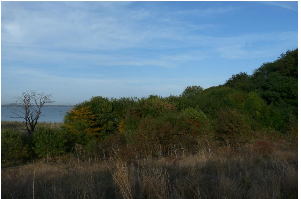
Рисунок 4 – памятник природы «Урочище Яхно»