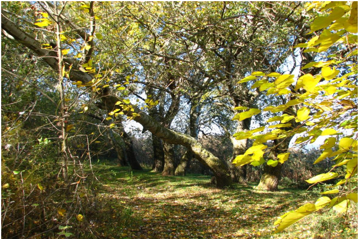
Рисунок 3 – памятник природы «Урочище Яхно»