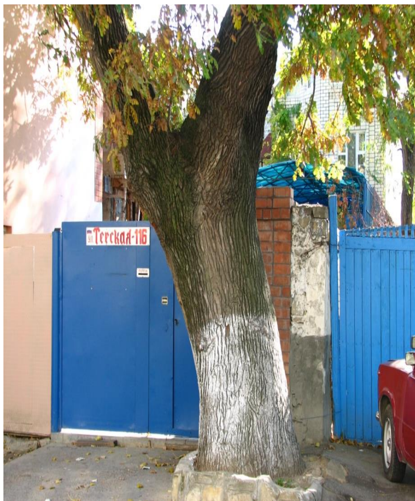
Рисунок 1 - Памятник природы «Дуб черешчатый»

Дополнительные материалы – фотографии памятника природы или наиболее характерных его частей, картографический материал (карты (схемы) расположения памятника природы и охранный зоны (1:100000, 1:50000), карты (схемы) памятника природы с обозначением границ (1:2000 или 1:500, в зависимости от занимаемой площади), Охранное обязательство, иные материалы.