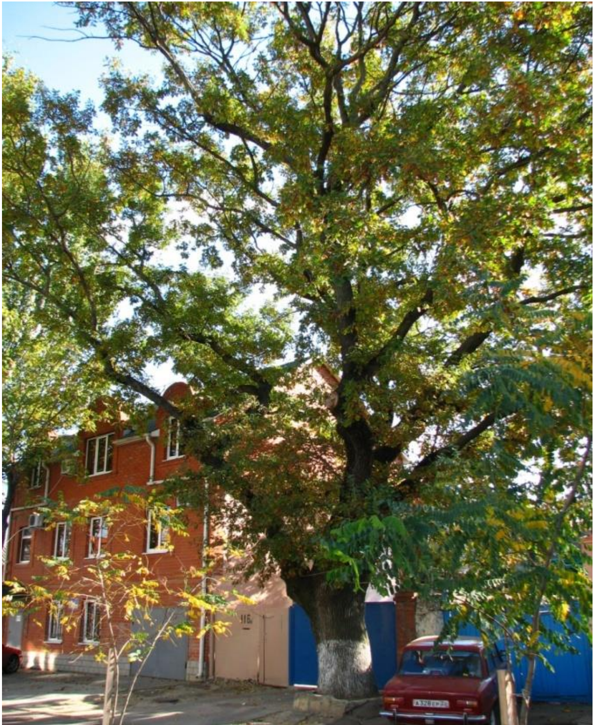
Рисунок 2 - памятник природы «Дуб черешчатый»