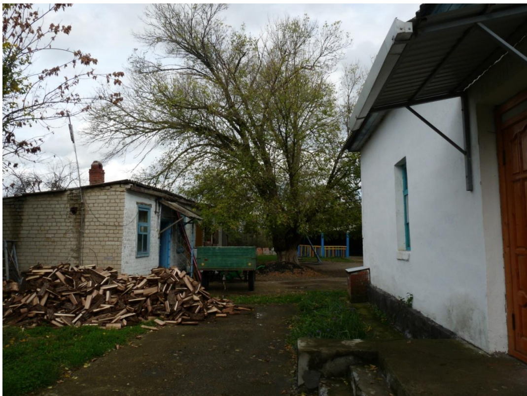
Рисунок 4 – Памятник природы «Ясень»