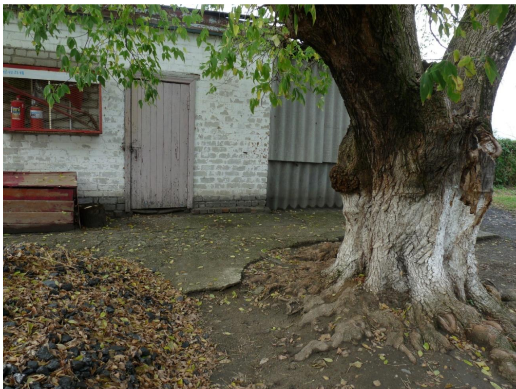
Рисунок 5– Памятник природы «Ясень»