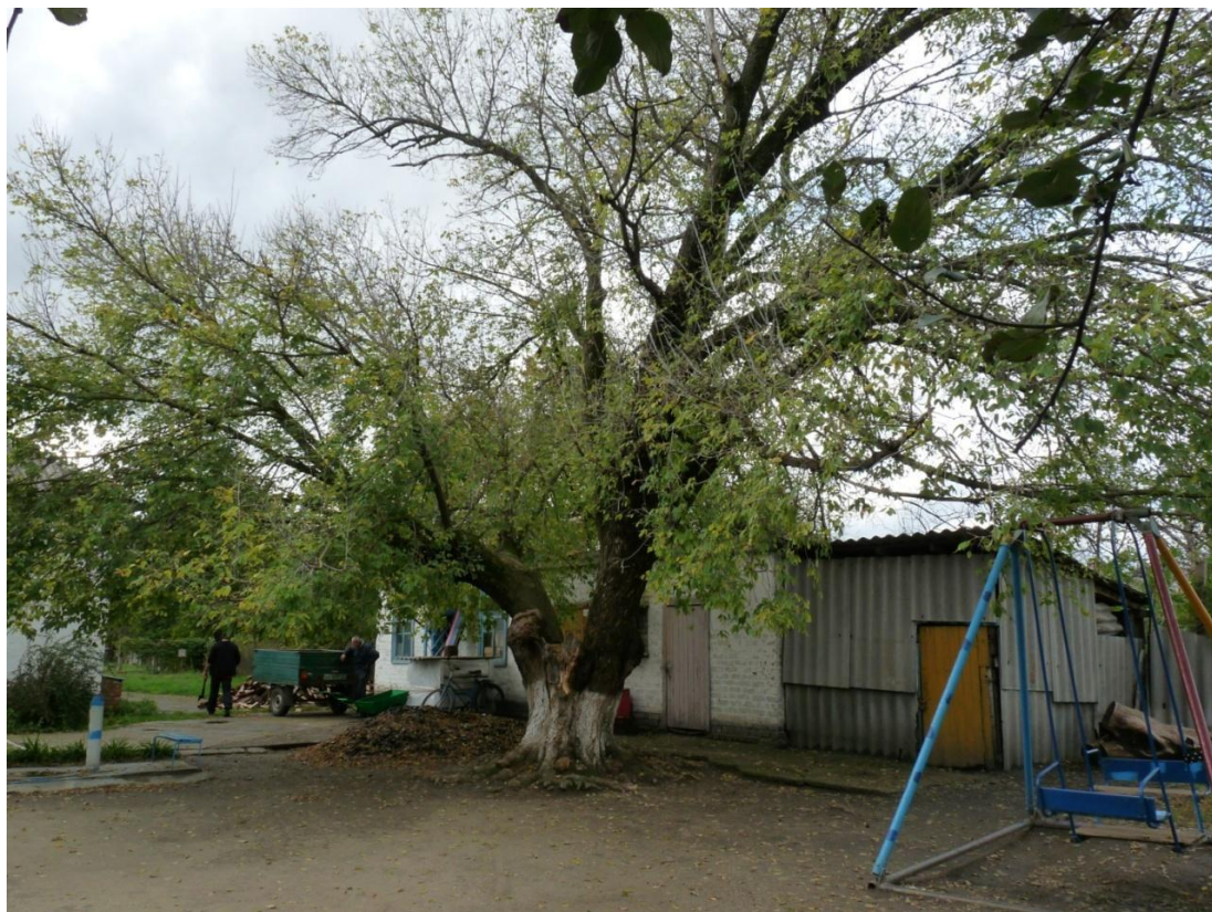
Рисунок 6 – Памятник природы «Ясень»