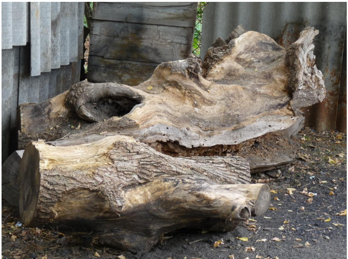
Рисунок 3– Памятник природы «Ясень»