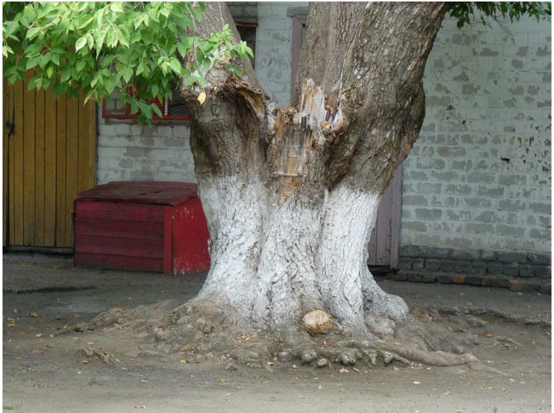
Рисунок 2 – Памятник природы «Ясень»