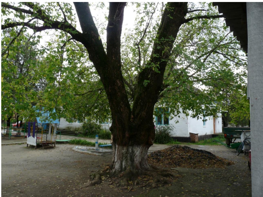
Рисунок 9 – Памятник природы «Ясень»