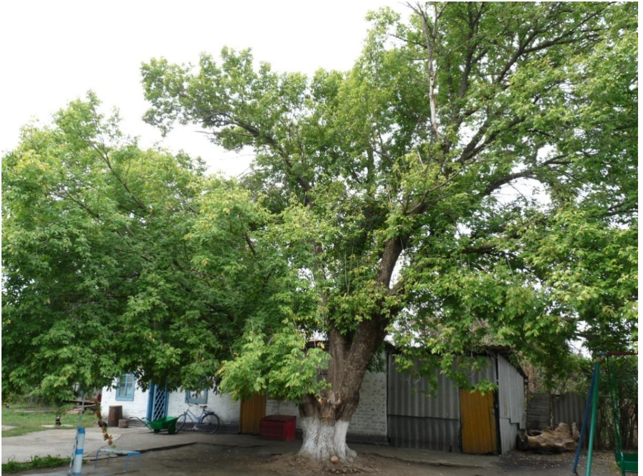
Рисунок 1 – Памятник природы «Ясень»

Дополнительные материалы – фотографии памятника природы или наиболее характерных его частей, картографический материал (карты (схемы) расположения памятника природы и охранный зоны (1:100000, 1:50000), карты (схемы) памятника природы с обозначением границ (1:2000 или 1:500, в зависимости от занимаемой площади), Охранное обязательство, иные материалы.