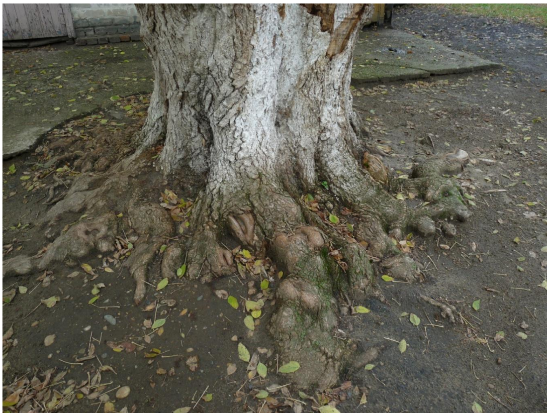
Рисунок 7 – Памятник природы «Ясень»