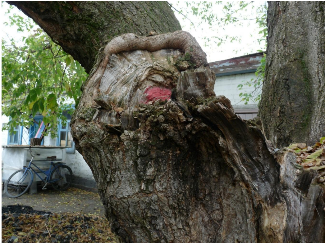
Рисунок 8— Памятник природы «Ясень»