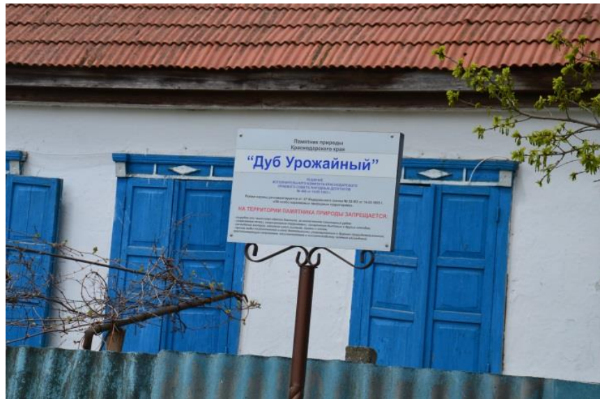
Рисунок 1. Памятник природы «Дуб Урожайный»

Фотографии памятника природы регионального значения: