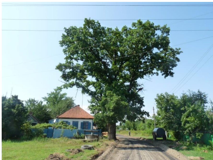
Рисунок 2. Памятник природы «Дуб Урожайный»