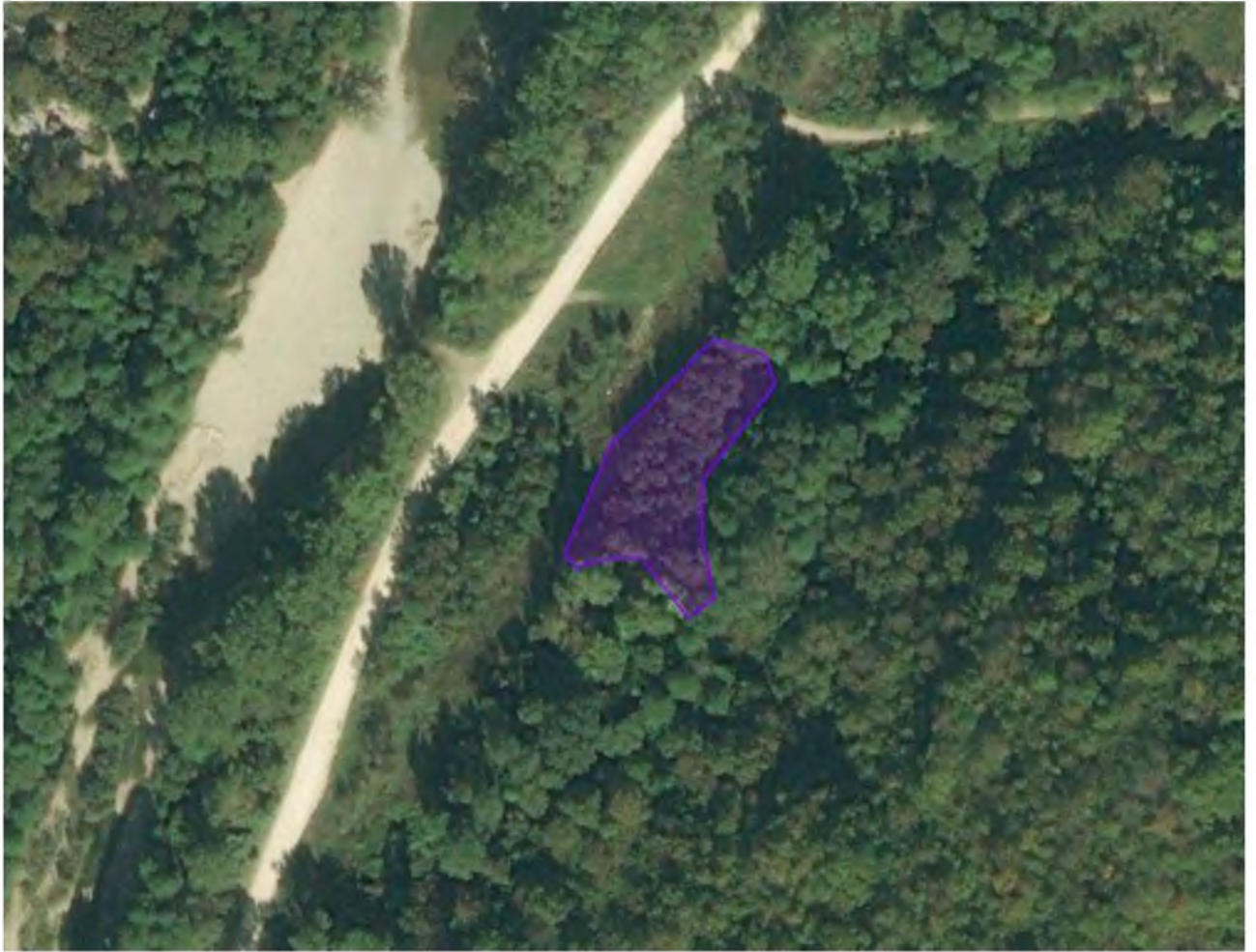
Ситуационный план памятника природы «Роща болотного кипариса»

Начальник управления охраны окружающей среды