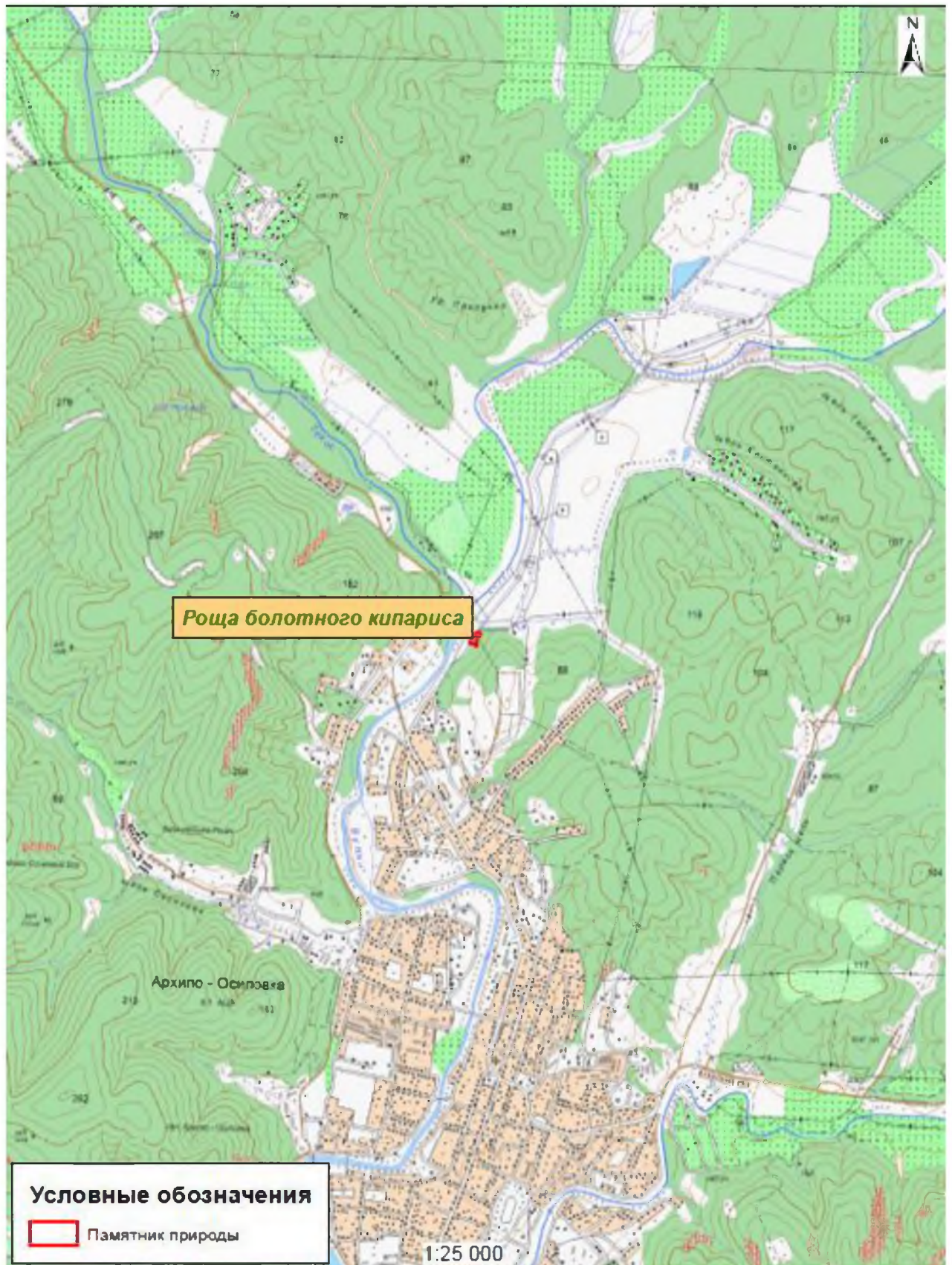
Карта-схема памятника природы «Ро́ща болотного кипариса»

Картографические материалы с нанесенными границами памятника природы регионального значения: