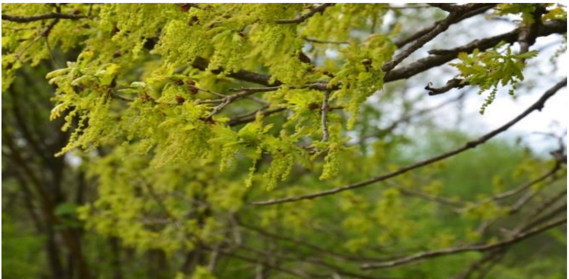
Рисунок 2. Памятник природы «Дуб Красивый»