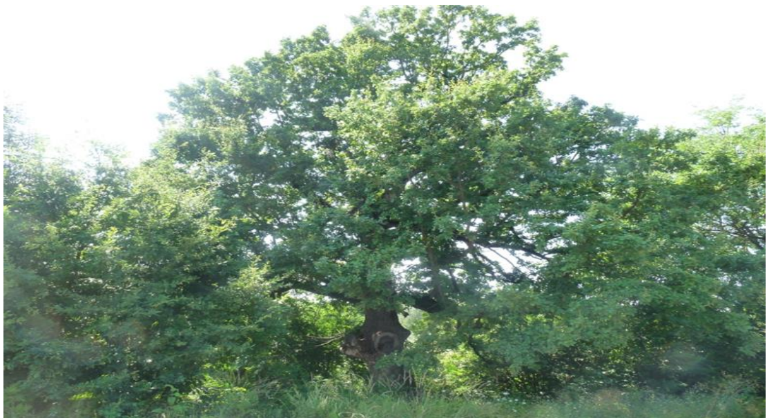
Рисунок 1. Памятник природы «Дуб Красивый»

Фотографии памятника природы регионального значения: