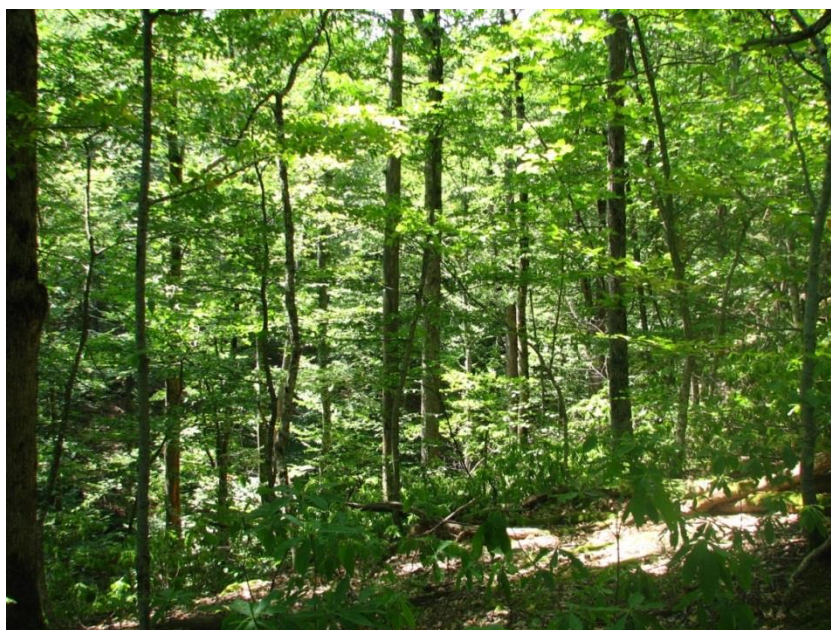
Рисунок 1. Памятник природы «Массив дуба скального высокоствольного»

Фотографии памятника природы регионального значения: