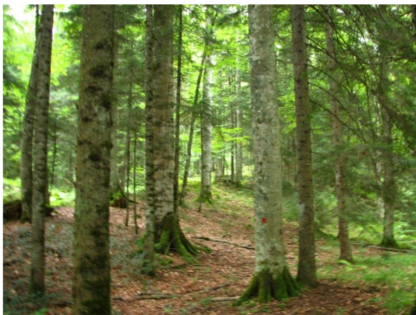
Рисунок 1. Памятник природы «Насаждение бука восточного»

Фотографии памятника природы регионального значения: