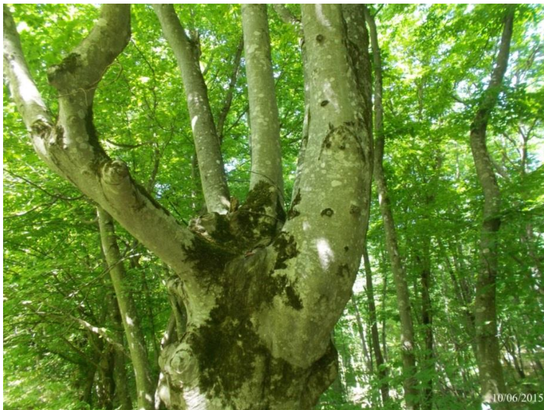
Рисунок 3. Памятник природы «Насаждение бука восточного»