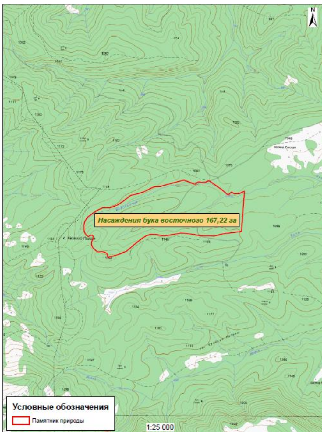
Карта-схема памятника природы «Насажение бука восточного»

Картографические материалы с нанесенными границами памятника природы регионального значения: