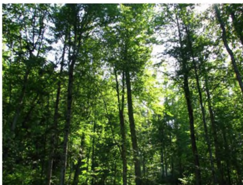
Рисунок 1. Памятник природы «Насаждение бука восточного»

Фотографии памятника природы регионального значения: