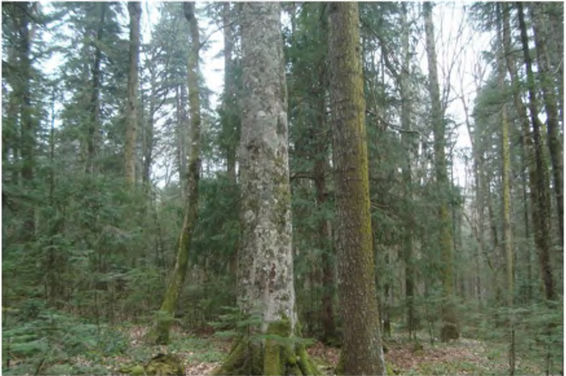
Рисунок 4. Памятник природы «Насаждение бука восточного»