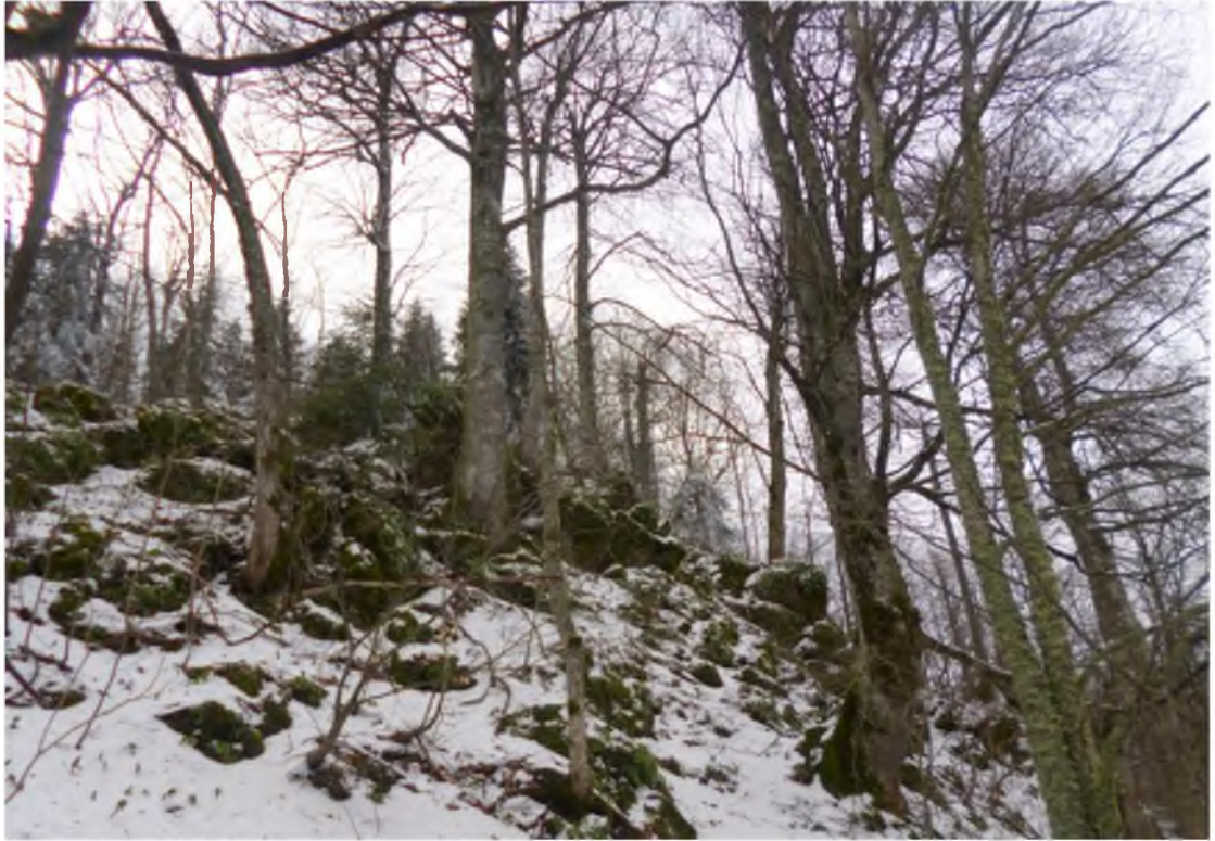
Рисунок 3. Памятник природы «Насаждение бука восточного»