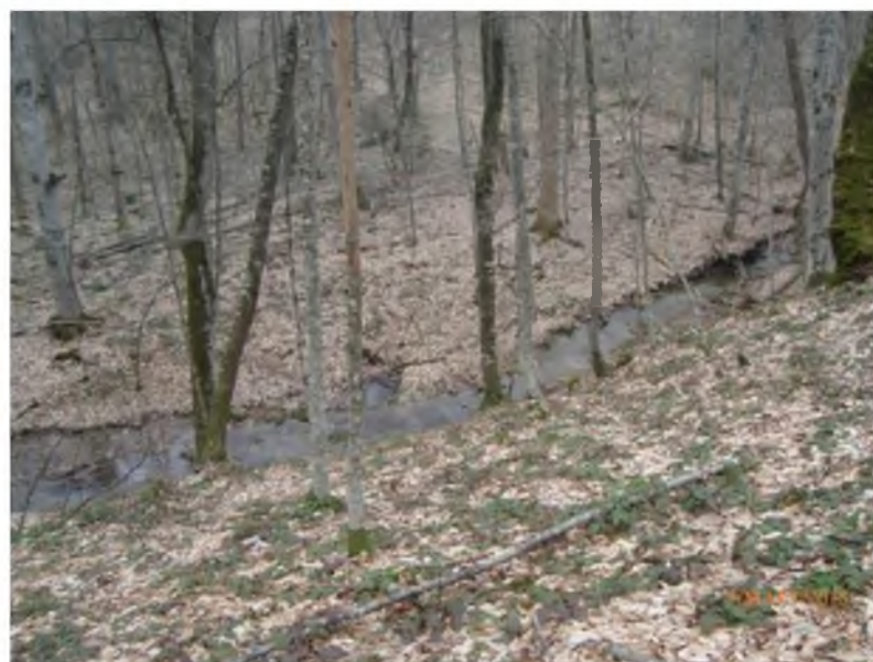
Рисунок 2. Памятник природы «Насаждение бука восточного»