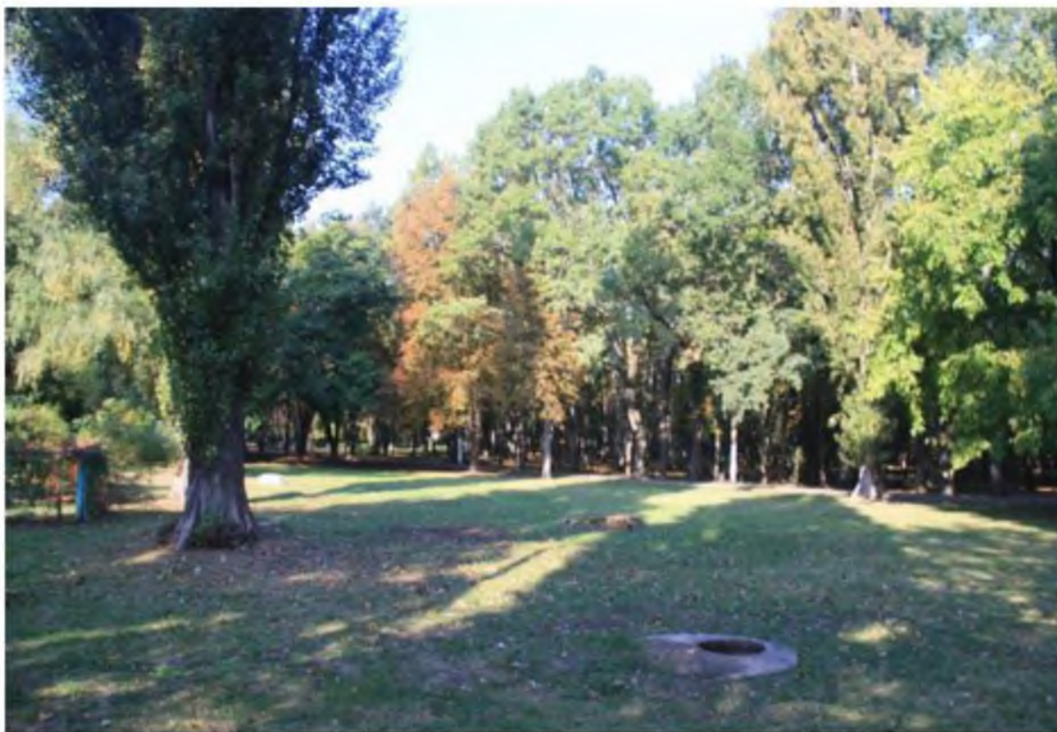
Рисунок 8.Памятник природы «Парк Солнечный остров»