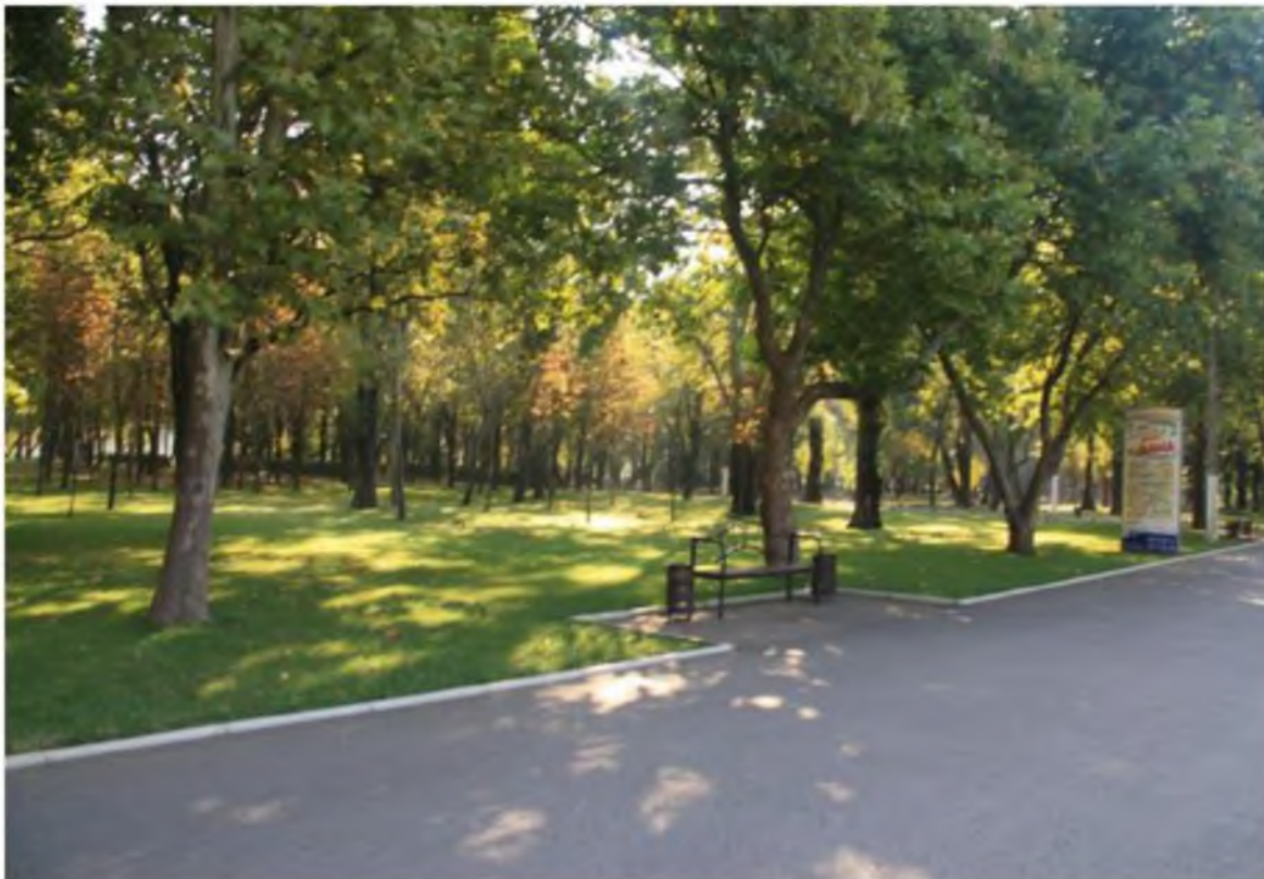
Рисунок 5.Памятник природы «Парк Солнечный остров»