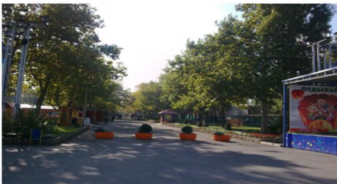
Рисунок 1.Памятник природы «Парк Солнечный остров»

Фотографии памятника природы регионального значения: