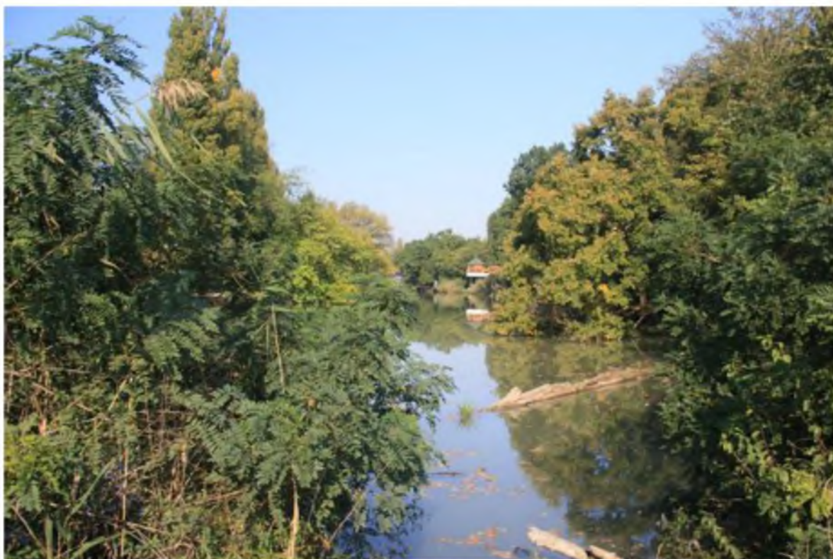
Рисунок 6.Памятник природы «Парк Солнечный остров»