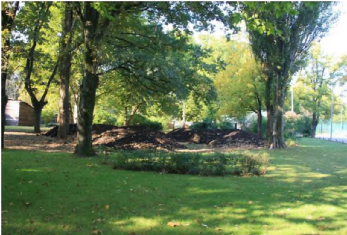
Рисунок 7.Памятник природы «Парк Солнечный остров»