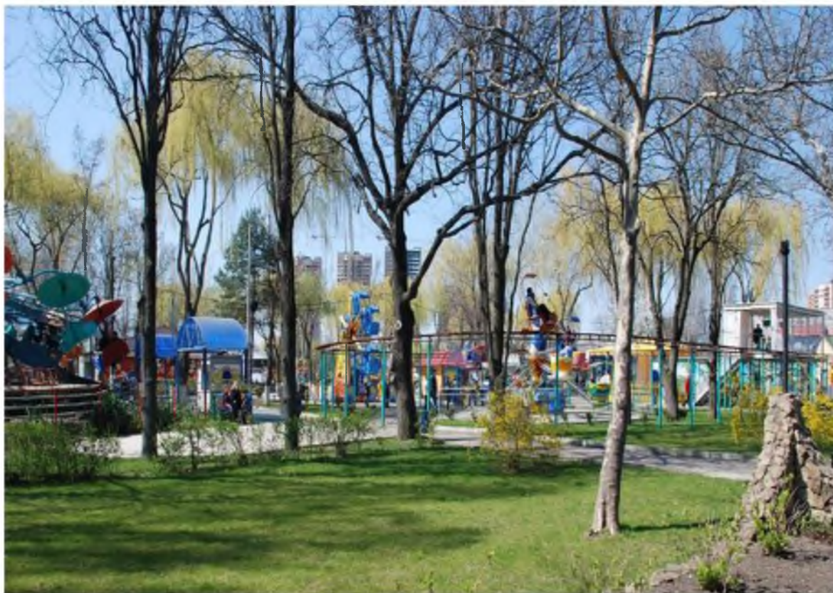
Рисунок 3.Памятник природы «Парк Солнечный остров»