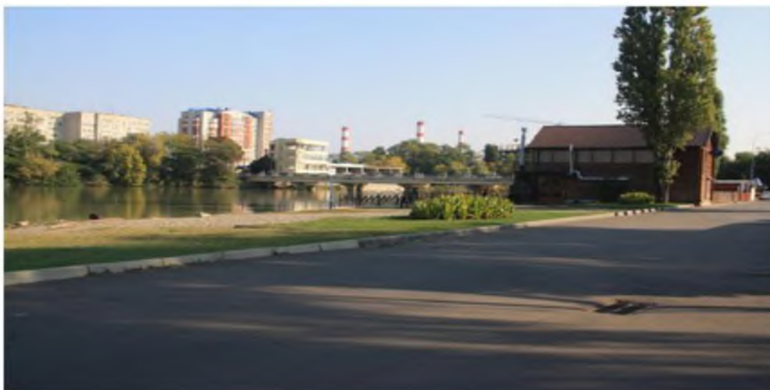
Рисунок 2.Памятник природы «Парк Солнечный остров»