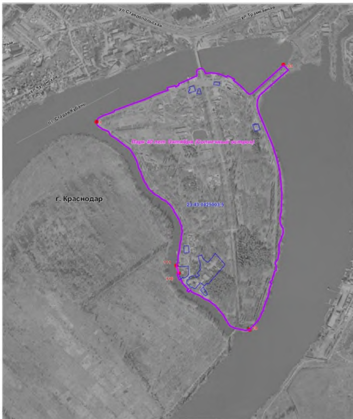
Карта-схема № 2. памятника природы «Парк Солнечный остров»

Начальник управления охраны окружающей среды