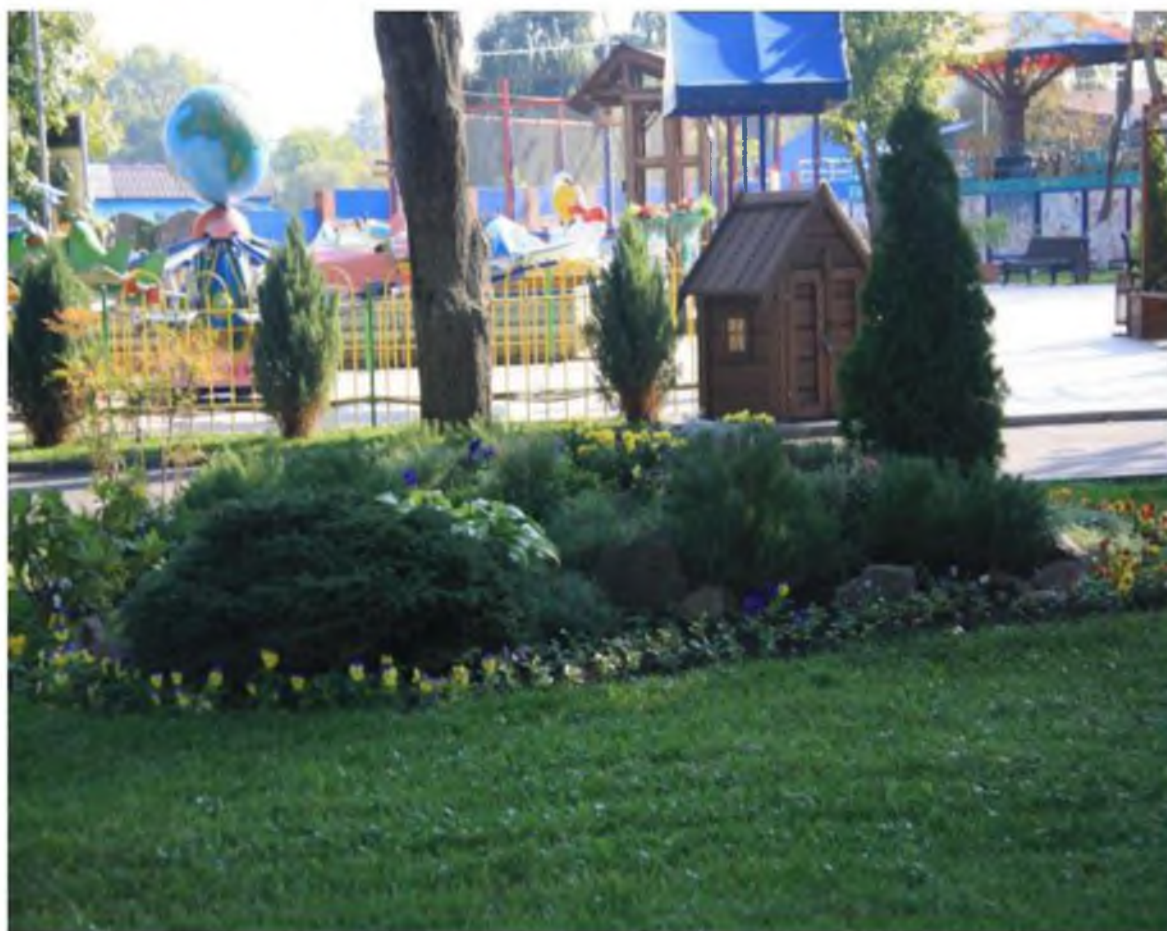
Рисунок 4.Памятник природы «Парк Солнечный остров»