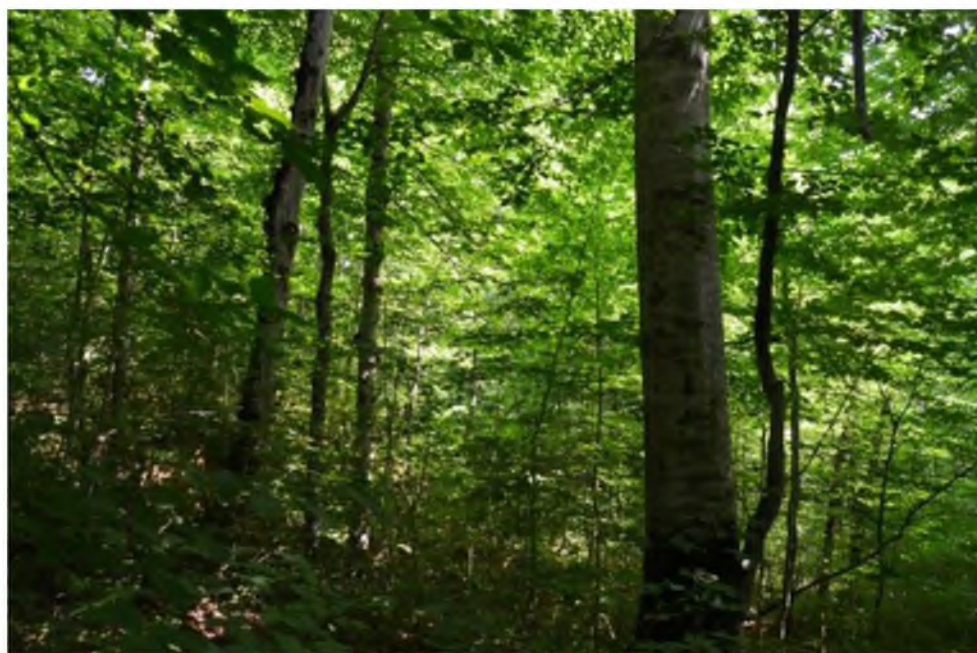
Рисунок 4. Памятник природы «Урочище Черниговское»