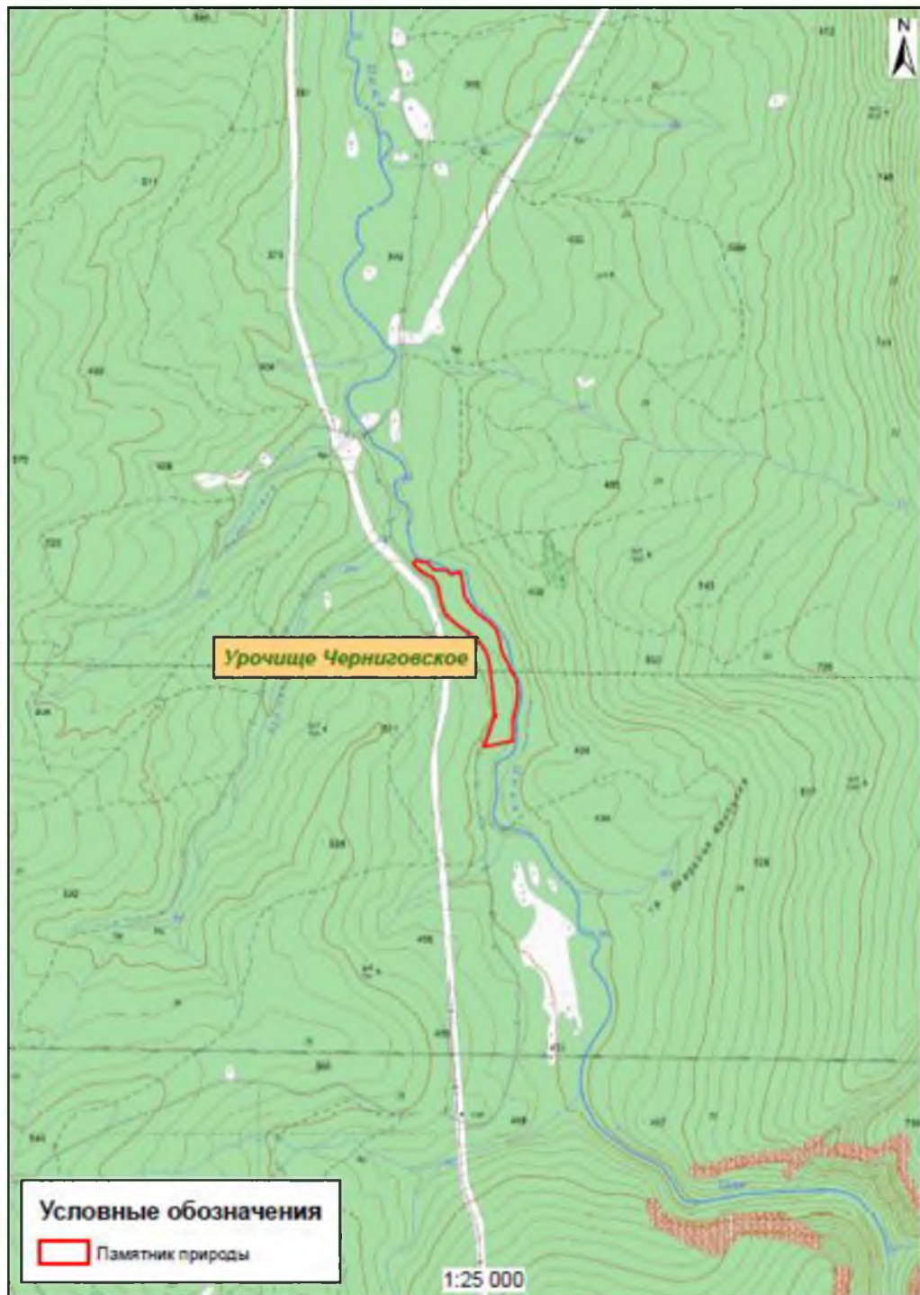
Карта-схема памятника природы «Урочище Черниговское»

Картографические материалы с нанесенными границами памятника природы регионального значения: