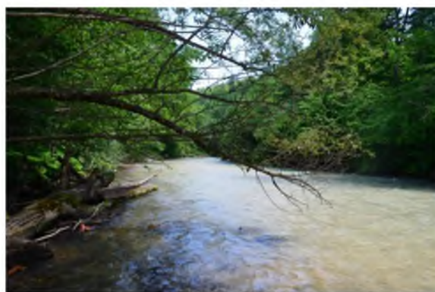
Рисунок 1. Грунтовая дорога и река Цица в районе памятника природы «Урочище Черниговское»