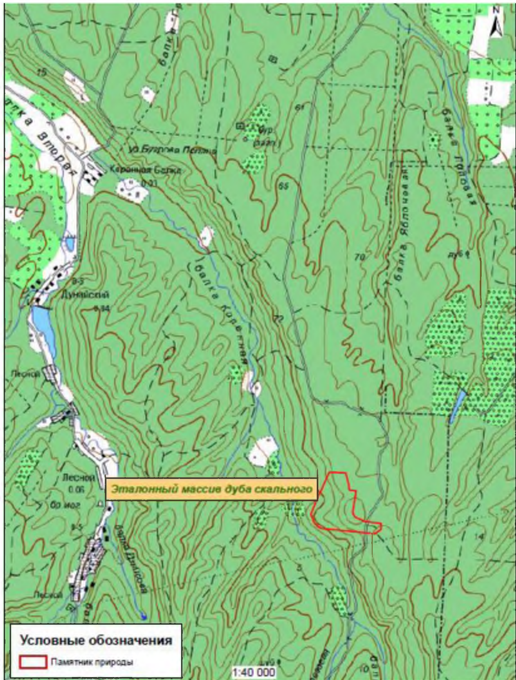
Карта-схема памятника природы «Эталонный массив дуба скального»

Картографические материалы с нанесенными границами памятника природы регионального значения: