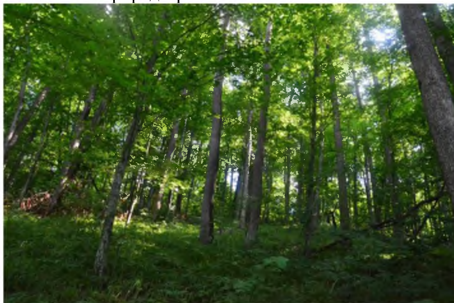
Рисунок 1. Памятник природы «Эталонный массив дуба скального»

Фотографии памятника природы регионального значения: