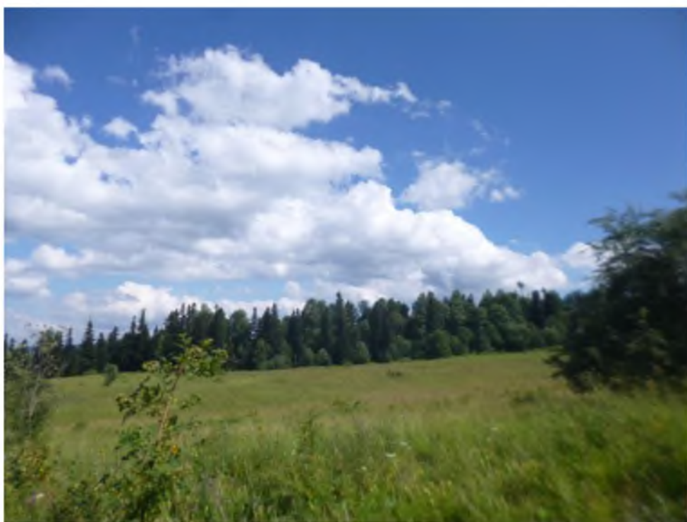
Рисунок 4. Памятник природы «Пихтовые насаждения»