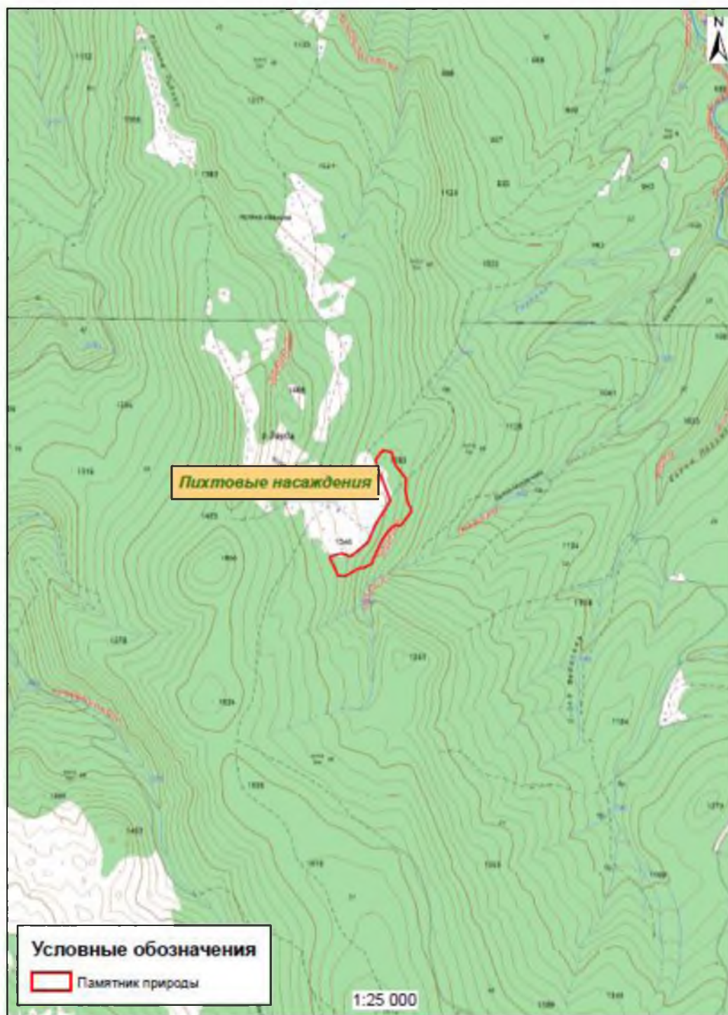
Карта-схема памятника природы «Пихтовые насаждения»

Картографические материалы с нанесенными границами памятника природы регионального значения: