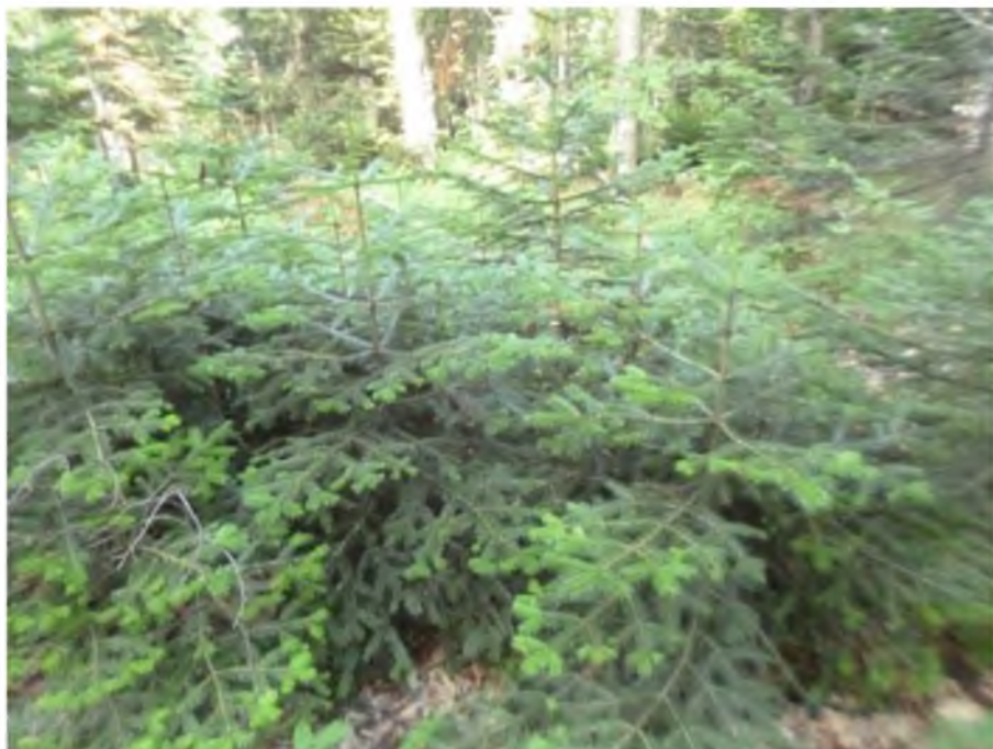
Рисунок 3. Территория памятника природы «Пихтовые насаждения»