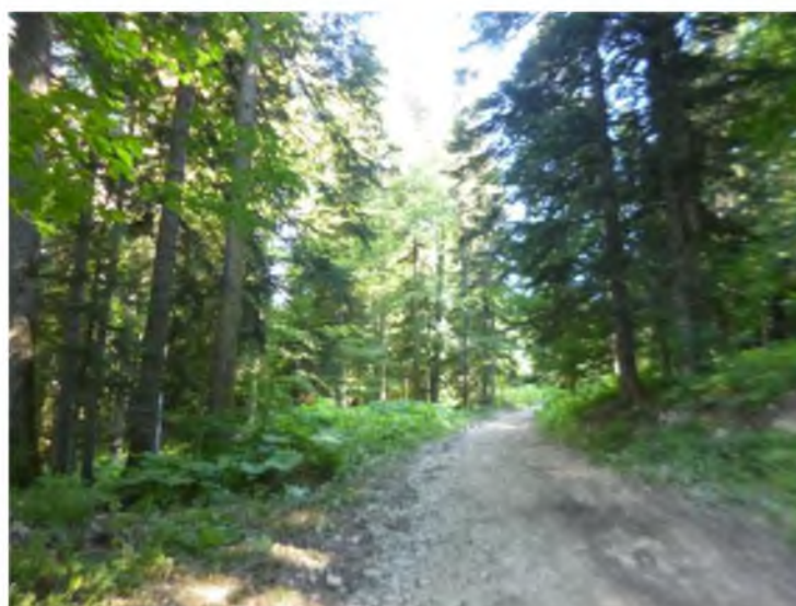
Рисунок 1. Памятник природы «Пихтовые насаждения»

Фотографии памятника природы регионального значения: