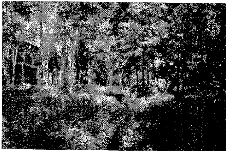
Рисунок 6. Памятник природы «Ремизный участок № 2»