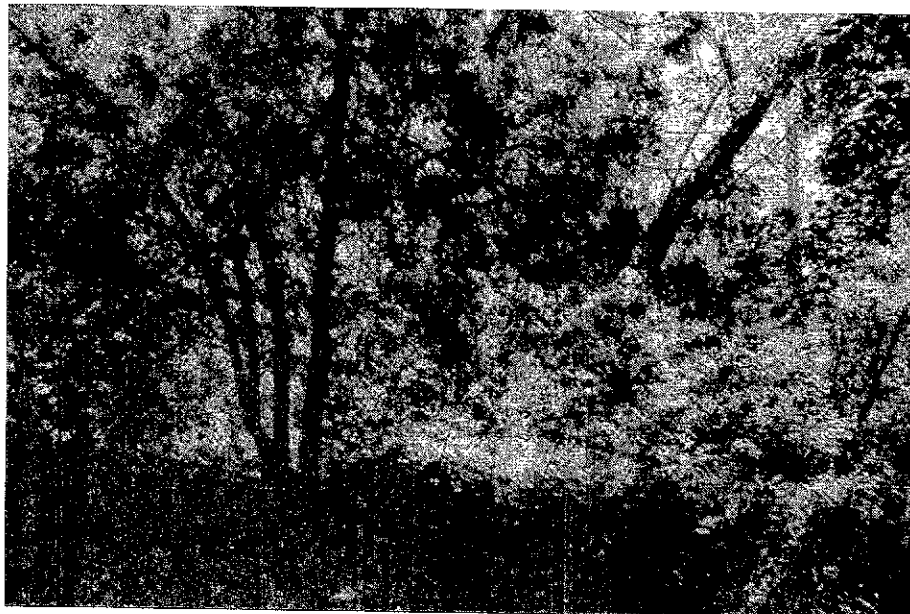
Рисунок 2. Памятник природы «Ремизный участок № 2»