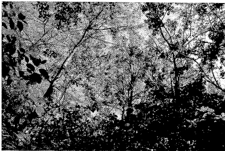
Рисунок 3. Памятник природы «Ремизный участок № 2»