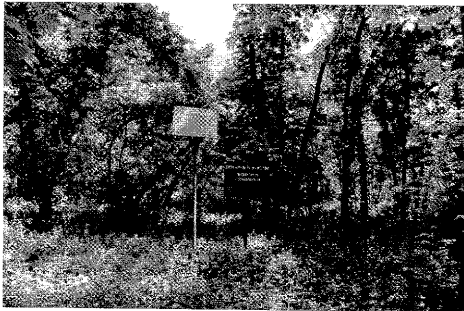
Рисунок 1. Памятник природы «Ремизный участок № 2»