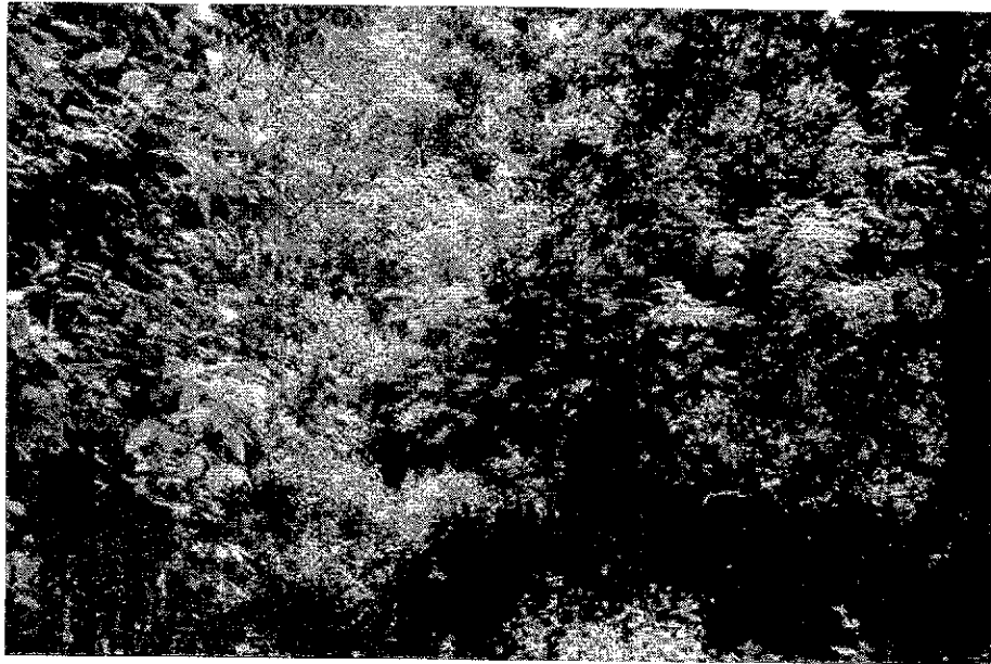
Рисунок 5. Памятник природы «Ремизный участок № 2»