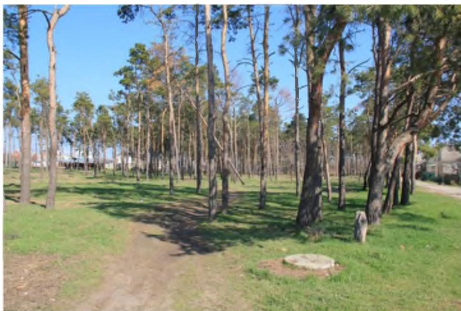
Рисунок 1. Памятник природы «Сосновая роща «Северная»

Фотографии памятника природы регионального значения: