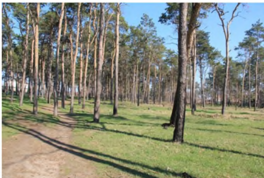
Рисунок 2. Памятник природы «Сосновая роща «Северная»