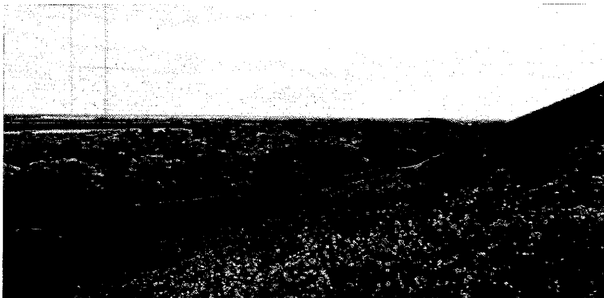
Фото 2. Памятник природы «Высокий берег реки Кубань»