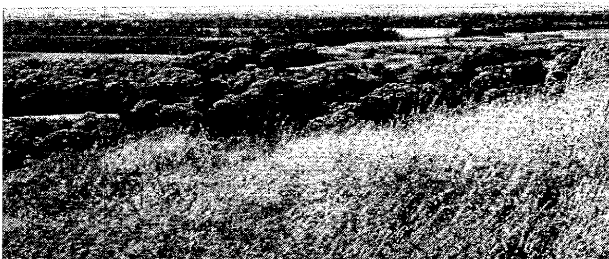
Фото 1. Памятник природы «Высокий берег реки Кубань»

Фотографии памятника природы регионального значения: