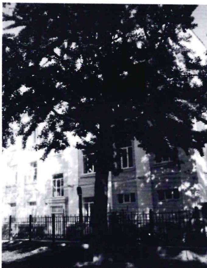
Рисунок 3 - Памятник природы «Дерево гинкго двулопастный»