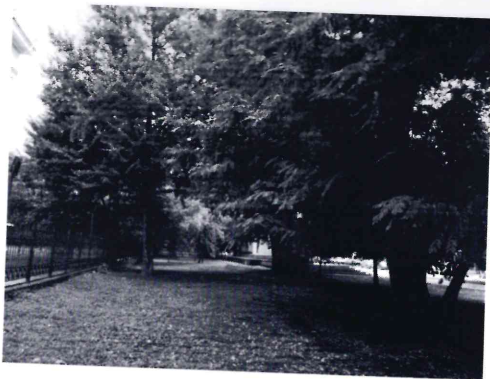
Рисунок 8 - Памятник природы «Дерево гинкго двулопастный»