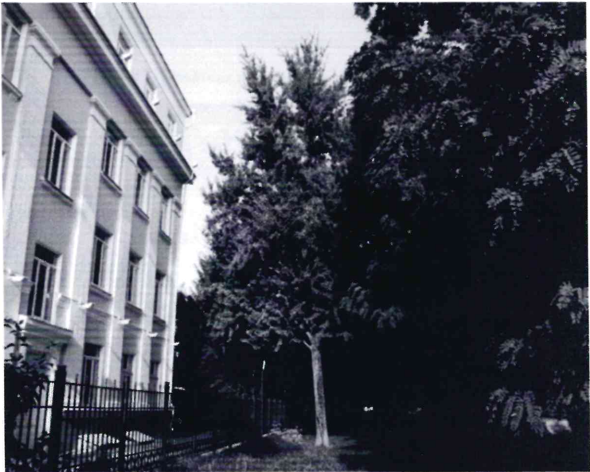
Рисунок 1 - Памятник природы «Дерево гинкго двулопастный»

Дополнительные материалы – фотографии памятника природы или наиболее характерных его частей, картографический материал (карты (схемы) расположения памятника природы и охранной зоны (1:100000, 1:50000), карты (схемы) памятника природы с обозначением границ (1:2000 или 1:500, в зависимости от занимаемой площади), Охранное обязательство, иные материалы.