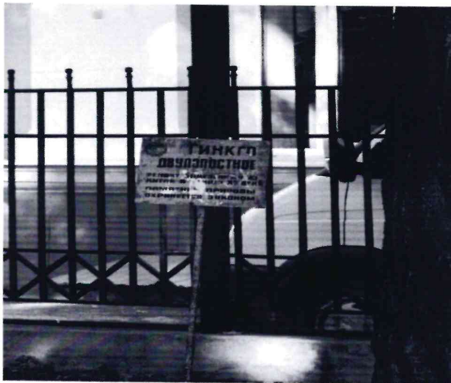
Рисунок 2 - Памятник природы «Дерево гинкго двулопастный»