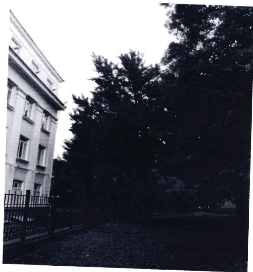
Рисунок 9 - Памятник природы «Дерево гинкго двулопастный»