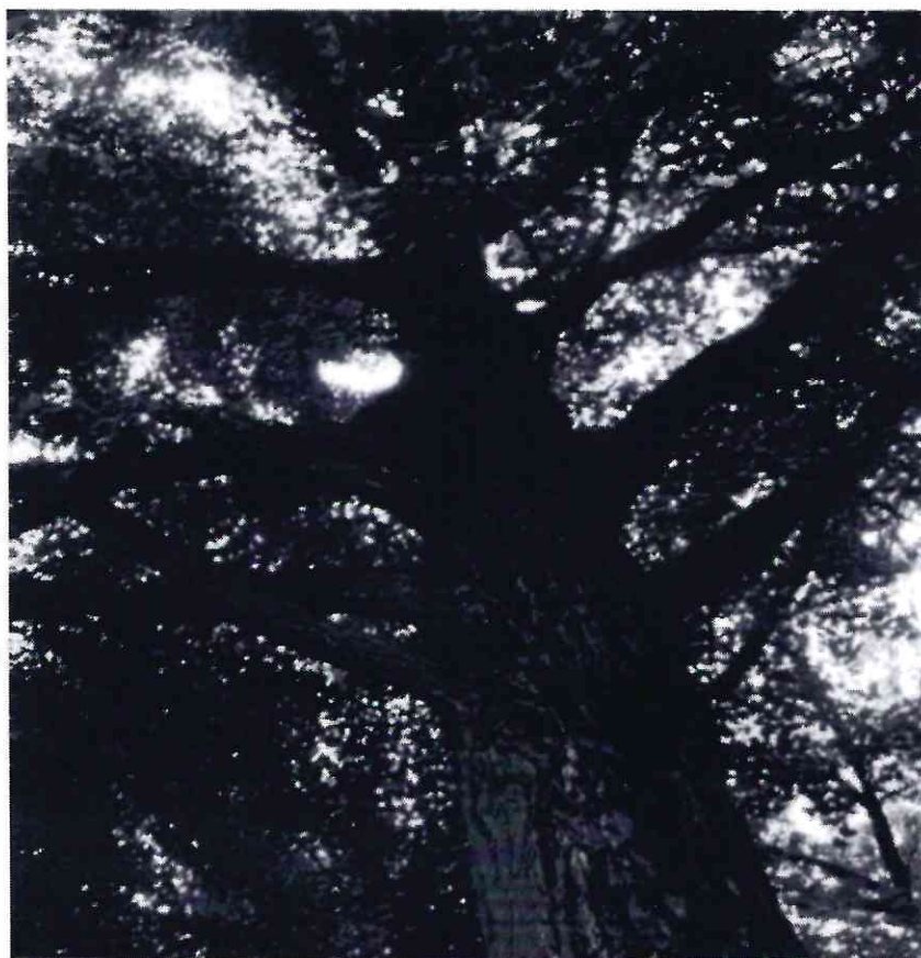
Рисунок 6 - Памятник природы «Дерево гинкго двулопастный»