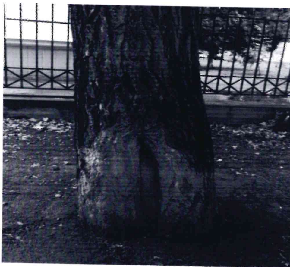
Рисунок 5 - Памятник природы «Дерево гинкго двулопастный»