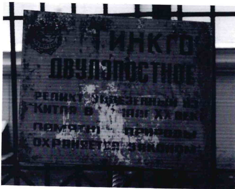
Рисунок 4 - Памятник природы «Дерево гинкго двулопастный»