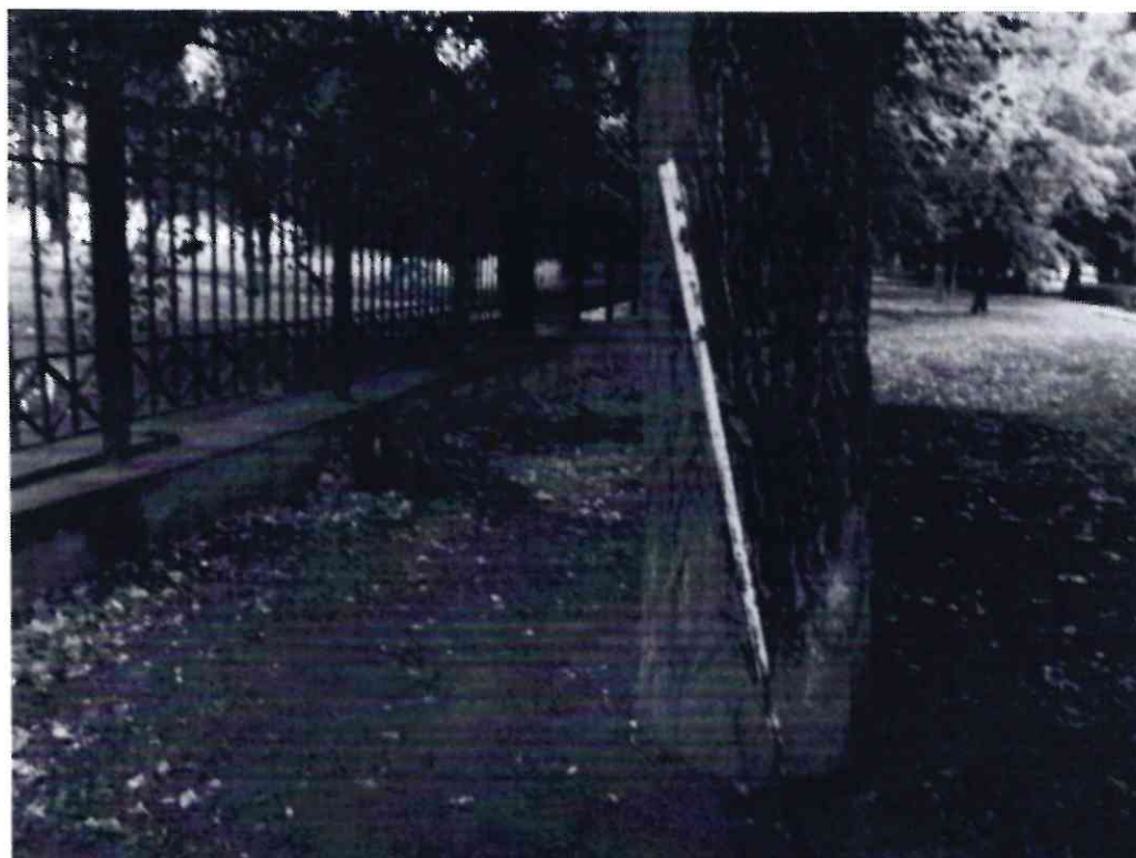
Рисунок 7 - Памятник природы «Дерево гинкго двулопастный»