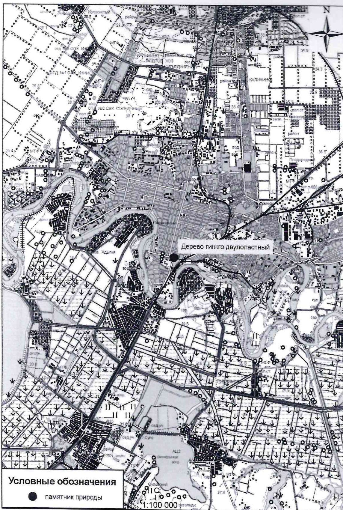
Схема расположения памятника природы «Дерево гинкго двулопастный»