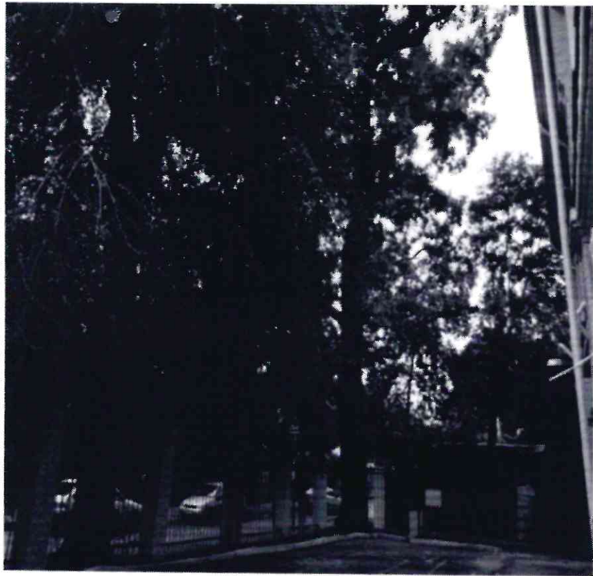
Рисунок 4 - Памятник природы «Дуб Кудрявый»