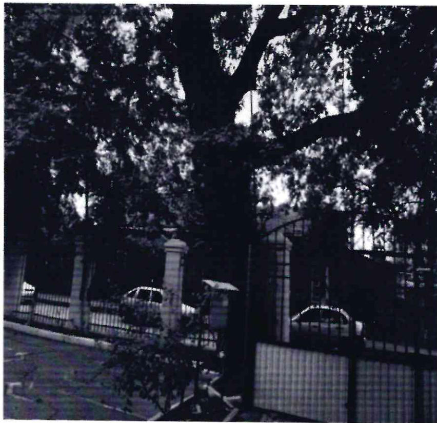
Рисунок 2- Памятник природы «Дуб Кудрявый»