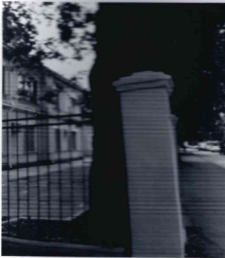
Рисунок 8 - Памятник природы «Дуб Кудрявый»