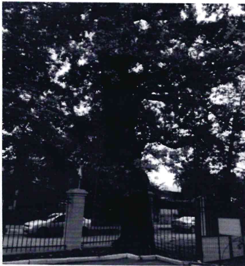
Рисунок 7 - Памятник природы «Дуб Кудрявый»