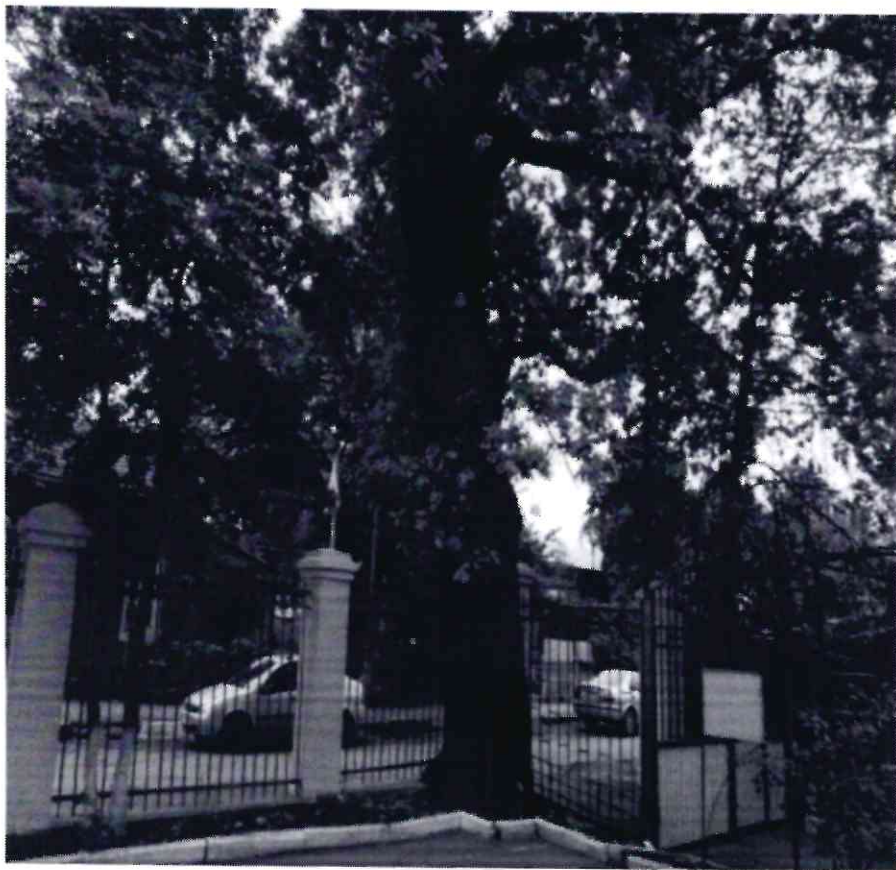
Рисунок 5 - Памятник природы «Дуб Кудрявый»