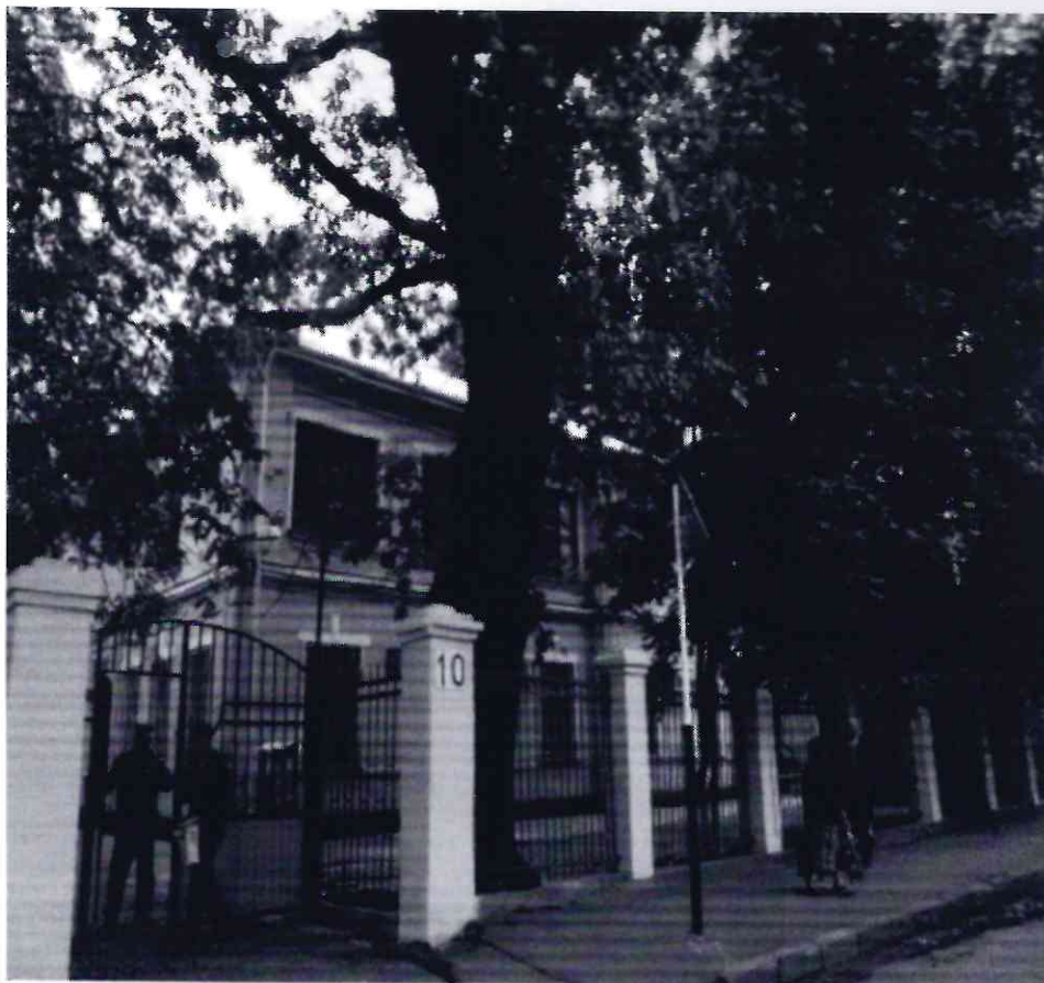
Рисунок 10 - Памятник природы «Дуб Кудрявый»