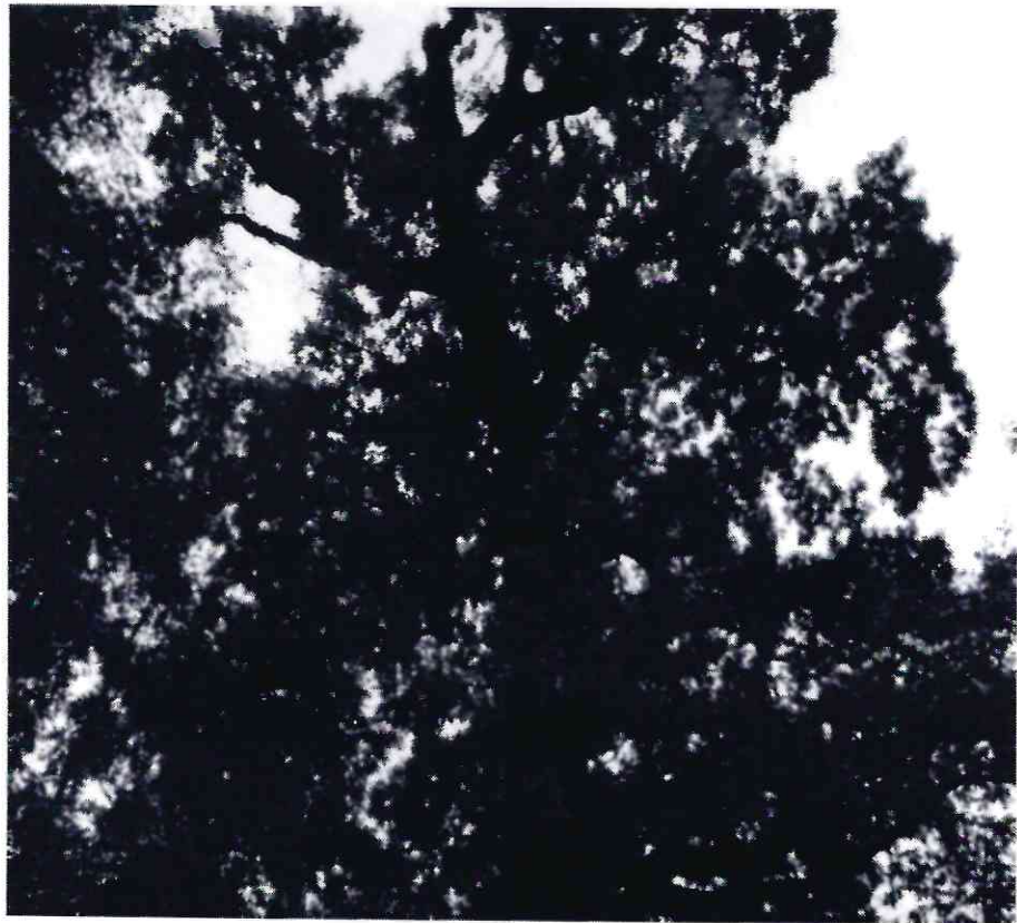
Рисунок 6 - Памятник природы «Дуб Кудрявый»