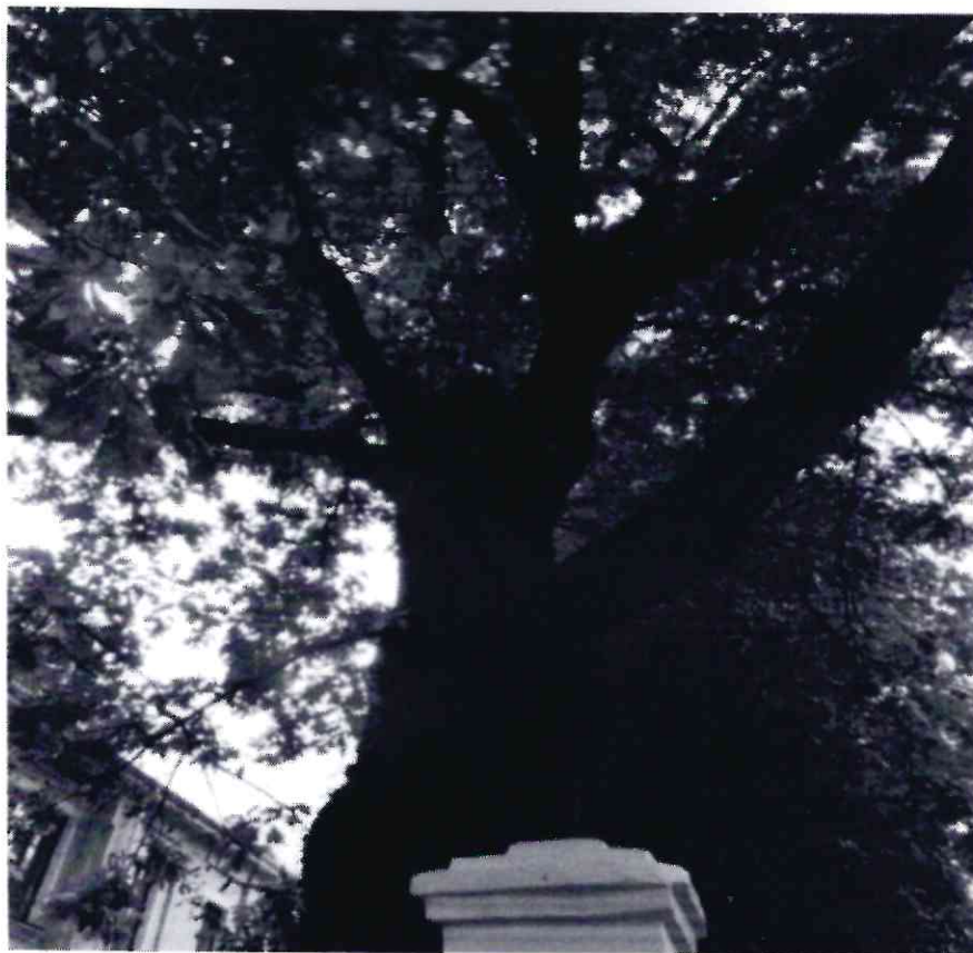
Рисунок 9 - Памятник природы «Дуб Кудрявый»