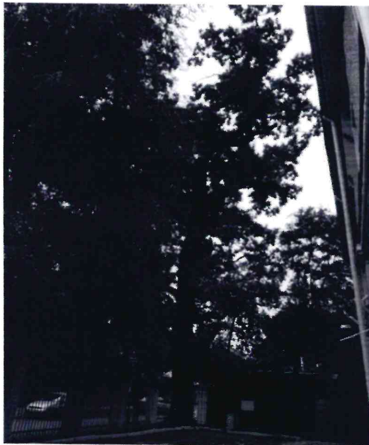
Рисунок 3 - Памятник природы «Дуб Кудрявый»