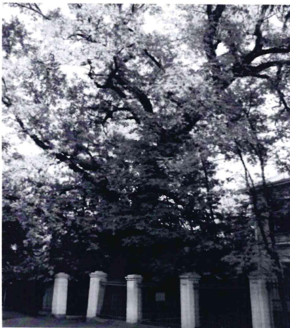
Рисунок 1 - Памятник природы «Дуб Кудрявый»

Дополнительные материалы – фотографии памятника природы или наиболее характерных его частей, картографический материал (карты (схемы) расположения памятника природы и охранной зоны (1:100000, 1:50000), карты (схемы) памятника природы с обозначением границ (1:2000 или 1:500, в зависимости от занимаемой площади), Охранное обязательство, иные материалы.