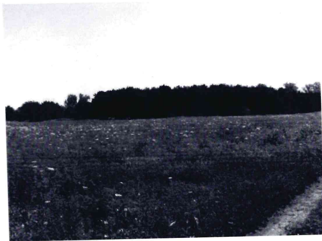
Рисунок 3 - Памятник природы «Лесопарк «Юбилейный»