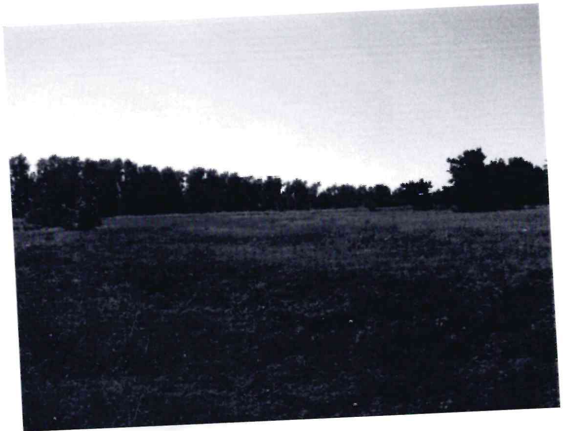
Рисунок 5 - Памятник природы «Лесопарк «Юбилейный»