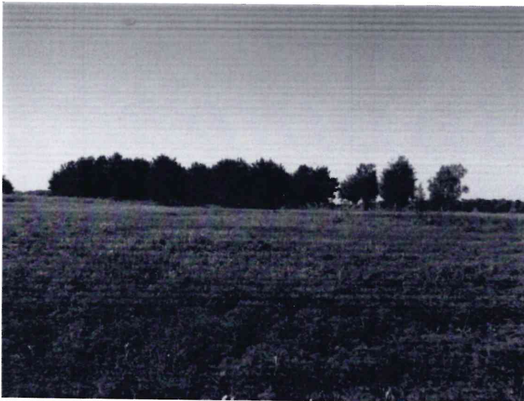
Рисунок 6 - Памятник природы «Лесопарк «Юбилейный»