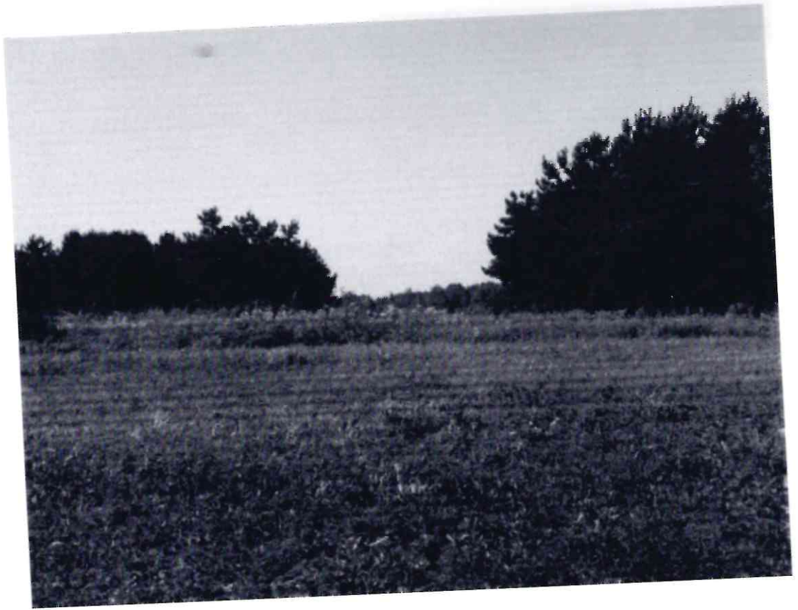
Рисунок 4 - Памятник природы «Лесопарк «Юбилейный»