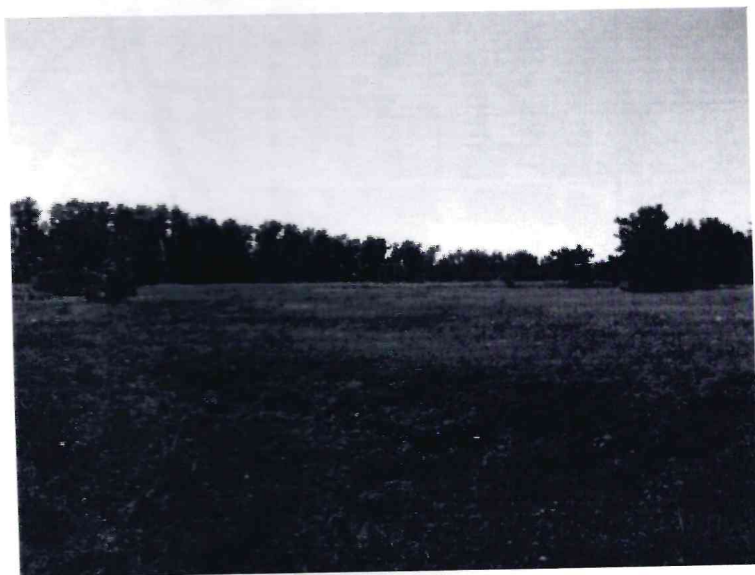
Рисунок 9 - Памятник природы «Лесопарк «Юбилейный»