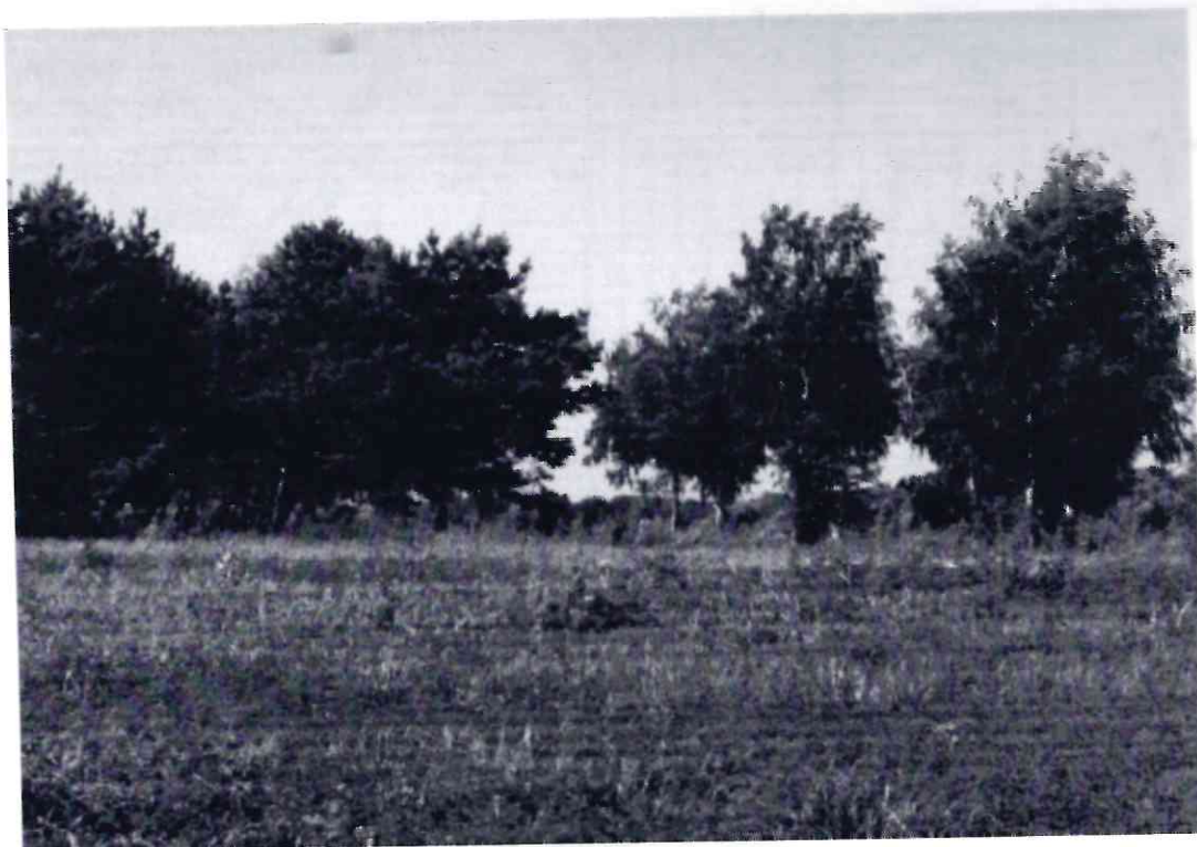
Рисунок 8 - Памятник природы «Лесопарк «Юбилейный»