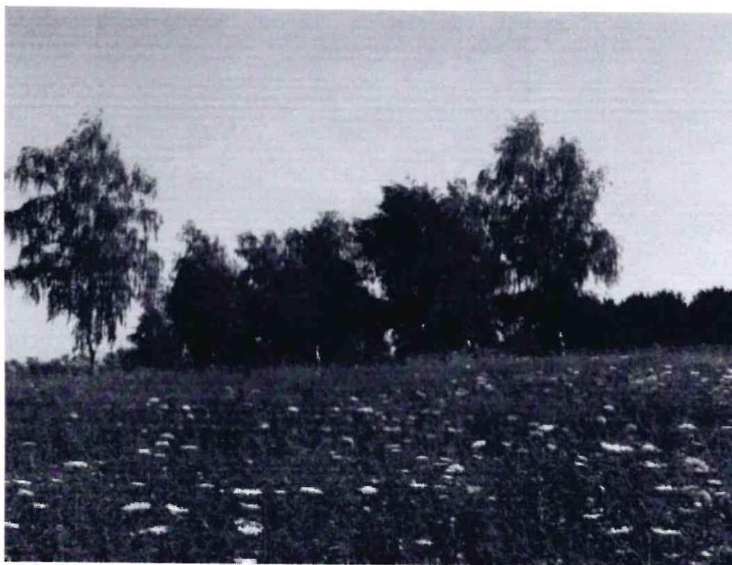
Рисунок 7 - Памятник природы «Лесопарк «Юбилейный»