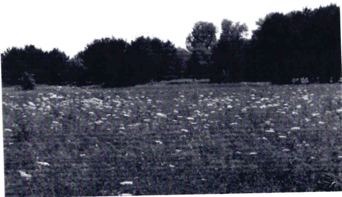
Рисунок 2 - Памятник природы «Лесопарк «Юбилейный»