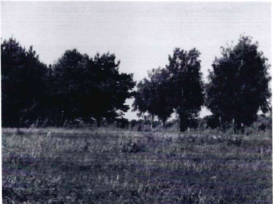
Рисунок 1 - Памятник природы «Лесопарк «Юбилейный»

Дополнительные материалы – фотографии памятника природы или наиболее характерных его частей, картографический материал (карты (схемы) расположения памятника природы и охранной зоны (1:100000, 1:50000), карты (схемы) памятника природы с обозначением границ (1:2000 или 1:500, в зависимости от занимаемой площади), Охранное обязательство, иные материалы.