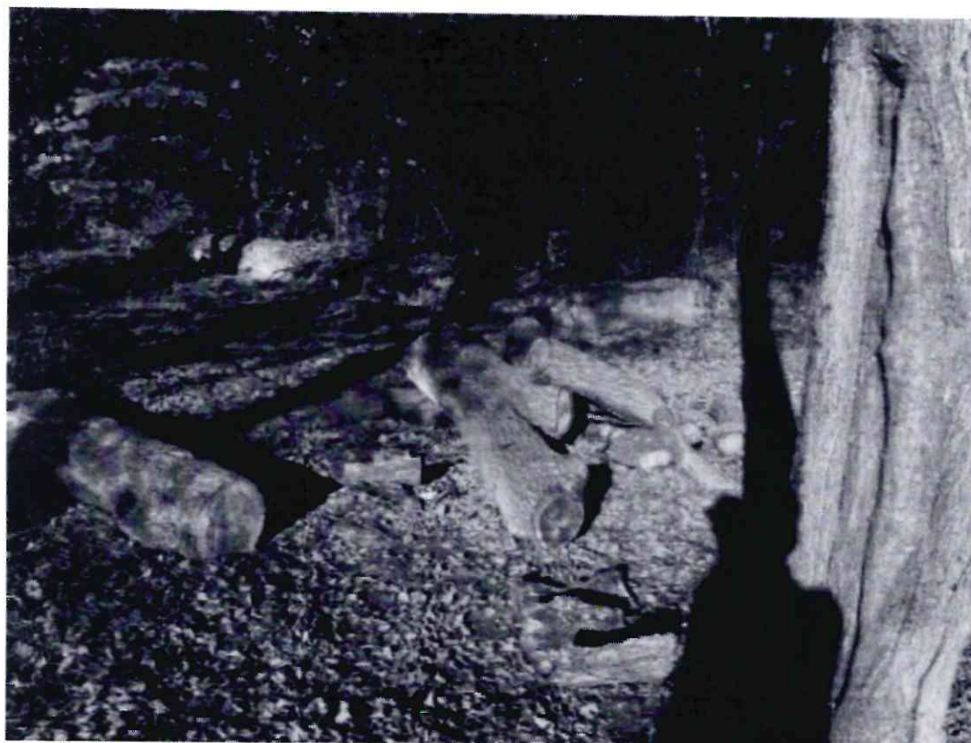
Рисунок 7 - Памятник природы «Липовая аллея»