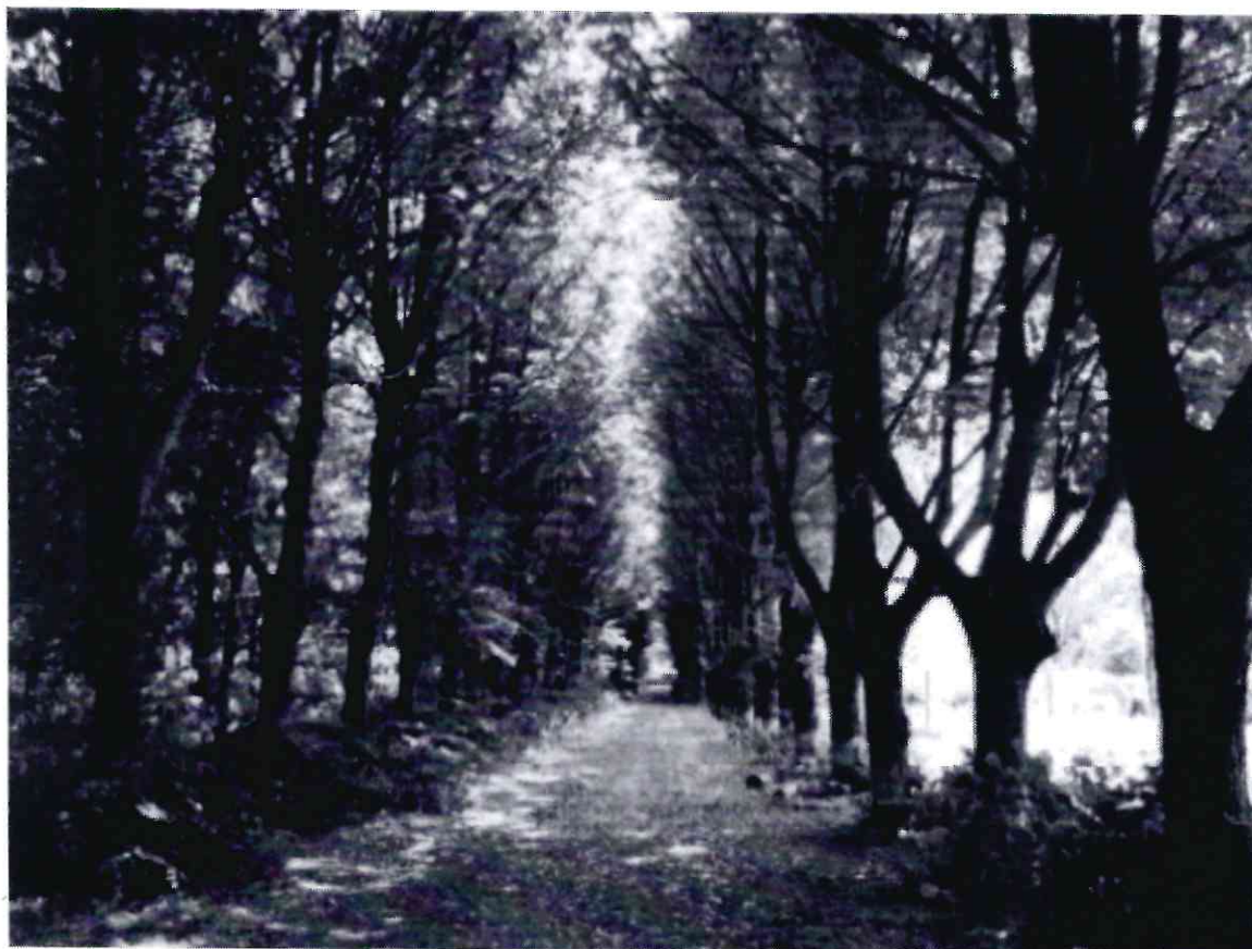
Рисунок 1 - Памятник природы «Липовая аллея»

Дополнительные материалы – фотографии памятника природы или наиболее характерных его частей, картографический материал (карты (схемы) расположения памятника природы и охранной зоны (1:100000, 1:50000), карты (схемы) памятника природы с обозначением границ (1:2000 или 1:500, в зависимости от занимаемой площади), Охранное обязательство, иные материалы.