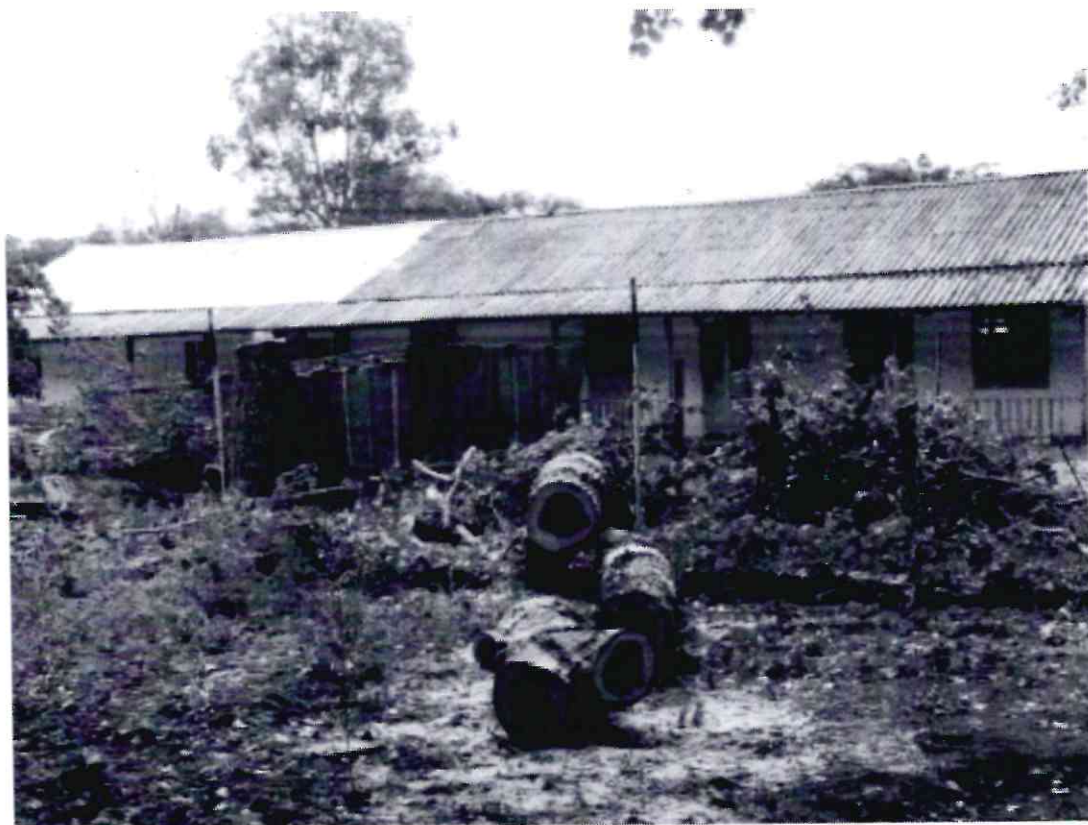
Рисунок 3 - Памятник природы «Липовая аллея»