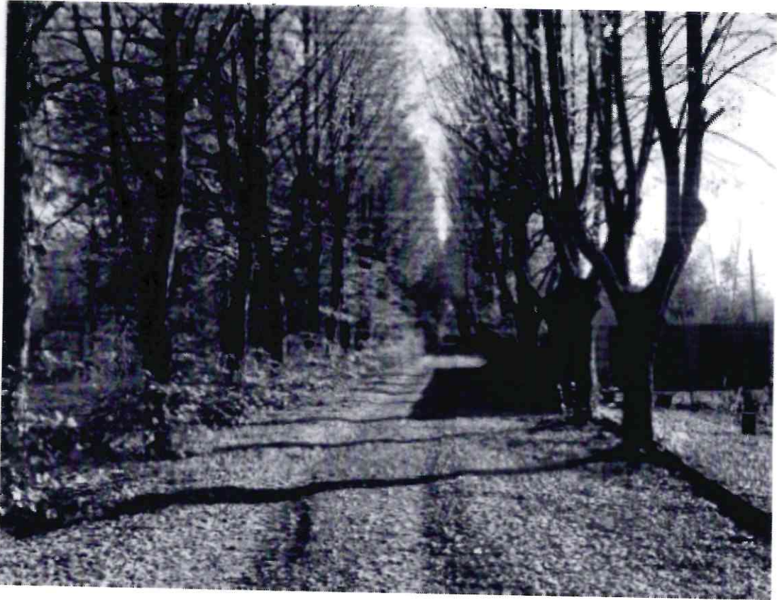
Рисунок 4 - Памятник природы «Липовая аллея»