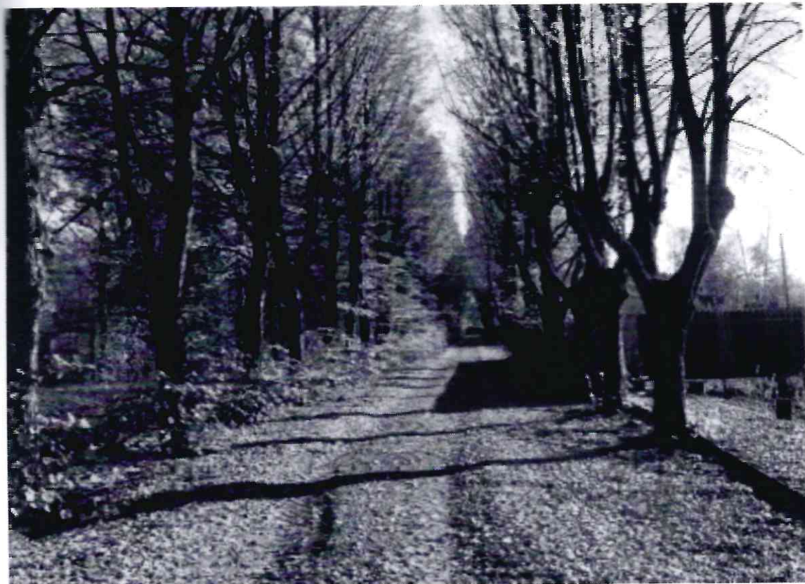
Рисунок 2 - Памятник природы «Липовая аллея»