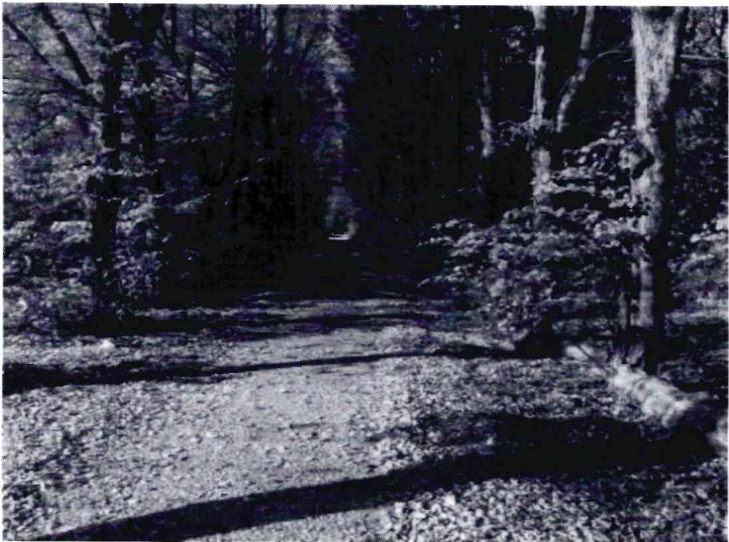
Рисунок 9 - Памятник природы «Липовая аллея»