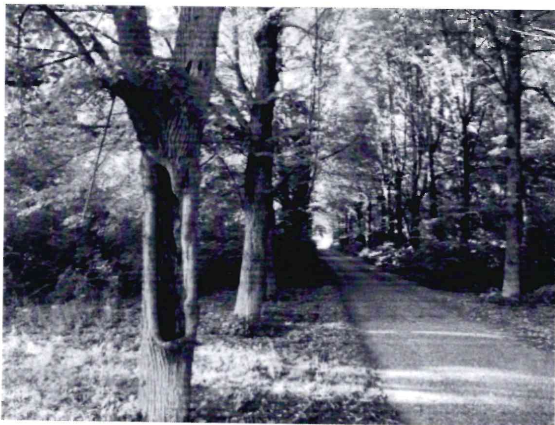
Рисунок 6 - Памятник природы «Липовая аллея»