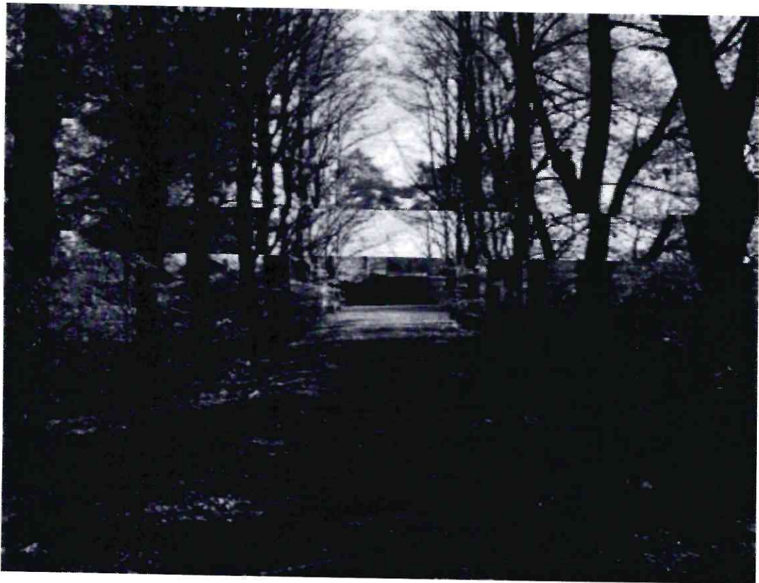
Рисунок 5 - Памятник природы «Липовая аллея»