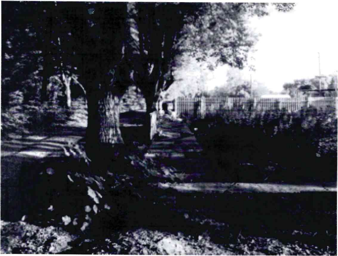
Рисунок 8 - Памятник природы «Липовая аллея»