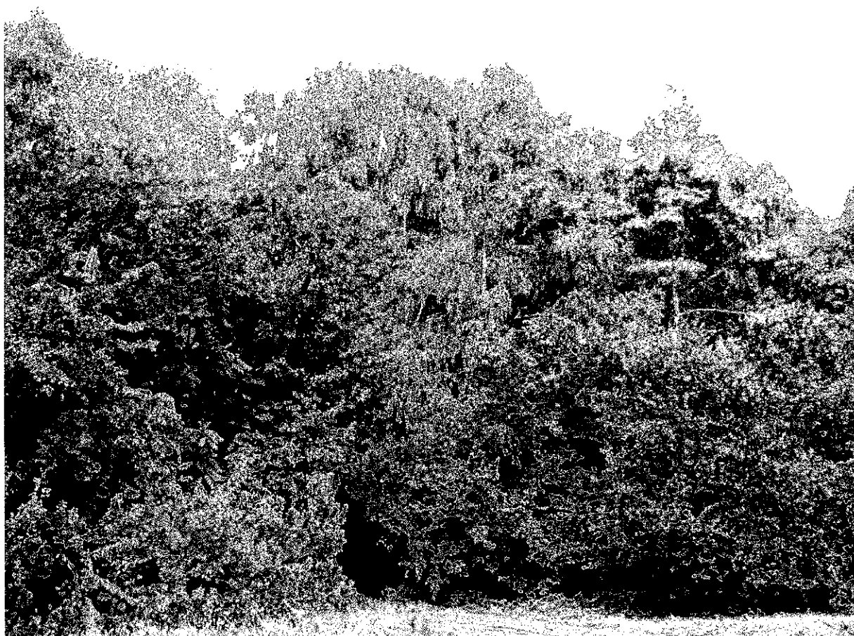
Фото 1. Памятник природы «Лесопарк Юбилейный»

Фотографии памятника природы регионального значения «Лесопарк Юбилейный»: