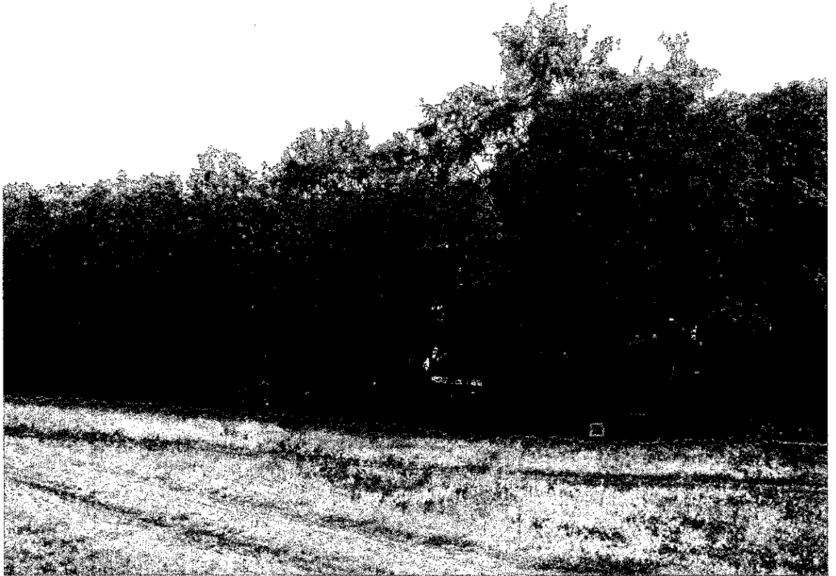
Фото 5. Памятник природы «Лесопарк Юбилейный»