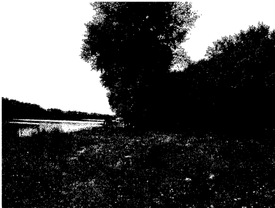
Фото 4. Памятник природы «Лесопарк Юбилейный»