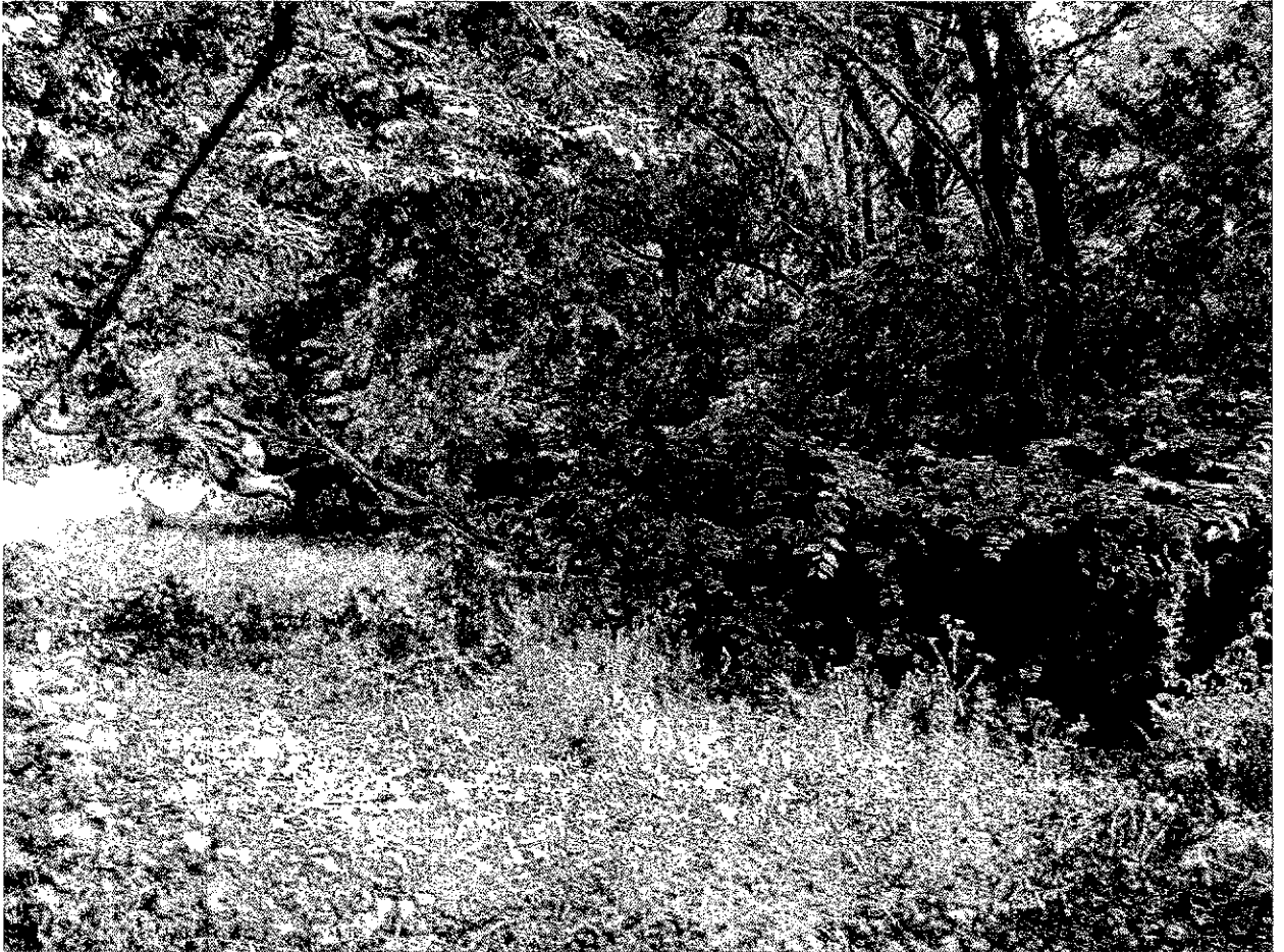
Фото 2. Памятник природы «Лесопарк Юбилейный»