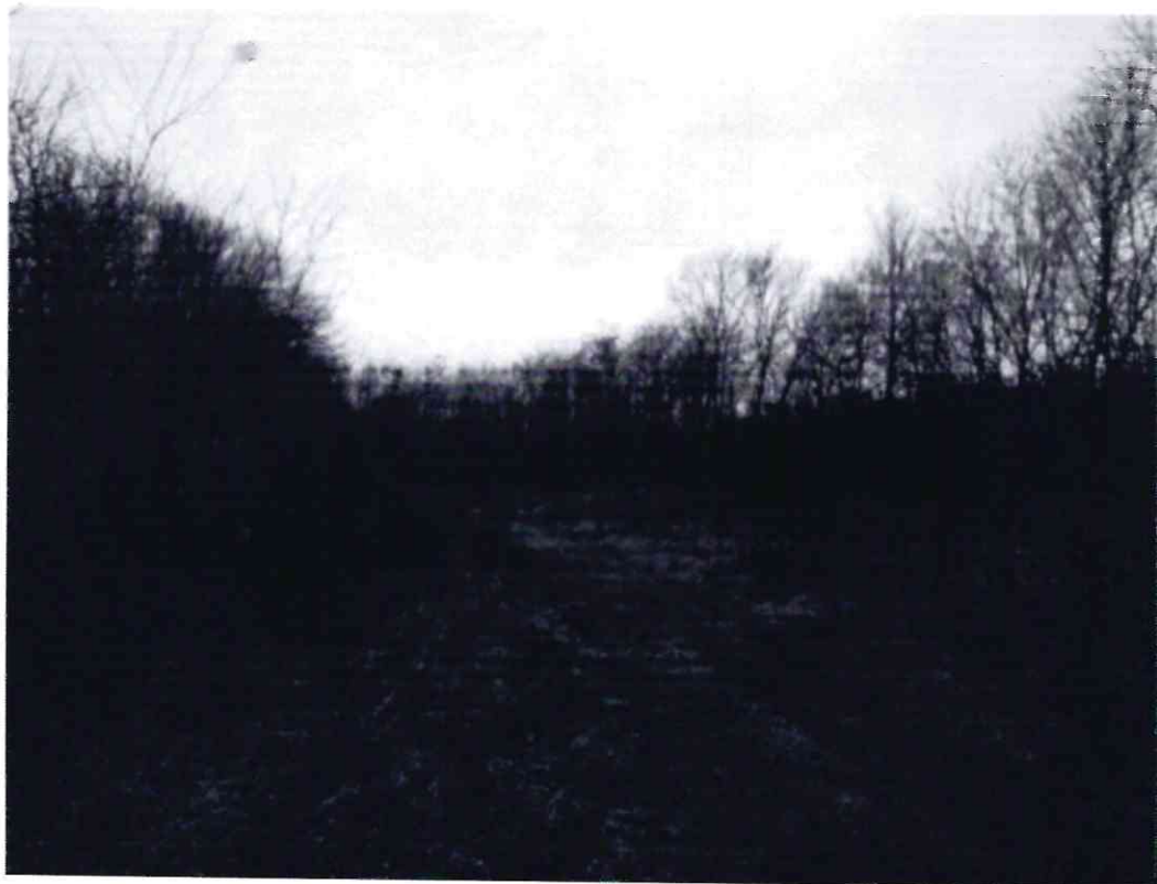
Рисунок 4 - Памятник природы «Роща Платнировская»