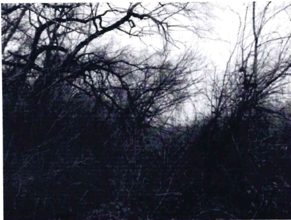
Рисунок 6 - Памятник природы «Роща Платнировская»