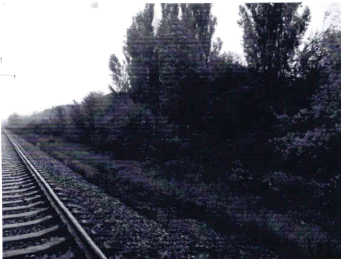
Рисунок 2 - Памятник природы «Роща Платнировская»