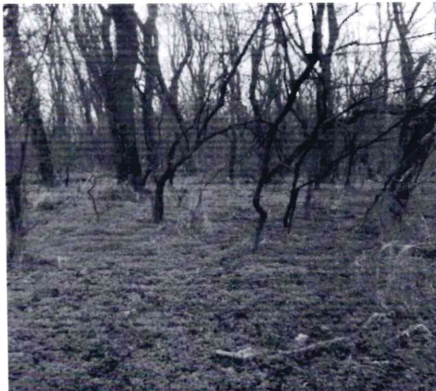
Рисунок 3 - Памятник природы «Роща Платнировская»