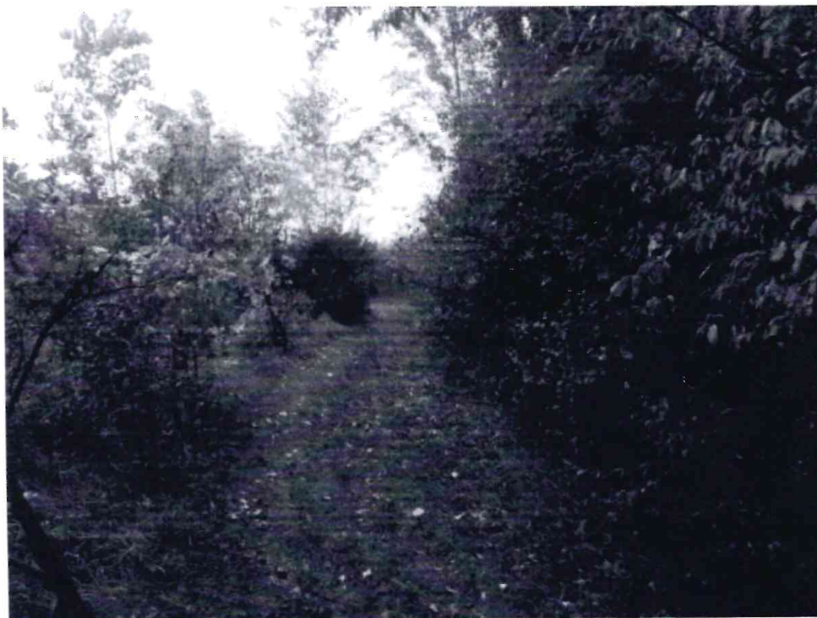
Рисунок 1 - Памятник природы «Роща Платнировская»

Дополнительные материалы – фотографии памятника природы или наиболее характерных его частей, картографический материал (карты (схемы) расположения памятника природы и охранной зоны (1:100000, 1:50000), карты (схемы) памятника природы с обозначением границ (1:2000 или 1:500, в зависимости от занимаемой площади), Охранное обязательство, иные материалы.