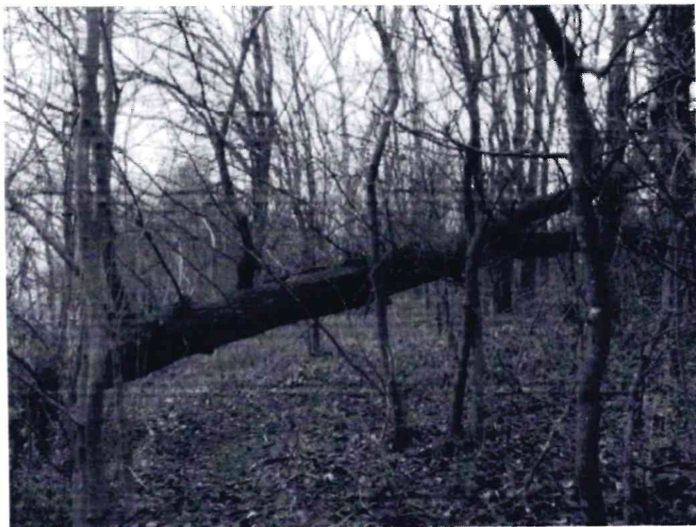
Рисунок 7 - Памятник природы «Роща Платнировская»