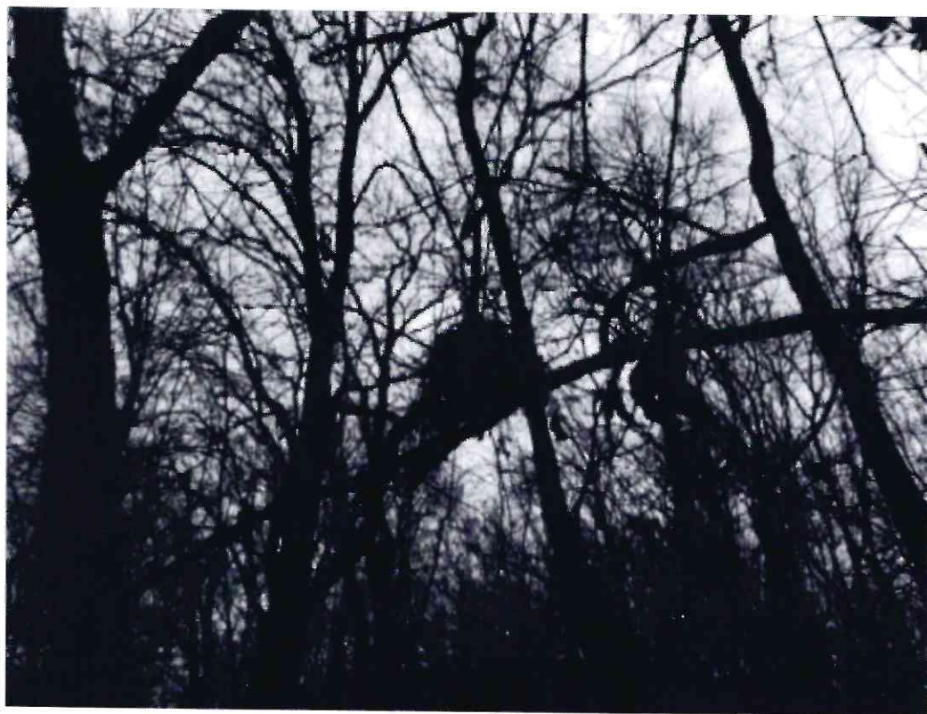
Рисунок 5 - Памятник природы «Роща Платнировская»