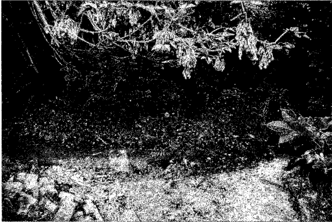
Фото 2. Памятник природы «Родник Светлячок»