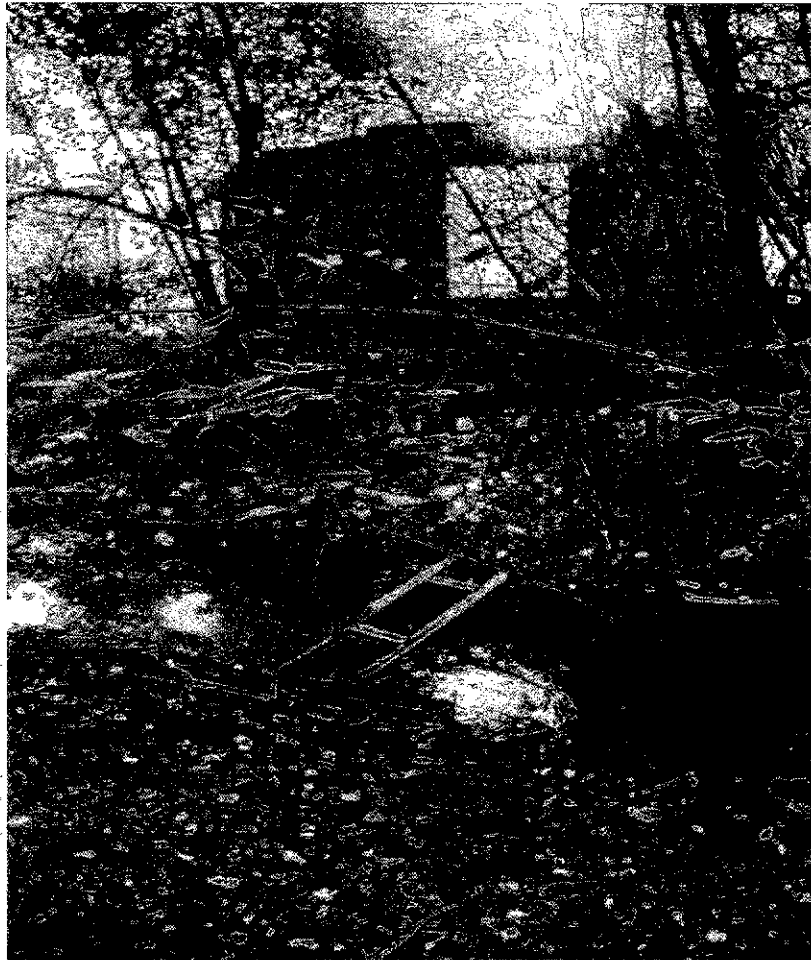
Фото 3. Памятник природы «Родник Светлячок»