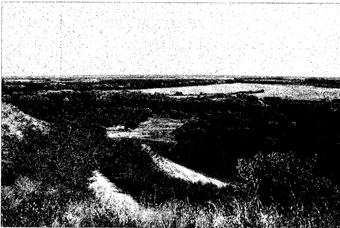
Фото 1. Памятник природы «Родник Светлячок»

Фотографии памятника природы регионального значения «Родник Светлячок»: