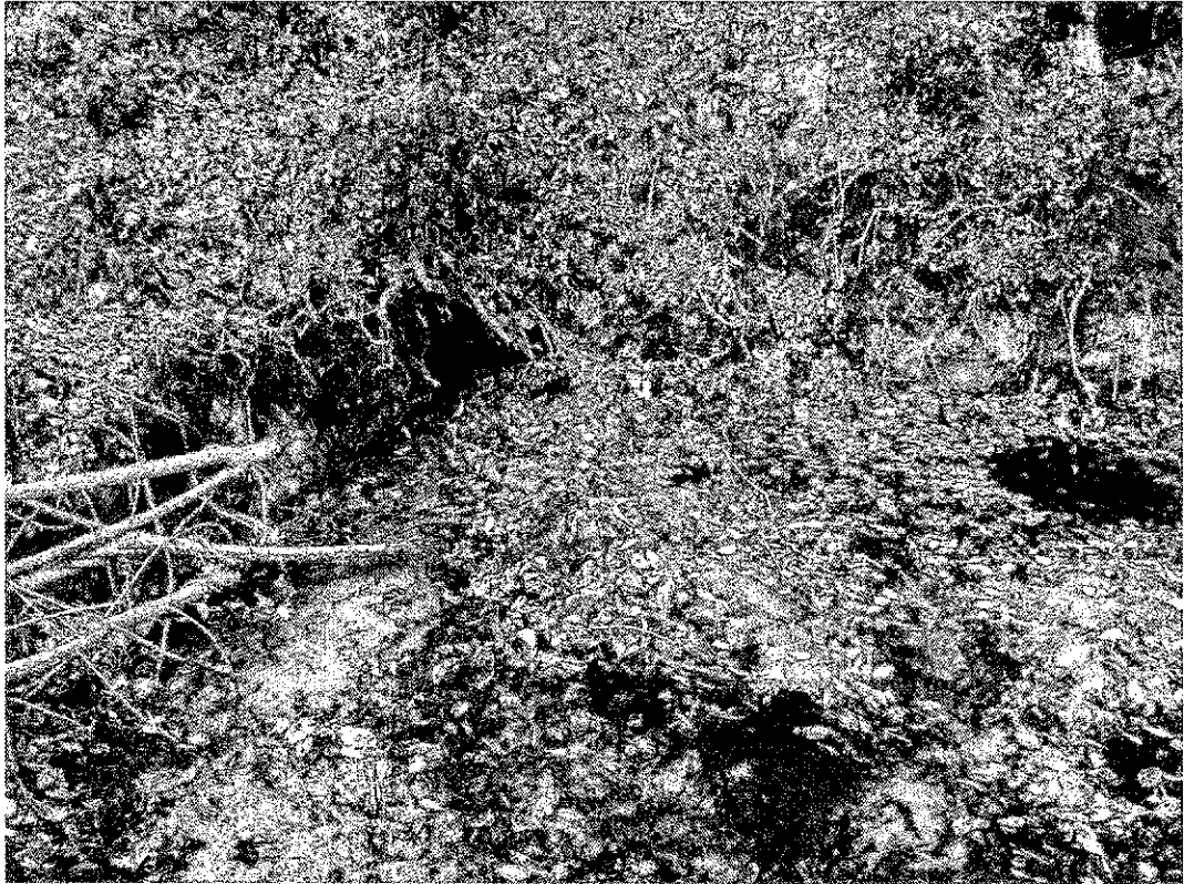
Фото 4. Памятник природы «Родник Светлячок»

Картографические материалы с нанесенными границами памятника природы регионального значения, его охранной зоны (при наличии) и функциональных зон (при наличии):