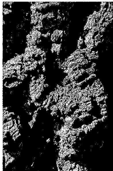
Фото 3. Механические повреждения памятника природы «Дуб Урожайный»