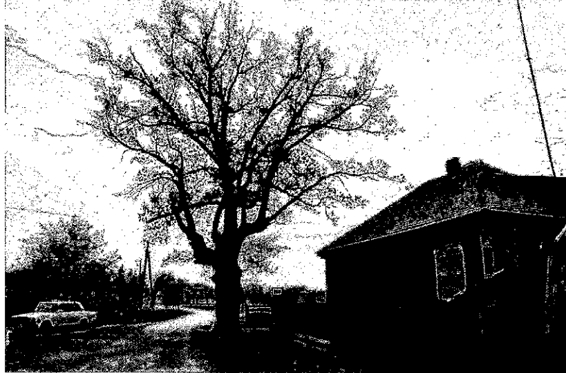
Фото 1. Памятник природы «Дуб Урожайный»

Фотографии памятника природы регионального значения: