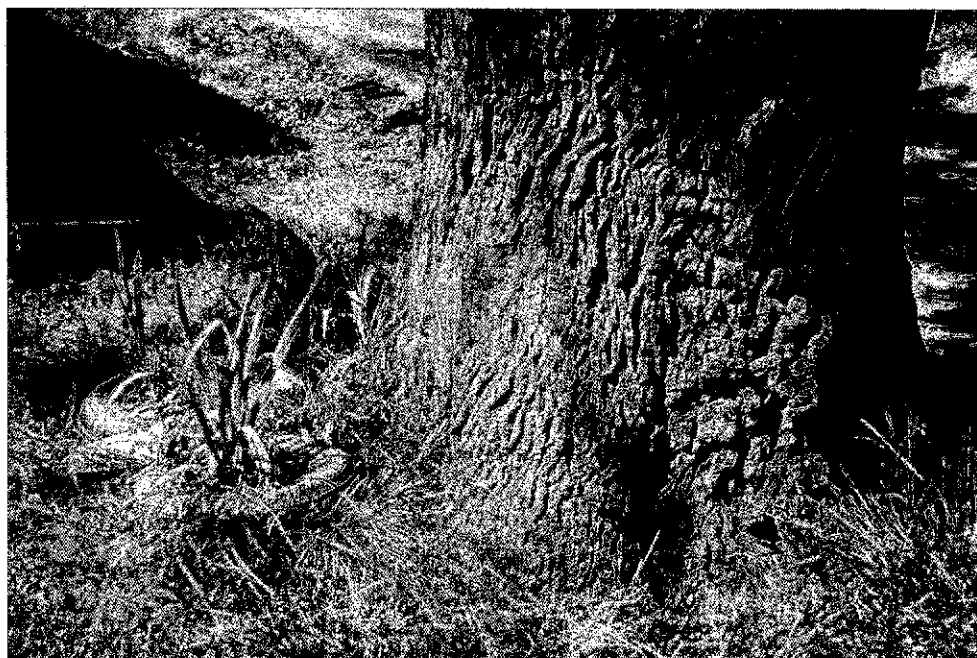
Фото 4. Травянистая растительность на территории памятника природы