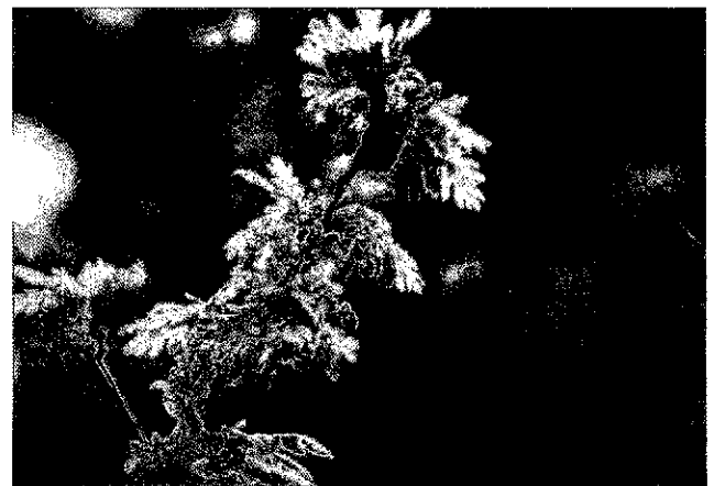
Фото 2. Памятник природы «Дуб черешчатый»