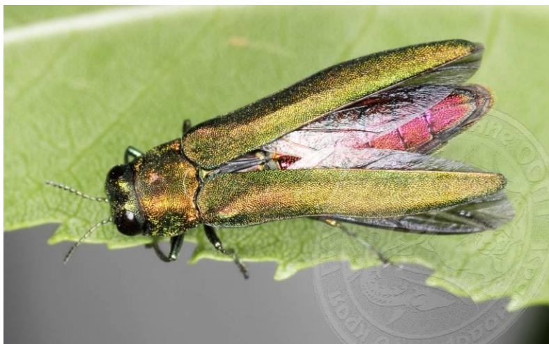
Рисунок 2. Взлетающая ясеневая изумрудная узкотелая златка с раздвинутыми надкрыльями