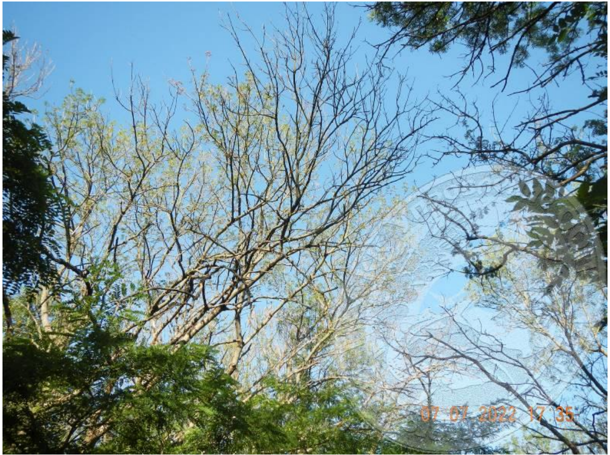
Рисунок 8. Вид древостоя ясеня высокого в очаге Agrilus planipennis , эруптивная фаза вспышки: усыхающий массив в пойме р. Сосыка на ООПТ «Дубовая роща», комплексный очаг местных филофагов и адвентивного ксилофага; Ленинградский р-н, начало июля

По этим дорогам курсируют тысячи транзитных фур, объезжающих трассу М4. В июне–июле к ним добавляются многочисленные автокараваны с зерном и сахарной свёклой, вывозящие урожай в порты или на переработку. Максимальный трафик в обоих направлениях здесь приходится как раз на период разлёта жуков ЯИУЗ, что способствует расселению вида в степной зоне. Такой вектор инвазии подтверждается и тем, что восточнее шоссе М4 и южнее Павловской встречаемость и плотность популяций ЯИУЗ сокращается, а долину р. Ея этот вид к октябрю 2022 года пересёк лишь севернее Незамаевской.