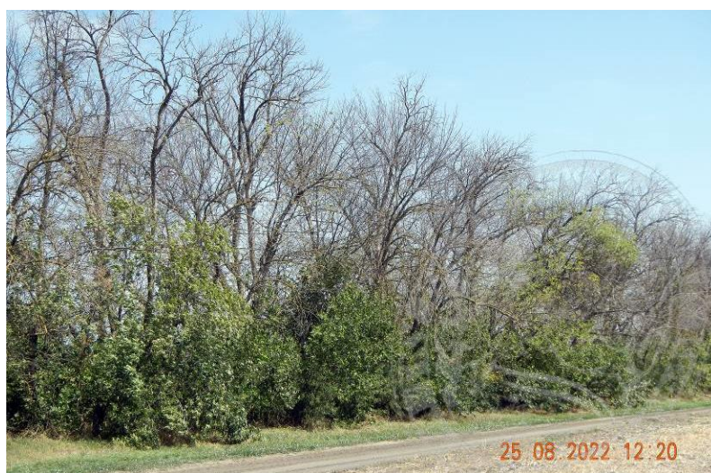
Рисунок 16. Усыхающая лесополоса ясеня пенсильванского: начало фазы кризиса. Южная околица станицы Крыловская, Ленинградский район, конец августа 2022 года