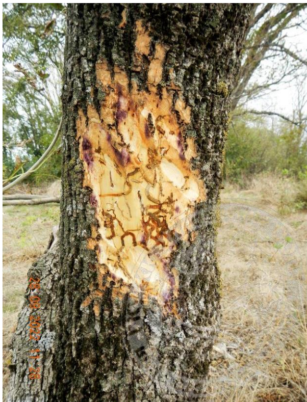
Рисунок 13. Характерные извилистые и спутанные ходы личинок ясеневой изумрудной узкотелой златки под корой деревьев на 2–3 год после их заселения: а – ясень высокий (Челбасский лес); б – ясень пенсильванский (Каневская). Эти деревья усохнут в 2023 году.