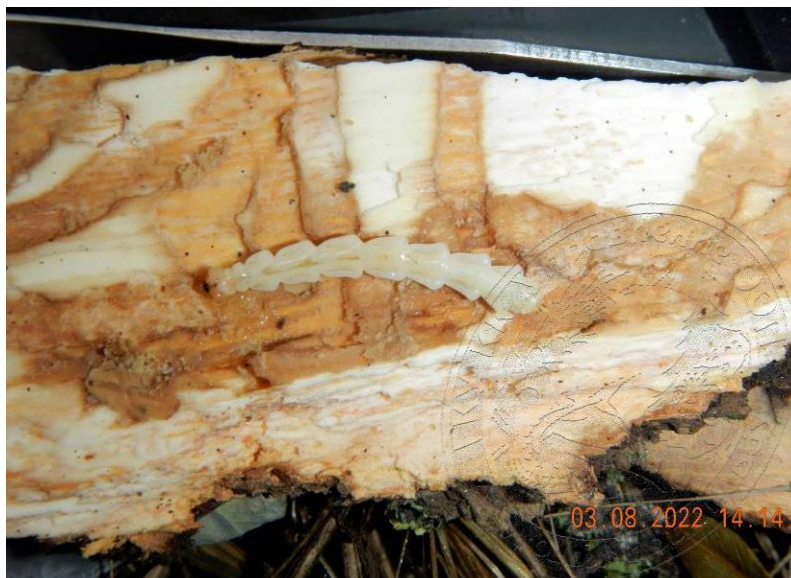
Рисунок 7. Личинка ясеневой изумрудной узкотелой златки старшего возраста в лубе