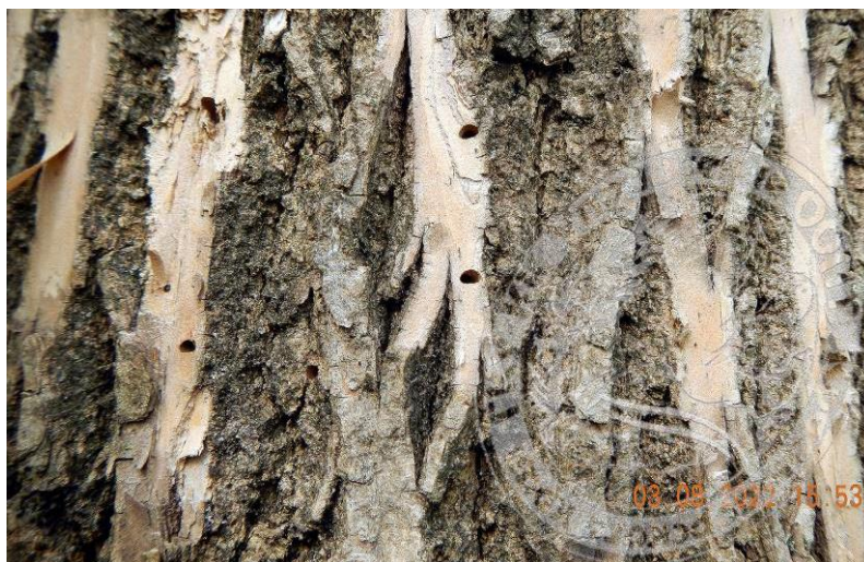
Рисунок 12. Многочисленные лётные отверстия жуков ясеневой изумрудной узкотелой златки на второй – третий год после заселения дерева; начало августа