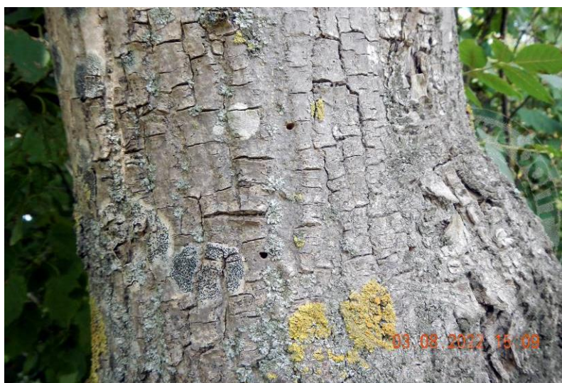
Рисунок 11. Редкие лётные отверстия жуков ясеневой изумрудной узкотелой златки в первый – второй год после заселения дерева; начало августа