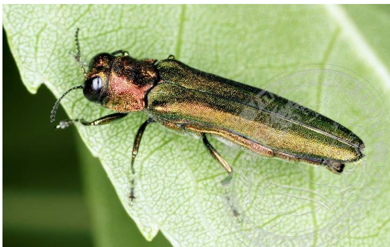
Рисунок 1. Жук (самец) ясеневой изумрудной узкотелой златки на листе ясеня в позе покоя