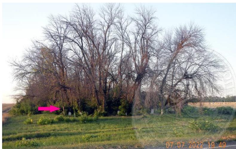
Рисунок 17. Усохший древостой ясеня пенсильванского в очаге размножения златки: фаза кризиса. Полезащитная лесополоса у шоссе трасса М4 «Дон» – Незамаевская, Павловский район, начало июля 2022 года. Стрелка указывает место отбора пробы