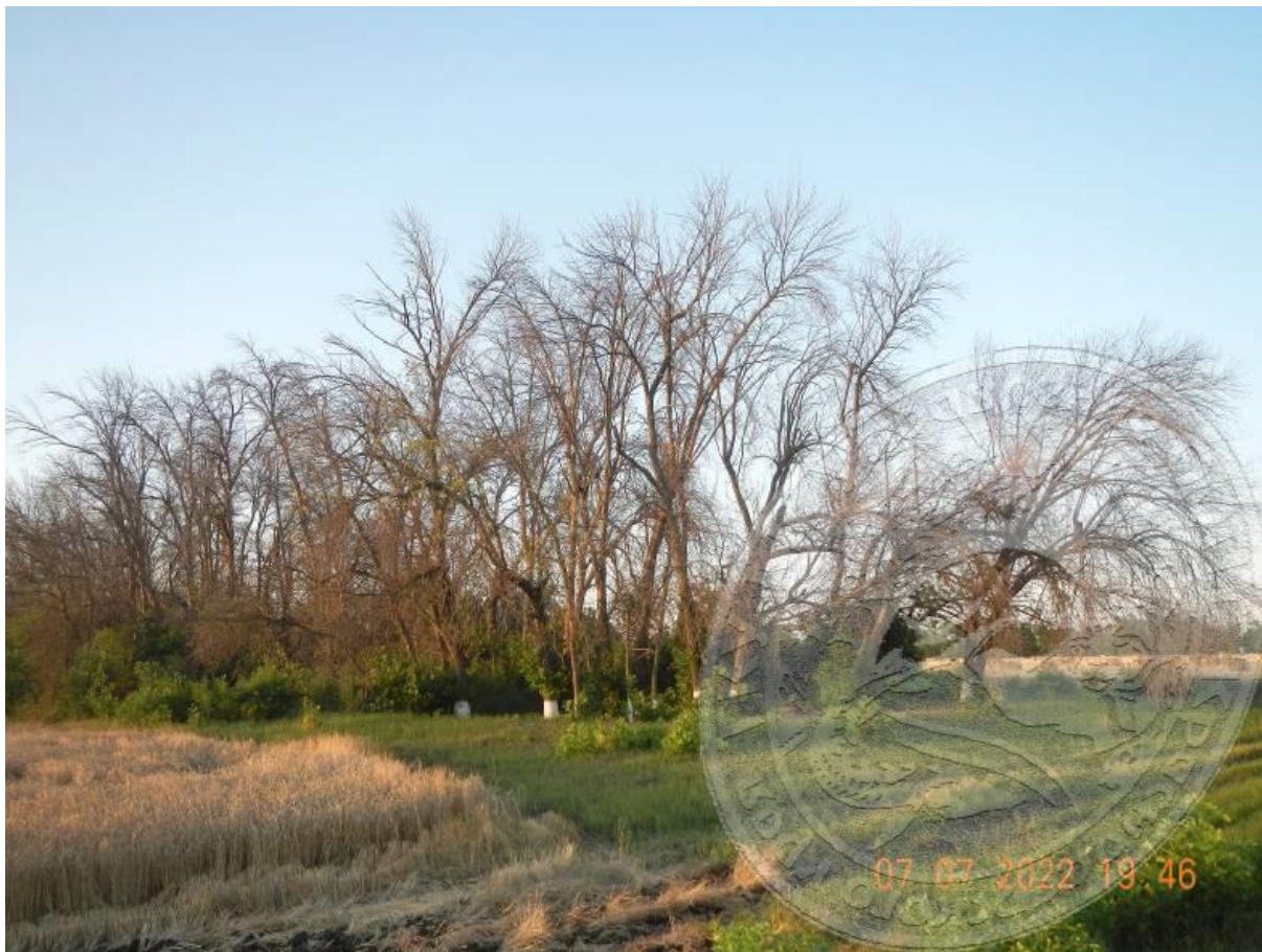
Рисунок 9. Вид чистого древостоя ясеня пенсильванского в очаге Agrilus planipennis , кризисная фаза вспышки: лесополоса, усохшая уже в 2021 году; Павловский р-н, шоссе у станции Весёлая, начало июля

Вид, безусловно, населяет приграничные с Краснодарским краем районы Ростовской области – Азовский, Кагальницкий, Зерноградский, Егорлыкский. Эти смежные регионы за последние 10 лет не впервые «обмениваются» чужеродными насекомыми-инвайдерами, расселяющимися в насаждениях у железных дорог, вдоль трассы М4 и через сотни «трансграничных» лесополос (рис. 9).