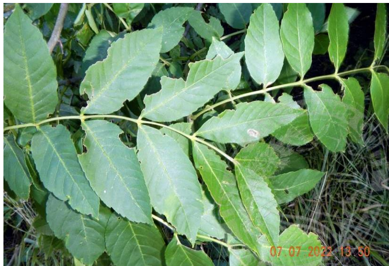
Рисунок 4. Следы дополнительного питания жуков ясеневой изумрудной узкотелой златки: погрызы на краях листьев в очаге массового размножения. Челбасский лес, июль 2022 года