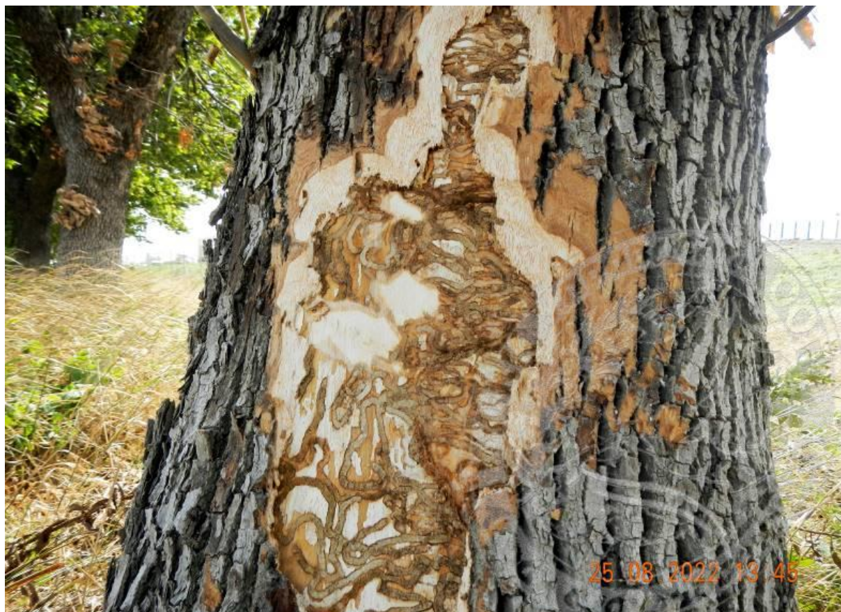
Рисунок 7. Признаки присутствия Agrilus planipennis в природе: свежие ходы личинок генерации 2022/2023 характерной формы и топографии под корой на комле ясеня пенсильванского, сами личинки ушли на окукливание в древесину; обочина шоссе М4 «Дон» у станицы Кущёвская, конец августа

массиве леса Суходол (на ООПТ), севернее станицы Батуриная (пункт 3 на рис. 4). Вредитель также заселил все древесно-кустарниковые массивы на землях лесного фонда с участием ясеня в степной зоне КК, проверенные в 2022 г. Самыми крупными лесными участками, на которых формируются очаги ЯИУЗ, являются Челбасский лес (1659 га, эруптивная фаза), Крыловский лес в долине р. Грузская (837 га, продромальная фаза), лес Суходол (200 га, продромальная фаза) и урочище «Дубовая роща» (79 га, эруптивная фаза) (рис. 8).