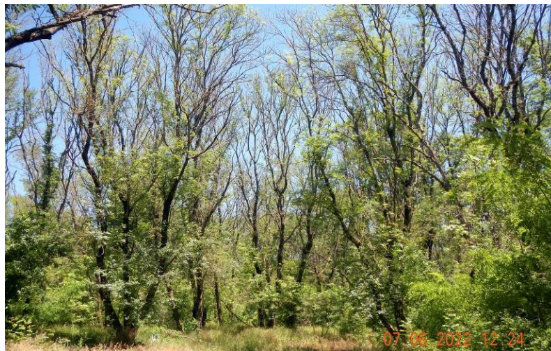
Рисунок 15. Облик древостоя ясеня высокого в хроническом очаге дефолиации крон пилильщиком ясеневым черным при формирующемся очаге ясеневой изумрудной узкотелой златки (первый год эруптивной фазы). ООПТ памятник природы «Дубовая роща», Ленинградский район, начало июня 2022 года