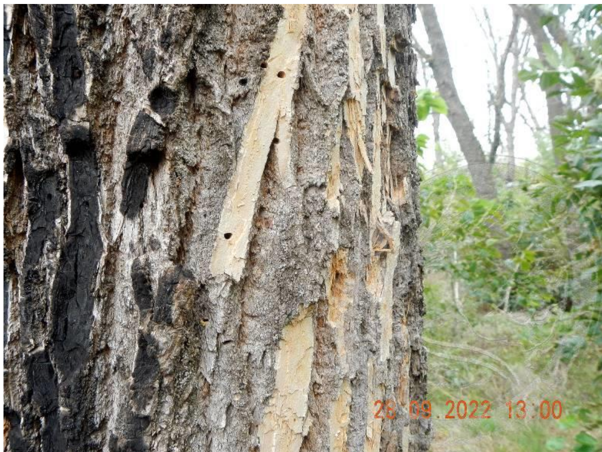
Рисунок 3. Лётные отверстия жуков златки на коре ясеня в древостое, повреждённом пожаром на ООПТ «Кустарниковая роща с редкой растительностью» (Кушёвский р-н)

Насаждения с участием трёх таксонов ясеня ( F. excelsior , F. angustifolia Vahl и F. pennsylvanica ) разного происхождения, породного состава, разных владельцев/пользователей, на землях разных категорий обследовались на ООПТ с середины апреля, согласно плану патрулирований и инвентаризации биоразнообразия, в том числе в целях мониторинга хронических и/или поиска новых очагов пилильщиков Tomostetus nigritus и Eupareophora exarmata (Thomson, 1871).