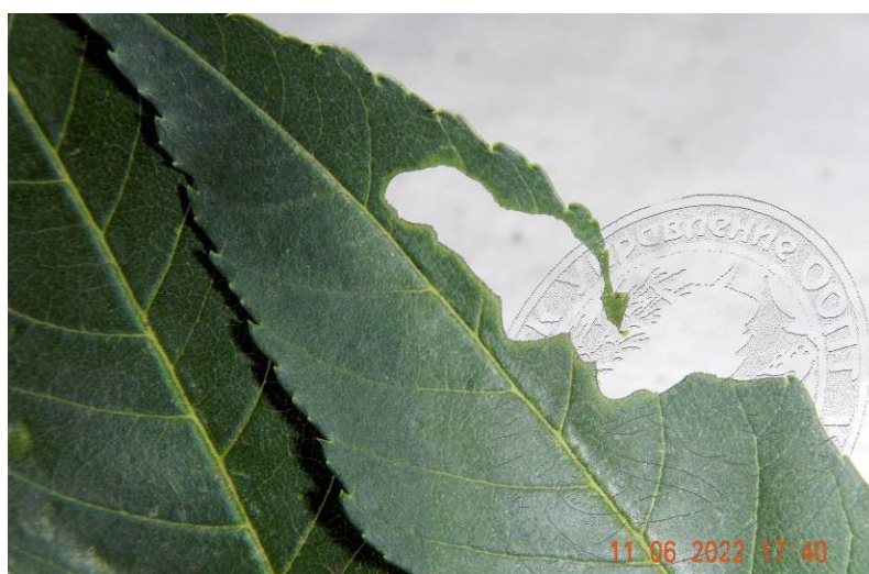
Рисунок 6. Одиночный глубокий погрыз, оставленный жуком златки на листе ясеня высокого. Краснодар, in vitro