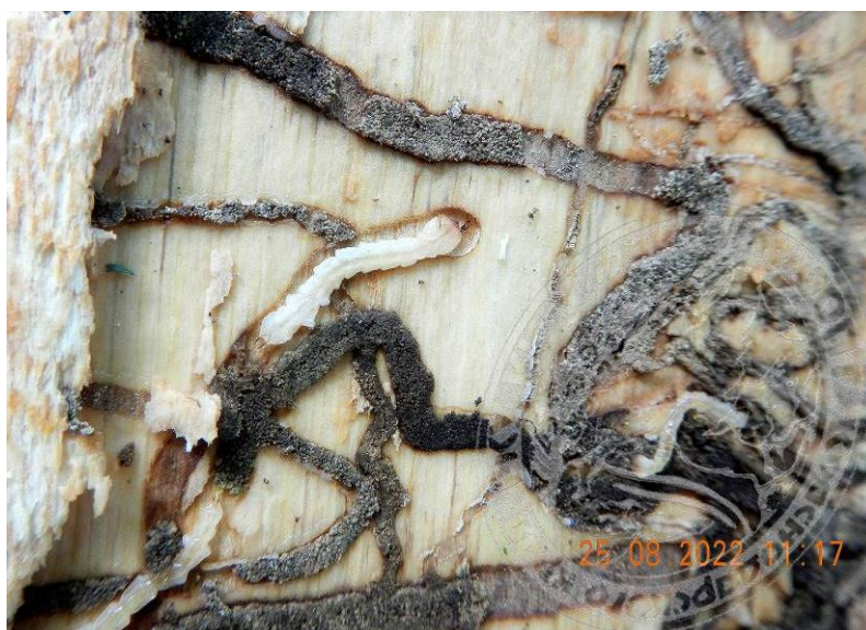
Рисунок 8. Личинки ясеневой изумрудной узкотелой златки разных возрастов в заболони