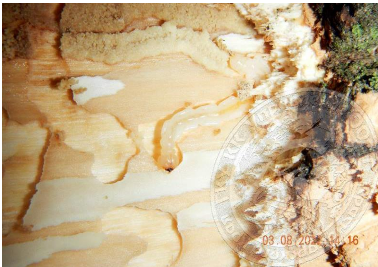
Рисунок 6. Признаки присутствия Agrilus planipennis в природе: личинка старшего возраста генерации 2022/2023 в заболони ясеня; начало августа

Популяции (особи и/или следы жизнедеятельности) ЯИУЗ выявлены в 67 пунктах 9 северо-западных, северных и центральных районов Краснодарского края, из всех 126 насаждений, исследованных инструментально (рис. 4). В 16 древостоях, обследованных с 07.07.2022 по 28.09.2022, под корой были обнаружены живые личинки ЯИУЗ разных поколений и возрастов (рис. 6) и/или погибшие жуки генерации 2021/2022. Наибольшее количество популяций (в 57 пунктах) было идентифицировано по видоспецифичным ходам (разных лет) личинок в коре и заболони (рис. 7) и/или по D-образным лётным отверстиям жуков на коре, также разных лет – 25 пунктов. В некоторых урочищах (Челбасский лес, «Дубовая роща»), где эти наблюдения повторялись, удалось зафиксировать все признаки развития и вредоносности ЯИУЗ, включая сезонную динамику усыхания деревьев ясеня.