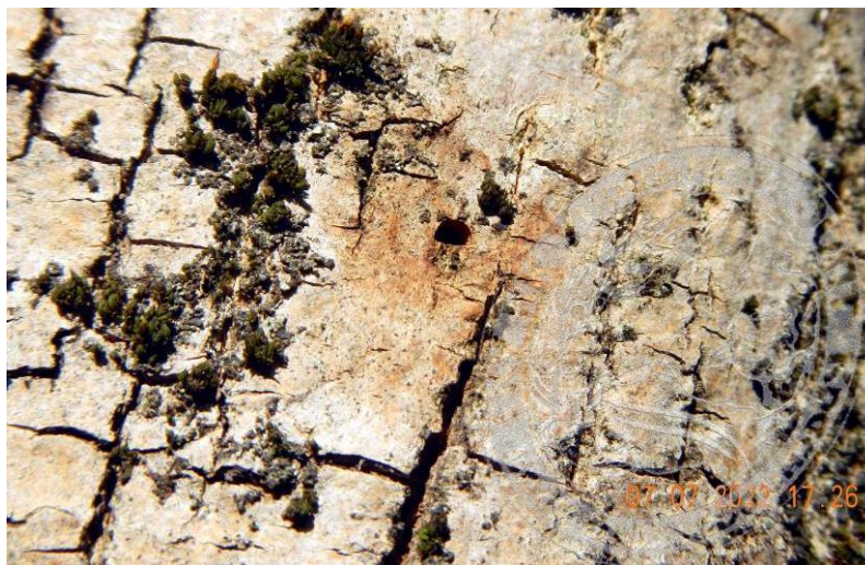
Рисунок 10. Свежее лётное (вылетное) отверстие жука ясеневой изумрудной узкотелой златки характерной D-образной формы, оставленное в коре ясеня; начало июля