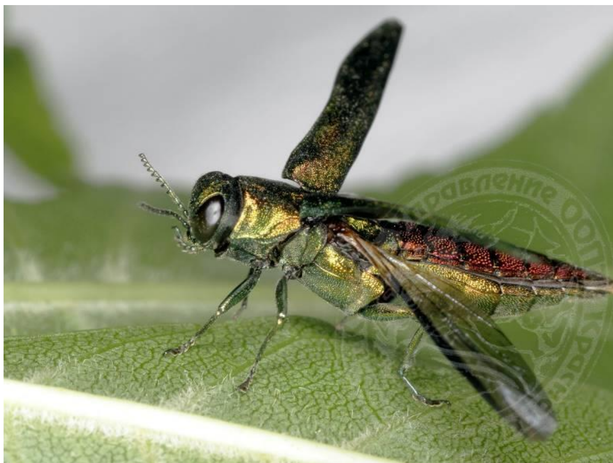
Рисунок 1. Жук Agrilus planipennis , готовящийся к взлёту; Краснодар, in vitro

Экспансия ясеновой изумрудной узкотелой златки Agrilus planipennis Fairmaire, 1888 1 (далее – ЯИУЗ) в Европейской части России фиксируется в течение почти 20 лет. Из первоначального пункта обнаружения (Москва) вид расселился на северо-восток, северо-запад, юго-восток и юг. По наблюдениям в 2012–2018 гг., на юге Европейской России продвижение вредителя вдоль трассы М4 «Дон» к 2016 г. достигло северных границ Ростовской области. В Краснодарском крае поиски ЯИУЗ выполнялись в 2010–2019 гг. в рамках мероприятий государственного лесопатологического мониторинга (далее – ГЛПМ), наряду с надзором за аборигенными вредителями ясеня и чужеродными фитофагами других лесобразующих пород.