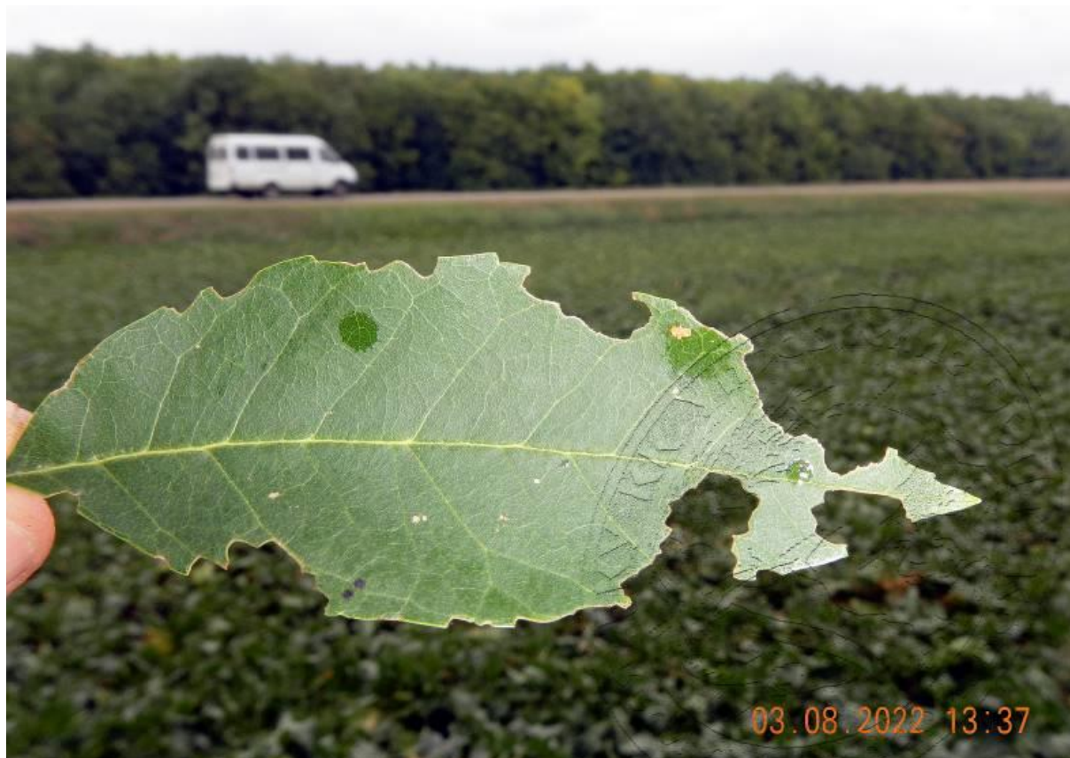
Рисунок 5. Лист ясеня пенсильванского с характерными погрызами краёв, оставленными жуками Agrilus planipennis в процессе их дополнительного питания. Полезащитная лесополоса северо-восточнее станицы Каневская, начало августа

ООПТ. Визуально было оценено состояние насаждений разной площади и/или отдельных деревьев ясеня в 1134 пунктах (рис. 2) трёх регионов Северо-Западного Кавказа: Краснодарского края (1116 древостоев в 35 районах), Адыгеи (14 в 4 районах) и Карачаево-Черкесии (4 в 2 районах).