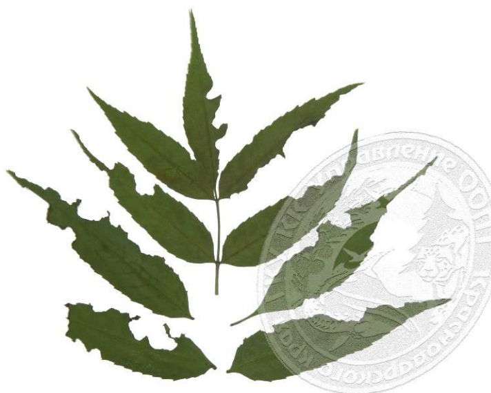
Рисунок 5. Характерные погрызы, оставленные жуками златки на простых листочках ясеня высокого за одну неделю июля. Краснодар, in vitro