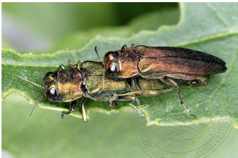
Рисунок 3. Копулирующие жуки на листе ясеня, половой диморфизм имаго: самка крупнее