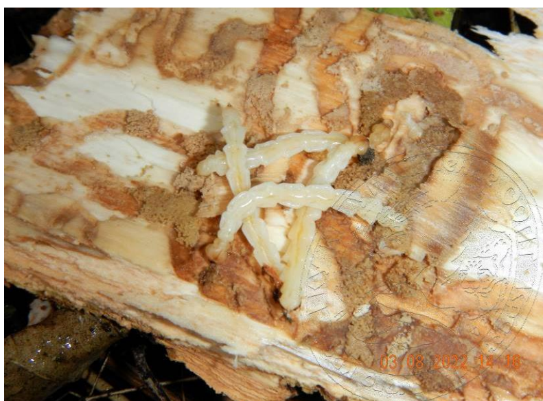
Рисунок 9. Личинки ясеневой изумрудной узкотелой златки старшего возраста до ухода на окукливание в древесину; начало августа