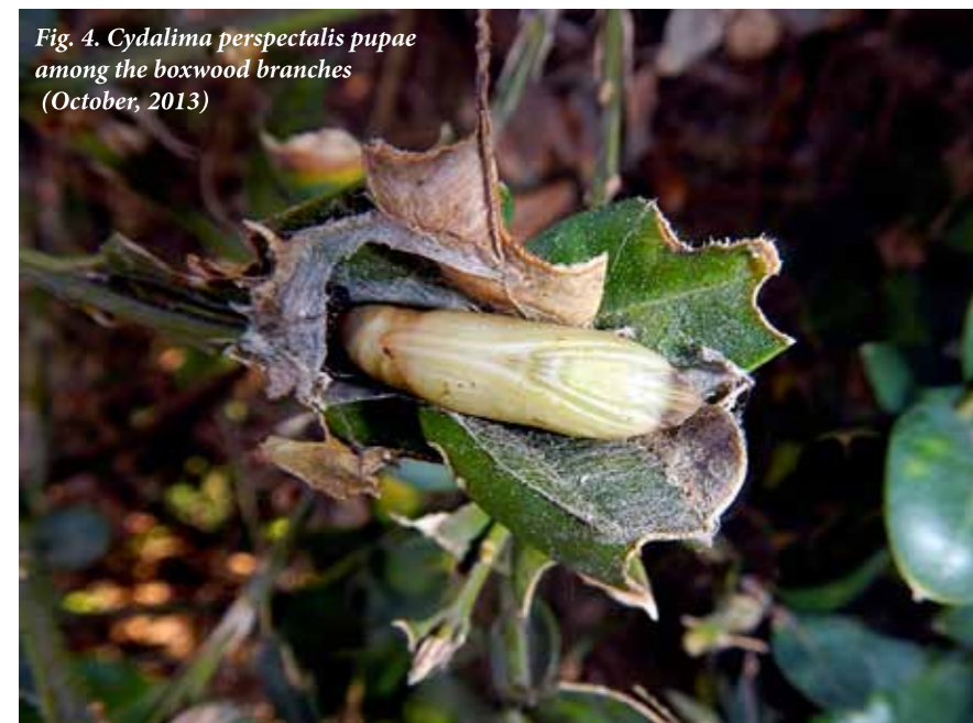
Fig. 4. Cydalima perspectalis pupae among the boxwood branches (October, 2013)

Однако в конце октября 2013 г. в природных условиях г. Сочи значительная часть вредителя пребывала в стадии гусениц 2-го и 3-го возрастов. Гусеницы 2-го возраста построили характерные двухслойные (двухкамерные) очень плотные коконы между молодыми листьями верхушечной почки. В них они перелиняли, сохраняли двигательную активность, но не питались (рис. 5). В то же время небольшая часть ли-