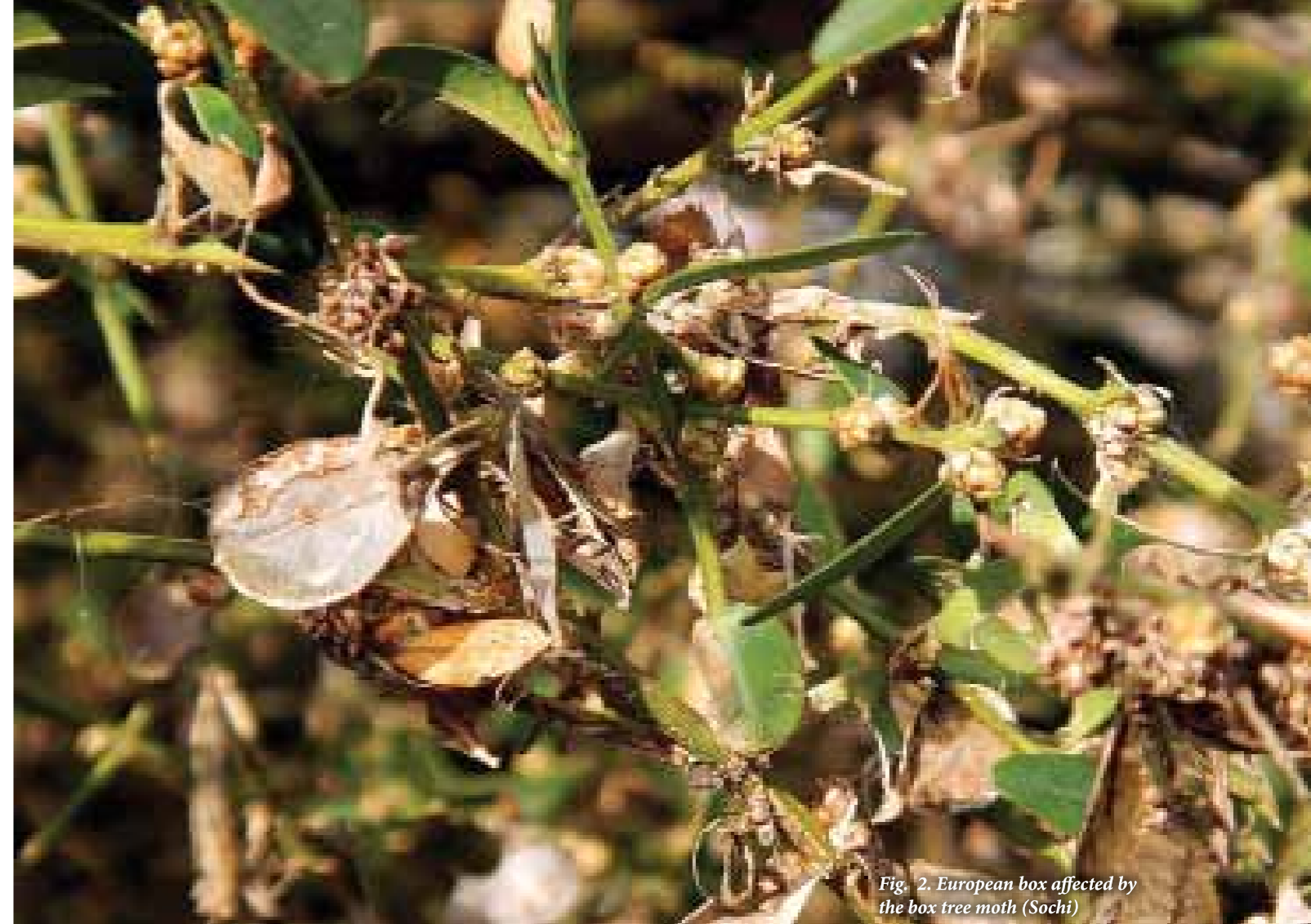
Fig. 2. European box affected by the box tree moth (Sochi)

В 2013 г. зафиксировано массовое распространение самшитовой огневки на значительной части города Сочи и проникновение в аборигенные леса