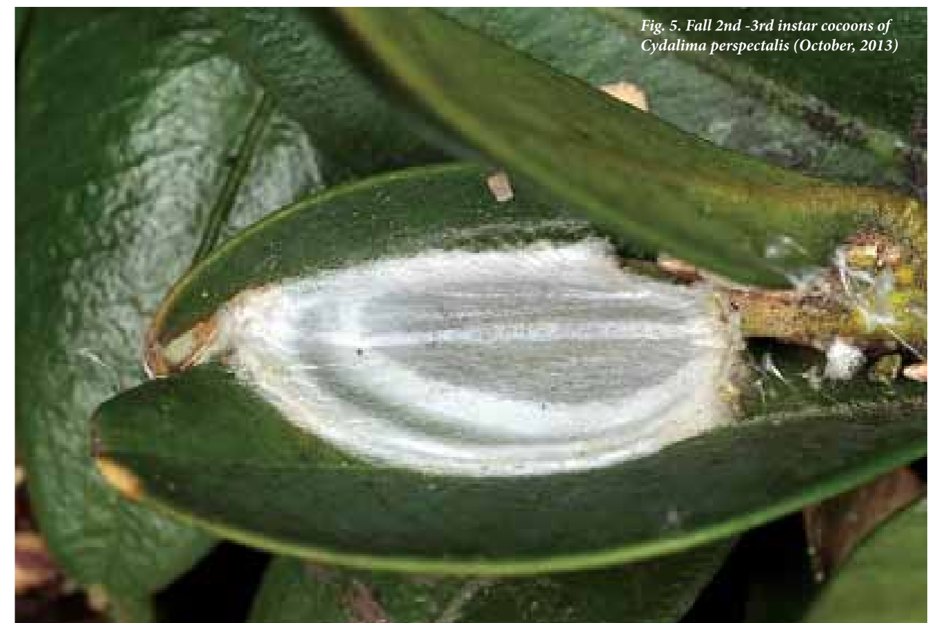
Fig. 5. Fall 2nd -3rd instar cocoons of Cydalima perspectalis (October, 2013)