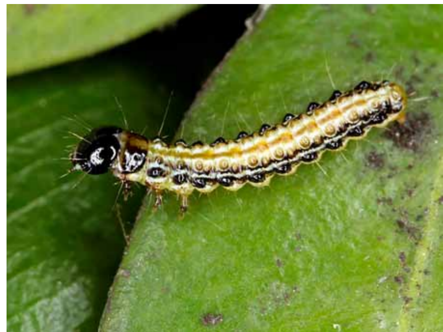
Fig. 6. Cydalima perspectalis 3rd instar (October, 2013)

Currently, the data on biological characteristics of Cydalima perspectalis in the Caucasus are incomplete. 2012-2013 initial observations in Sochi region show that the pest produces 2-4 generations per year. Upon com-