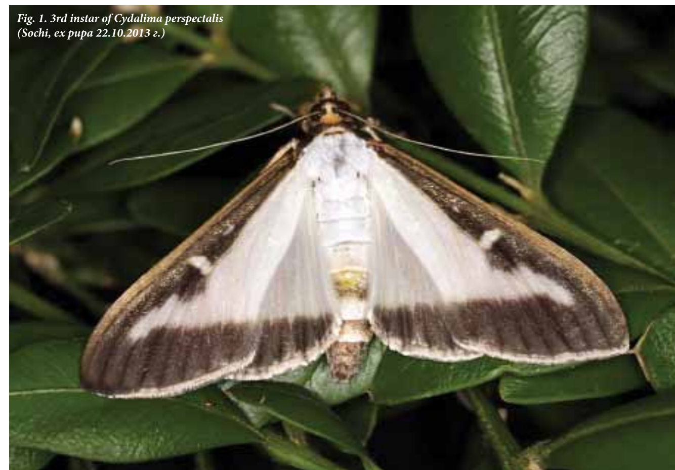
Fig. 1. 3rd instar of Cydalima perspectalis (Sochi, ex pupa 22.10.2013 г.)

Рис. 1. Самка третьего поколения Cydalima perspectalis (Сочи, ex pupa 22.10.2013 г.)