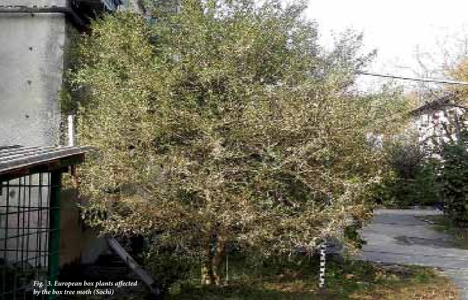
Fig. 3. European box plants affected by the box tree moth (Sochi)